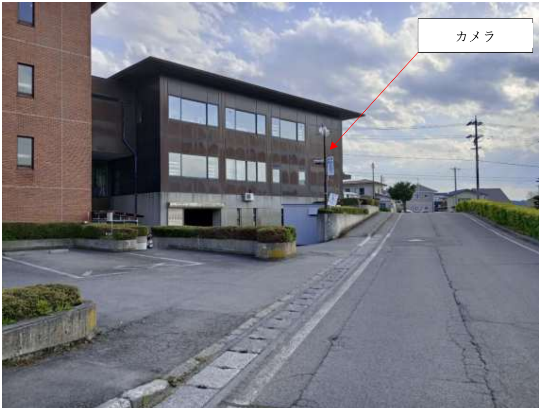
防犯カメラ、表示板、レコーダー等の設置予定箇所を撮影した写真(詳細写真)