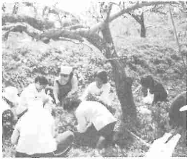
モモの花の下でセリ摘み、盲人福祉協会婦人部