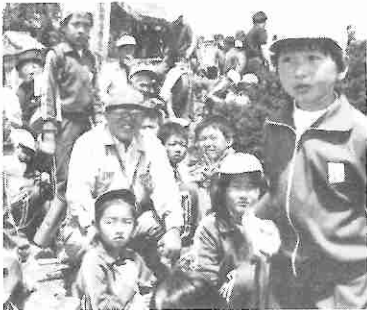
高社山の開山祭、東小学校児童と合流しました。