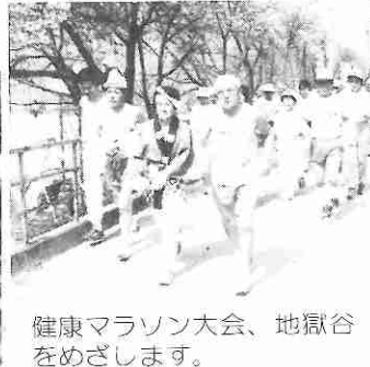
健康マラソン大会、地獄谷をめざします。