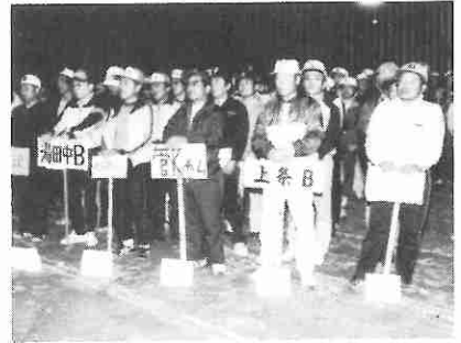
五月七日、ソフトボール開会式と第一戦開始。

五月になると、りんごの開花とともに、野山は急速に緑の色を濃くしてきます。陽気も良くなり各種のスポーツ大会が開幕し、山開祭も行なわれます。