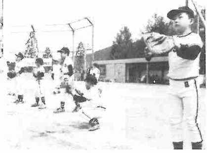
少年野球は肩ならしから、五月十八日、上林グラウンド