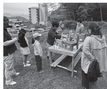
▲つくつかプロジェクトの様子