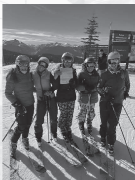
◀交流を行ったベイル町立図書館スキーブッククラブの皆さん