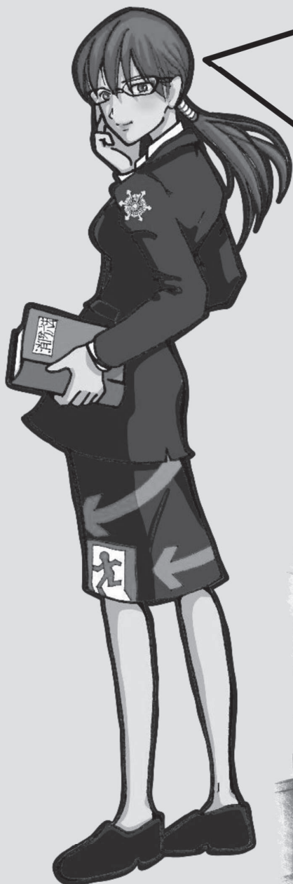
岳南広域消防組合 公式キャラクター

建物火災による死者数のうち、一般住宅による死者数は約90%を占めています。 山ノ内町の住宅用火災警報器の設置率を調査しています。 アンケートはここから！