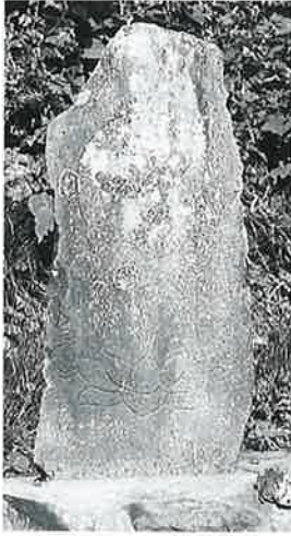
78 坂東観音 表落合(116 ×39×12)