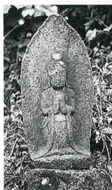
9 馬頭観音 裏落合 明和7年10月(87×34×24)