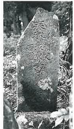
150 供養塔 乘廻(75×30×15)