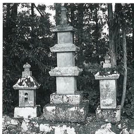
107 庚申三重塔 土橋 安永10年4月(230×32×31)