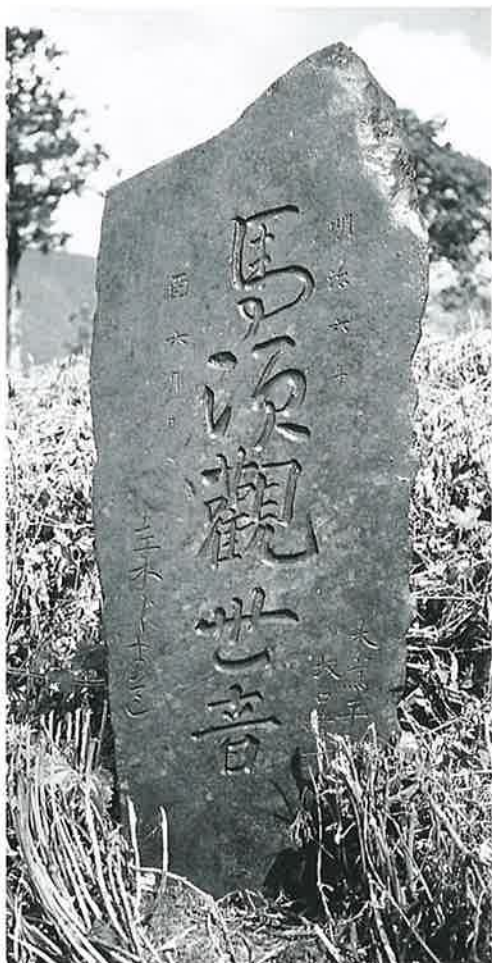
49 馬頭観音 下須賀川 明治 6年 (140×56×12)