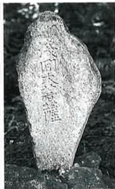
68 浅間碑 下須賀川 嘉永5年9月(96× 32×20)