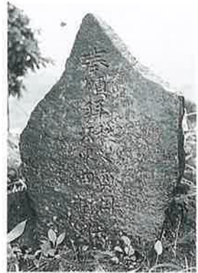
17 供養塔 裏落合(125× 56×7)