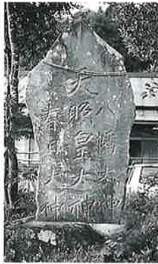
95 神明碑 裏落合 明治21年2月(200×85×10)