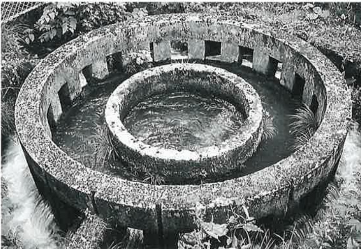
161 分水器 乘廻 昭和12年