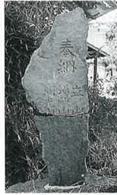
3 修験道奉納塔 下 須賀川 嘉永元年 7月(142×38×14)