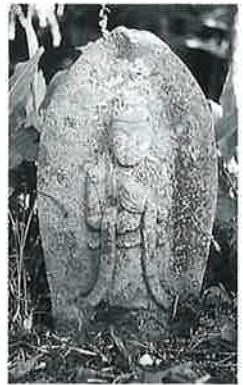
92 大日如来 裏落合 明和4年7月(70×33×22)