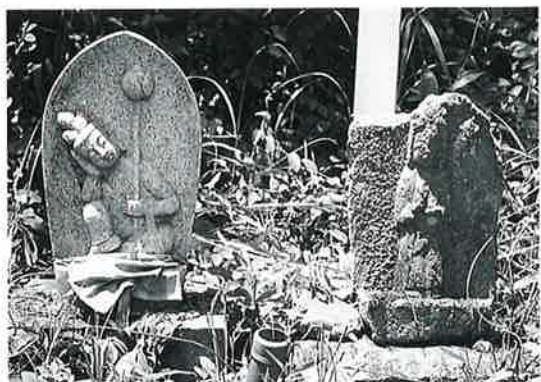
24 如意輪(秋24番) (48×27×14)