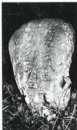
169 苗間部落開拓の碑