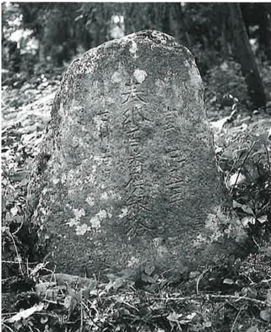
153 供養塔 乘廻 宝暦7年7月(76×60×20)