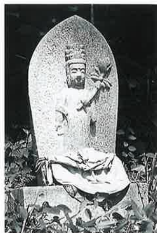
14 十一面観音(秋14番) (48 ×27×13)