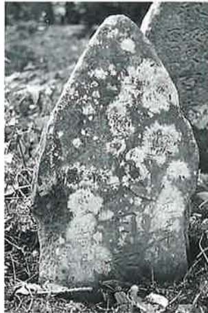
151 大日如来 乘廻 元治元年5月(70×34×13)