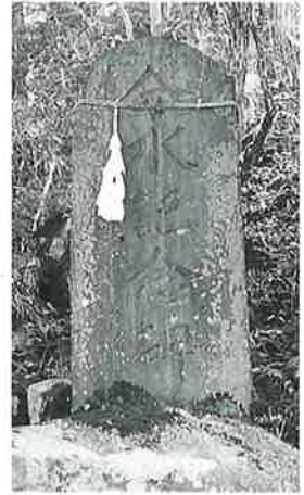
147 分水記念碑 乘廻 昭和22年12月(52×24×21)