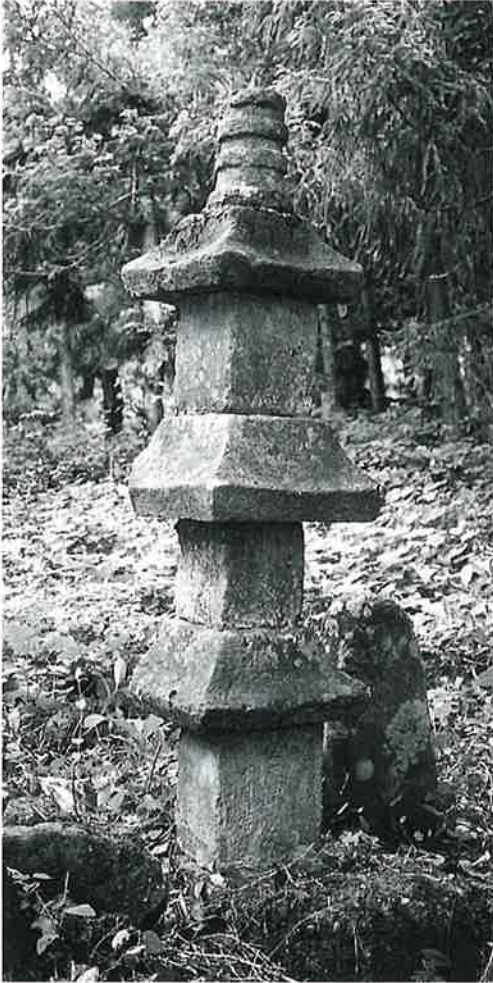
156 庚申三重塔 乘廻 宝曆10年10月(160×24×24)