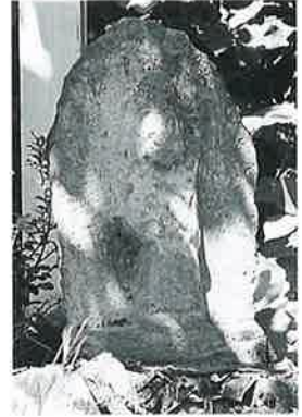
6 十一面観音(秋6番) (50×27×18)