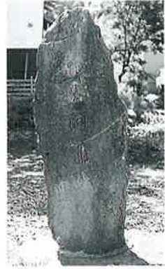
52 名号碑 下須賀川 (110×38×26)