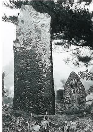
14 馬頭観音 裏落合 弘化4年4月(57×22×15)