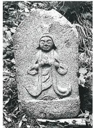
160 馬頭観音 乘廻