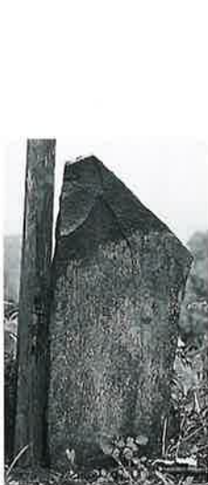
16 坂東観音 裏落合(146×45×9)