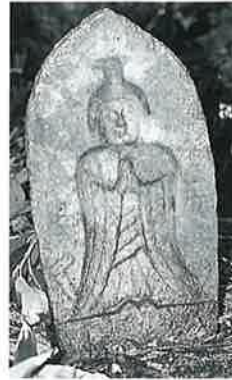
28 馬頭観音 裏落合 嘉永5年4月(49×26×13)