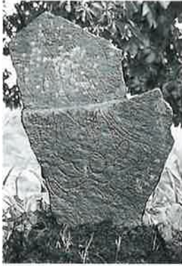
20 坂東観音 裏落合 (120×48×9)