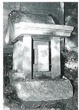
88 戸隠祠 裏落合 明治33年6月(80×70×30)