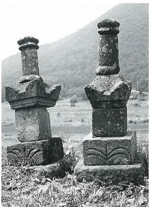
128 宝篋印塔 苗間(127×45×42)