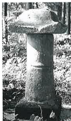
73 常夜燈 下須賀川 宝暦己10月