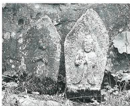
114 馬頭観音 土橋 文政5年3月(50×25×16) 114 馬頭観音 土橋 文政13年(45×20×12)