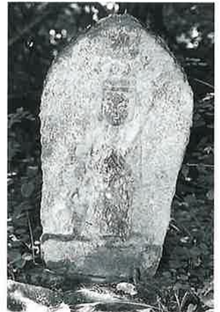
31 十一面観音(秋31番) (54×32×23)