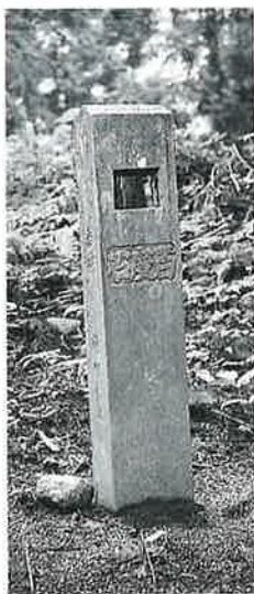
136 百度石 乘廻 昭和10年9月(94×20×18)