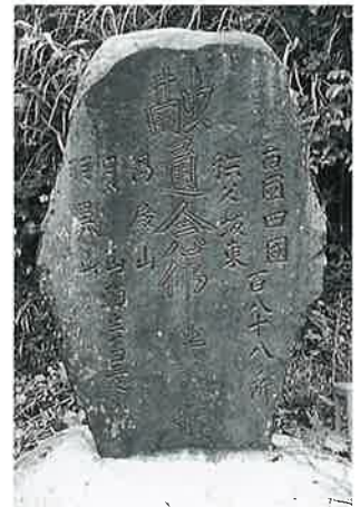
31 供養塔 表落合 安政3年6月(96×66×10)