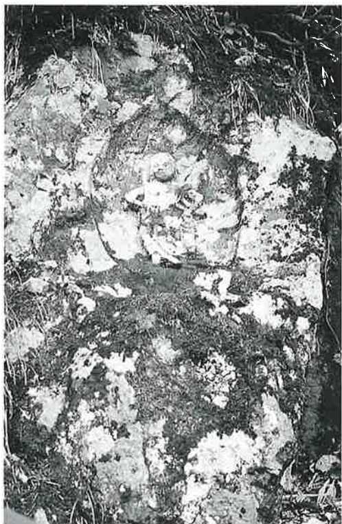
127 磨崖不動尊 乘廻(87×50)