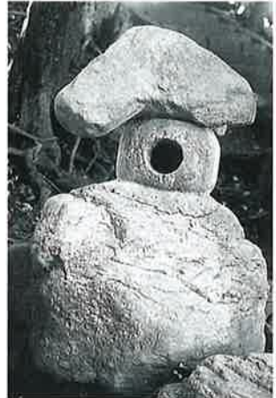
81 石燈籠 表落合(120×28×28)