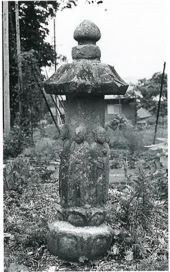
六地藏 (須賀川の部No.109)