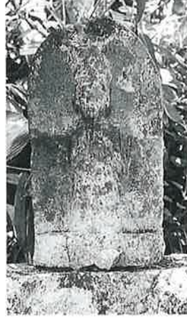
1 十一面観音(秋1番) (49×28×20)