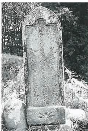
125 供養塔 苗間 寛文12年2月(142×43×30)