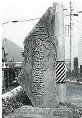
103 三界万霊等 土橋 文化2年5月(255×90×33)