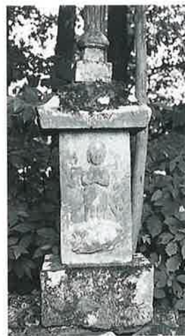
106 庚申塔 土橋 宝暦9年9月(116×28×24)