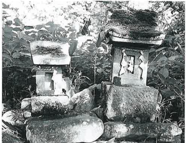
79 飯綱祠 裏落合 文化14年2月(70×23×21) 79 飯綱祠 裏落合 文化14年3月(45×16×15)