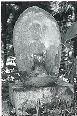
13 十一面観音(秋13番) (53×32×21)