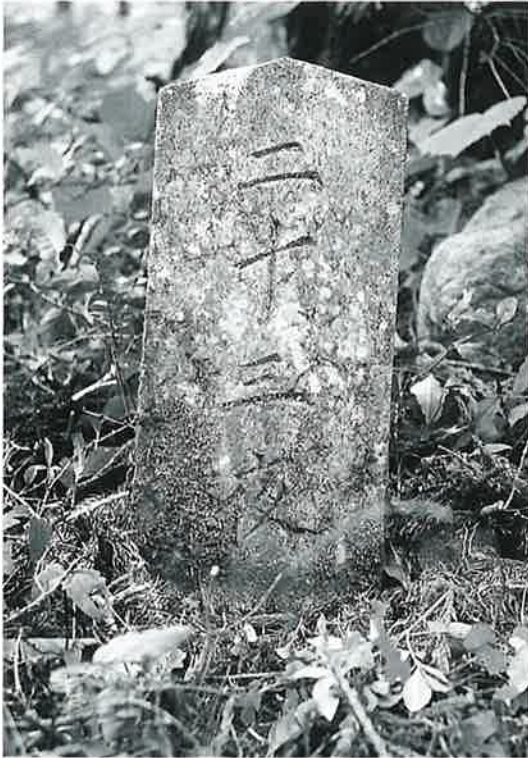
148 二十三夜塔 乘廻 明治16年10月(58×22×14)