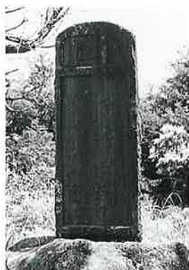
36 記念碑 表落合 昭和26年10月(130×50×15)