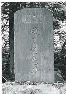
118 記念碑(上水道) 中須賀川 昭和32年9月(210×70×15)