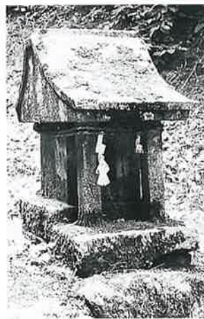
121 戸隠祠 苗間 明治33年8月(29×29×30)