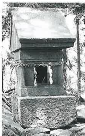
37 大山祇命 中須賀川(90×42×66)