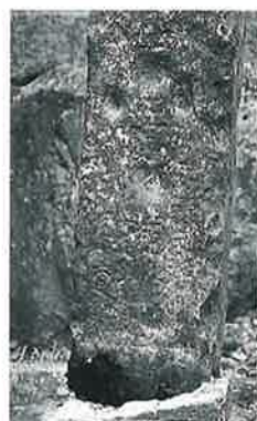
110 念仏供養塔 中須賀川 元禄元年(115×23×20)