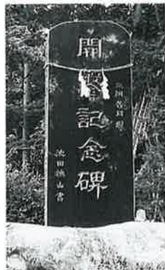
140 記念碑(開発) 竜王 昭和63年10月(322×112×18)