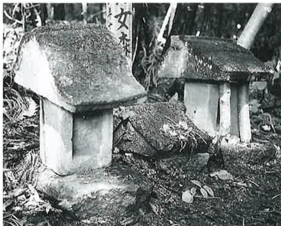
44 供養塔(おはん) 下須賀川 正徳 3年 5月 (55×36×47)