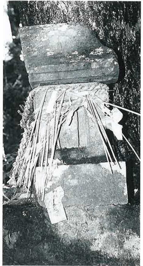
75 不動明王 下須賀川 元禄2年(60×30× 46)