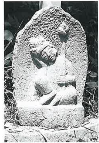
9 如意輪(秋9番) (45×30×18)