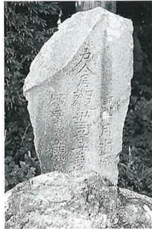
57 観世音 下須賀川(133×41 ×15)