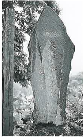
19 百番観音 乗廻 明治 26年5月(158×59×9)