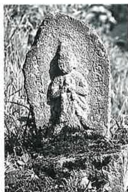
74 聖観音 下須賀川 天保3年(45×27×17)