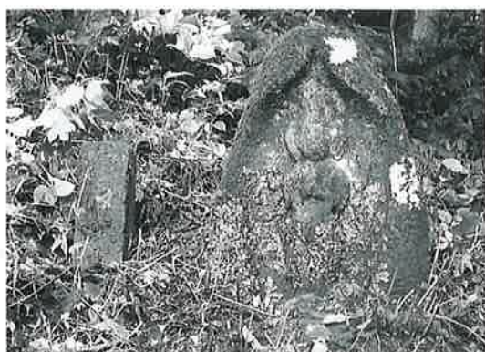
34 馬頭観音 表落合(90×64×38)