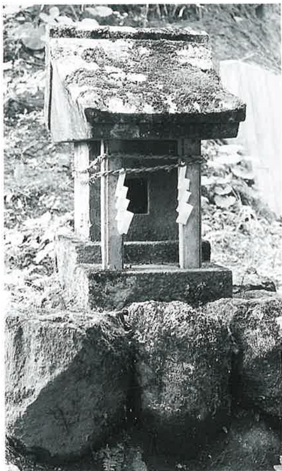
120 不動明王 苗間 明治41年11月(85×29×28)