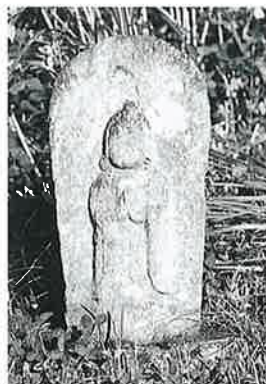
89 馬頭観音 裏落合 宝暦(68×29×22)