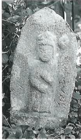
2 十一面観音(秋2番) (48×25×16)