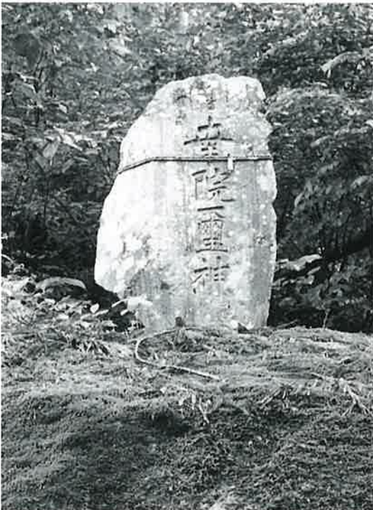
33 水神碑(幸院靈神) 表落合 明治28年(133×55×40)