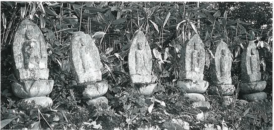
94 六地藏 裏落合(83×32×14)