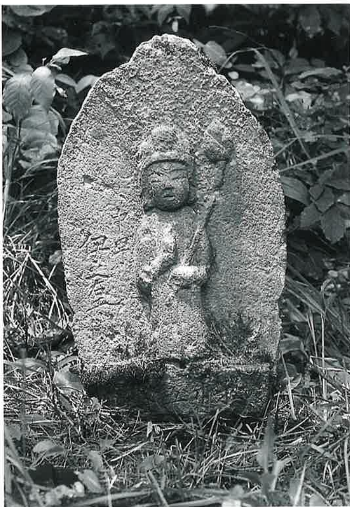
25 十一面観音(秋25番) (53×32×17)