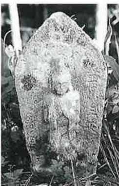
91 馬頭観音 裏落合 宝暦3年6月(70×32×23)