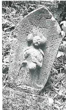
162 十三面観音 乗廻 宝暦3年(97×39×20)