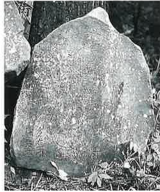
10 坂東観音 裏落合(65×60×12)