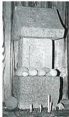
32 正八幡塔 表落合 (66×29×38)