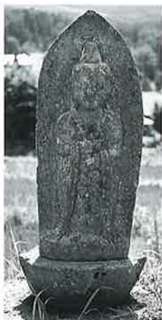
46 聖観音 下須賀川 文政元年 8月 (46× 28×14)