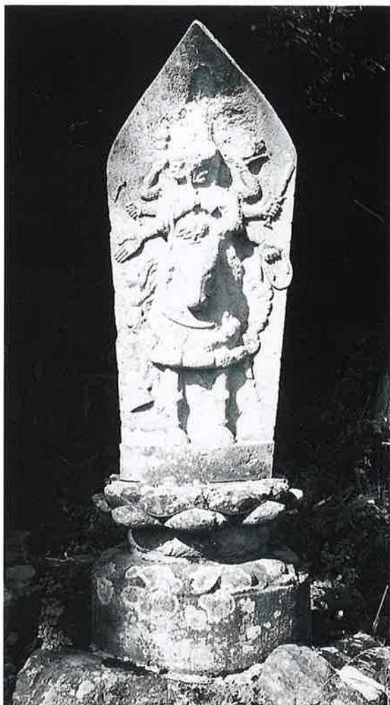
61 勝軍地藏 下須賀川 明治7年9月(220×63×30)