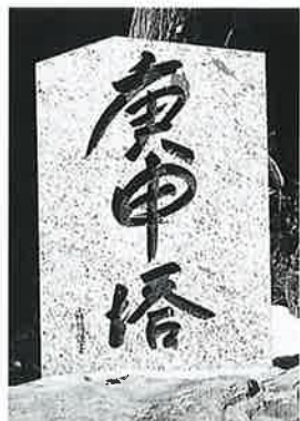
62 庚申塔 下須賀川 昭 和55年12月(90×60×12)