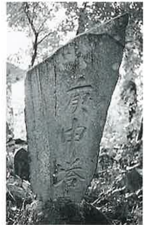
29 庚申塔 裏落合 万延元年3月(145×48×10)