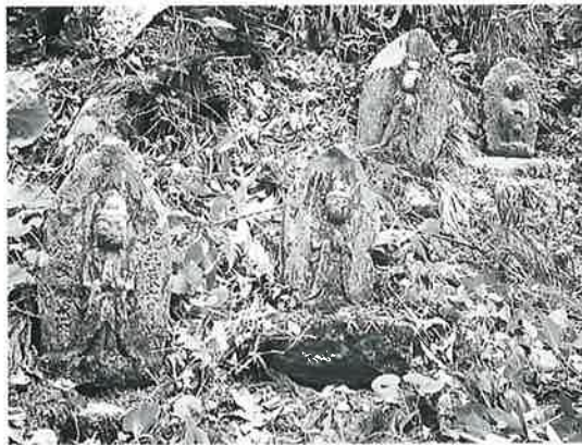
164 馬頭観音群 乗廻 寛政4年9月(63×30×13)