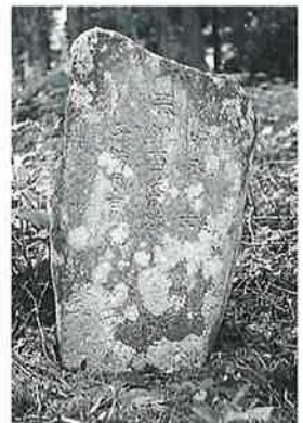
152 供養塔 乘廻 安永9年2月(73×37×16)