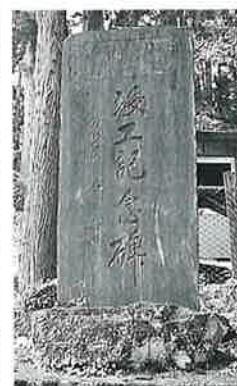
119 記念碑(上水道) 苗間 昭和34年10月(290×88×11)