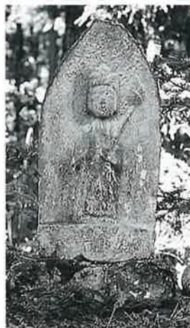
21 十一面観音(秋21番) (50×27×13)