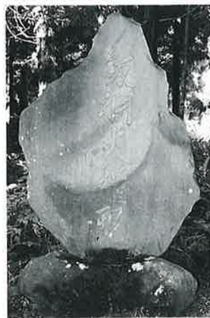
72 飯綱権現碑 下須賀川 文久3年(200×120×22)