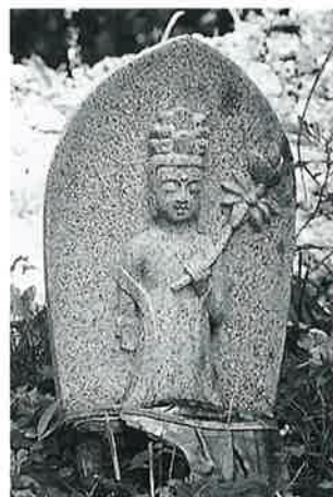
17 十一面観音(秋17番) (51 ×17×14)