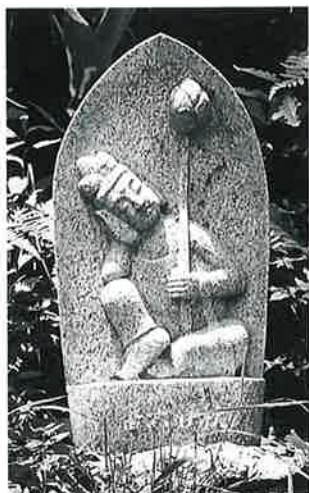
26 如意輪(秋26番) (47×24×14)