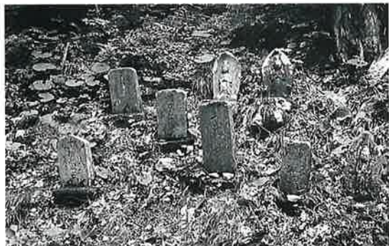
166 馬頭観音群 乗廻 明治38年8月(70×24×18)