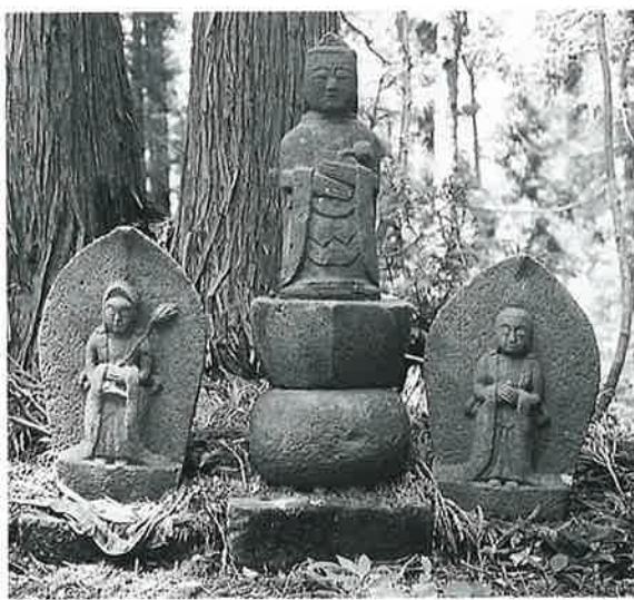
135 観世音 苗間