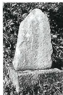
76 供養塔 下須賀川 寛政2年(70×37×19)