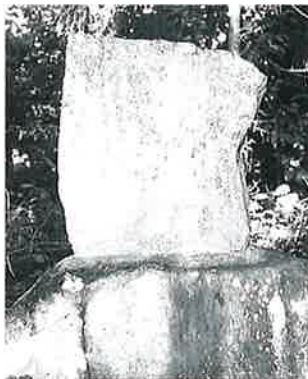
86 坂東観音 表落合(90×47×12)