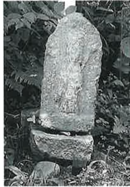
7 馬頭観音(秋7番) (53×25×20)