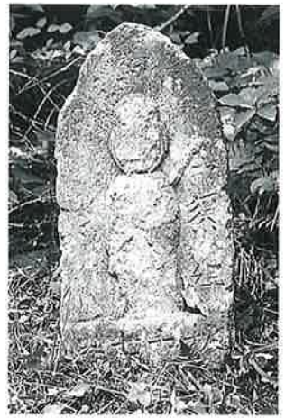
28 十一面観音(秋28番) (54×26×18)