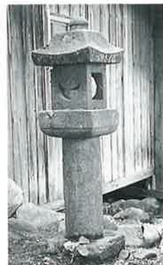
117 常夜燈 中須賀川 享保19年8月(152×45×44)