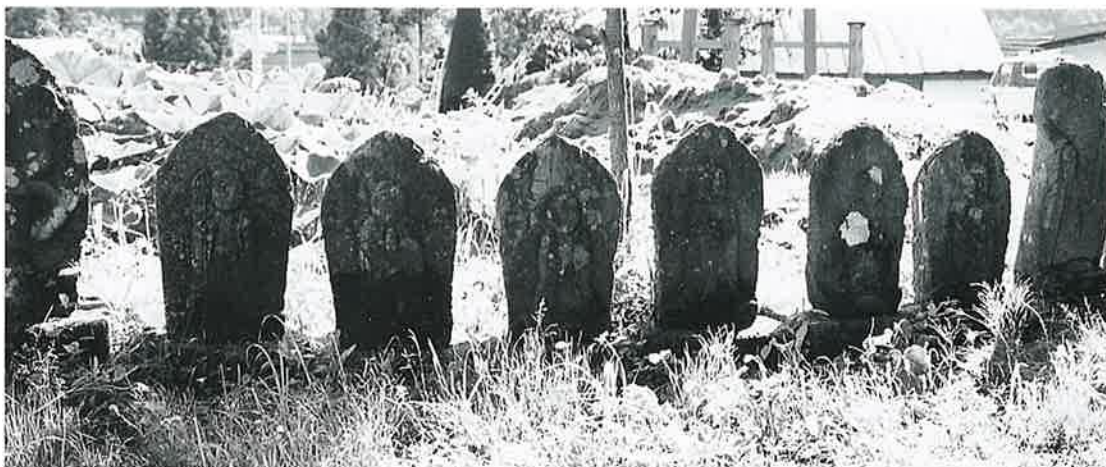
65 六地藏 下須賀川 慶応2年6月(57×30×15)