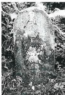
6 馬頭観音 裏落合 宝暦11年5月(77×30×17)