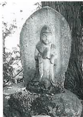
130 聖観音 苗間 宝暦11年9月(70×42×23)