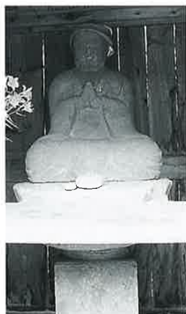
7 地藏尊 裏落合 延享2年5月(175×56×32)