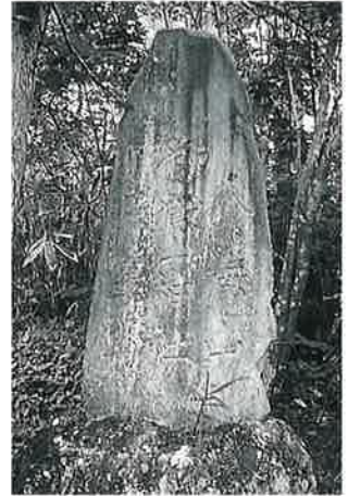
158 御嶽神社 乘廻 明治21年7月(260×72×20)