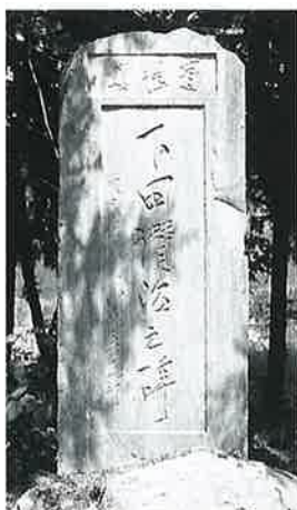
39 頌徳碑 中須賀川(150×50×15)