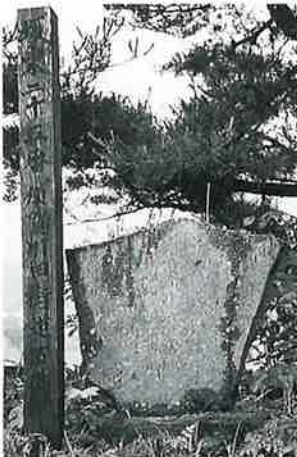
13 坂東観音 裏落合(74×61×8)