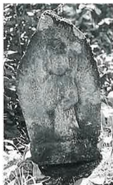
18 十一面観音(秋18 番) (53×30×22)