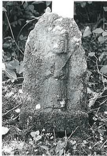
33 十一面観音(秋33番) (43×23×18)