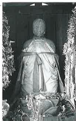
122 地藏尊 苗間(95×45×45)