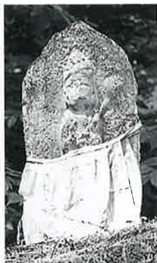
23 十一面観音(秋23番) (43×23×17)