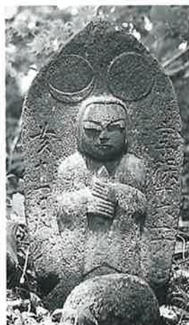
134 庚申塔 苗間 享保16年11月(58×30×15)