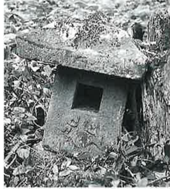
157 庚申塔 乘廻(60×43×43)