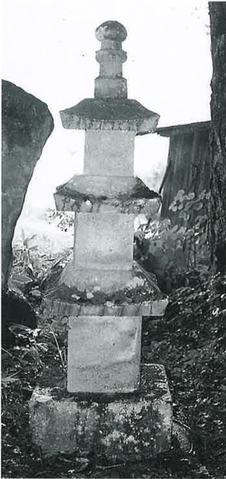
24 庚申三重塔 裏落合 宝曆11年6月(177× 50×50)