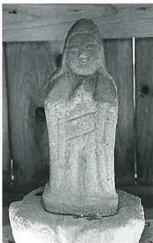
50 聖観音 下須賀川 (38×11 ×7)