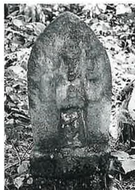
20 千手観音(秋20番) (56×32×12)