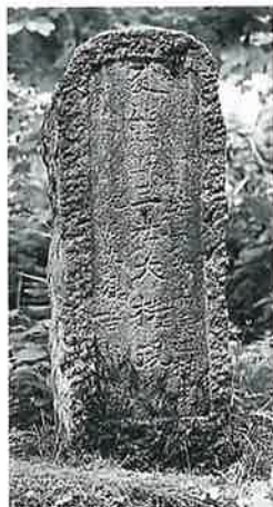
139 熊野大権現 乘廻 安永7年9月(107×35×26)