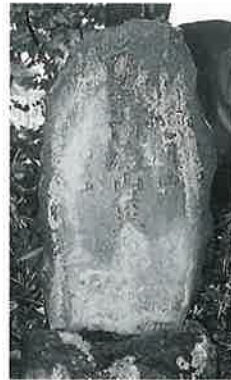
30 供養塔(湯殿山) 裏落合 文化13年4月(135×57×30)