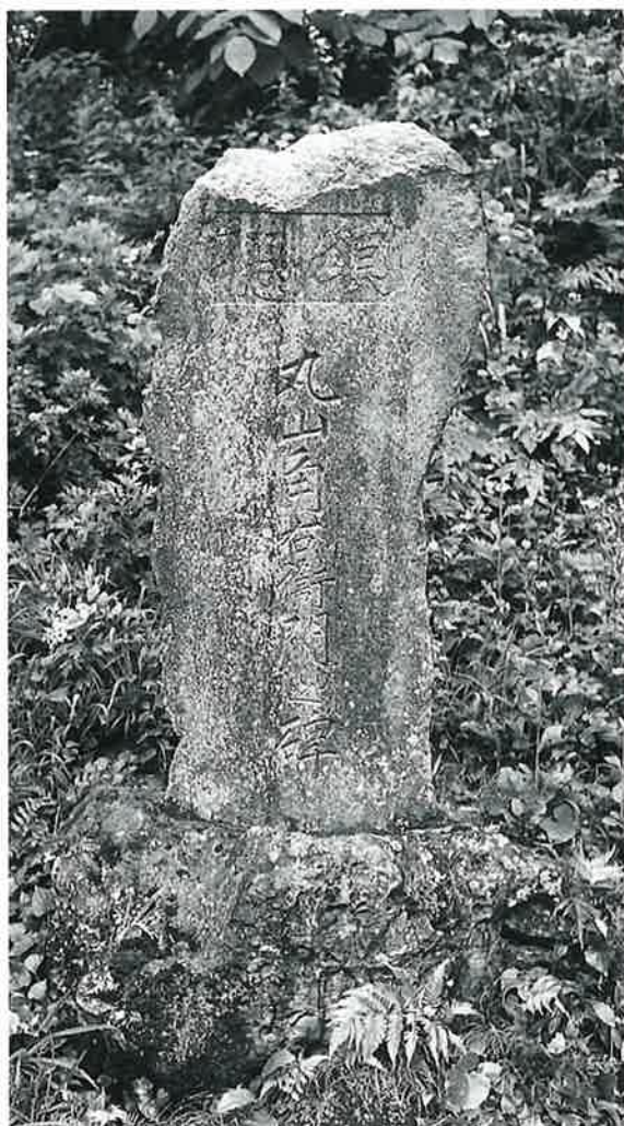
5 頌徳碑 裏落合 昭和9年5月(110×60×30)