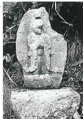
1 馬頭観音 大持坂 享保3年8月(62×48×12)