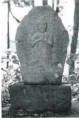
54 馬頭観音 下須賀川 文化 5年(47×33×18)