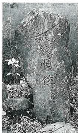
111 供養塔 中須賀川 (110×50×30)