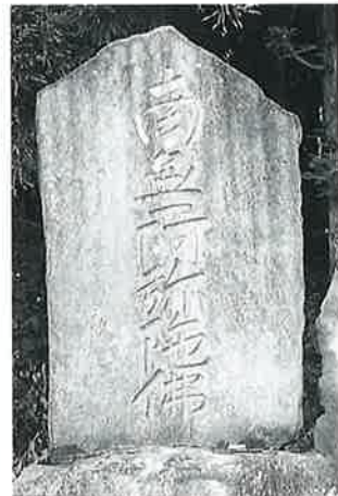
59 名号碑 下須賀川 安政 3年(230×100×11)