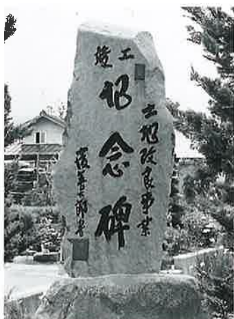
115 記念碑(土地改良) 中須賀川 昭和59年7月(258×90×34)