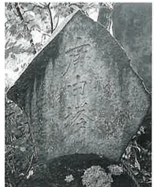
23 庚申塔 裏落合 大正9年 9月(135×94×17)