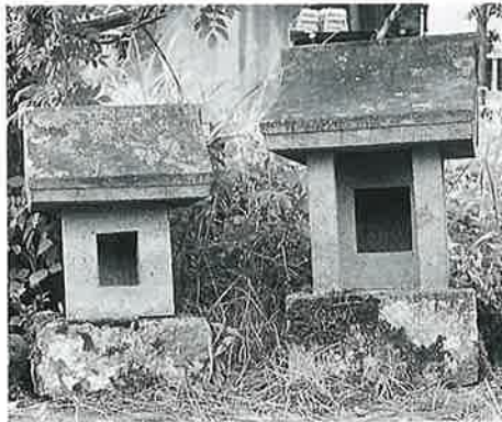
143 奉浄殿 竜王(63×30×27) 143 秋葉山 竜王(50×24×22)