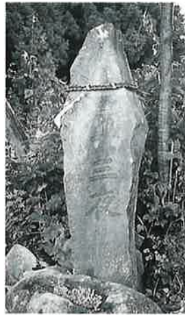
93 二十三夜塔 裏落合 (190×55×30)