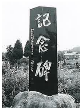
113 記念碑(土地改良) 土橋 昭和58年12月(260×58×20)