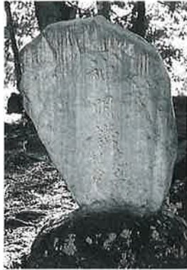
83 神明記念塔 表落合 大正5年5月(150×90×18)