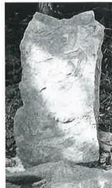
60 三界万霊塔 下須 賀川 天保3年 (139×70×20)