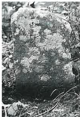
154 供養塔 乘廻 文政3年8月(52×26×20)