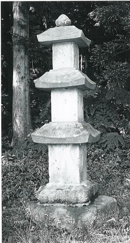
58 念仏三重塔 下須賀川 延享元年(230×66×66)