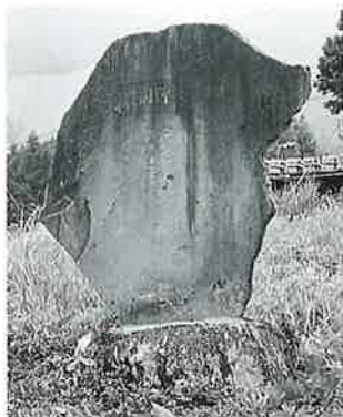
141 記念碑(開発) 竜王 大正11年5月(200×135×22)