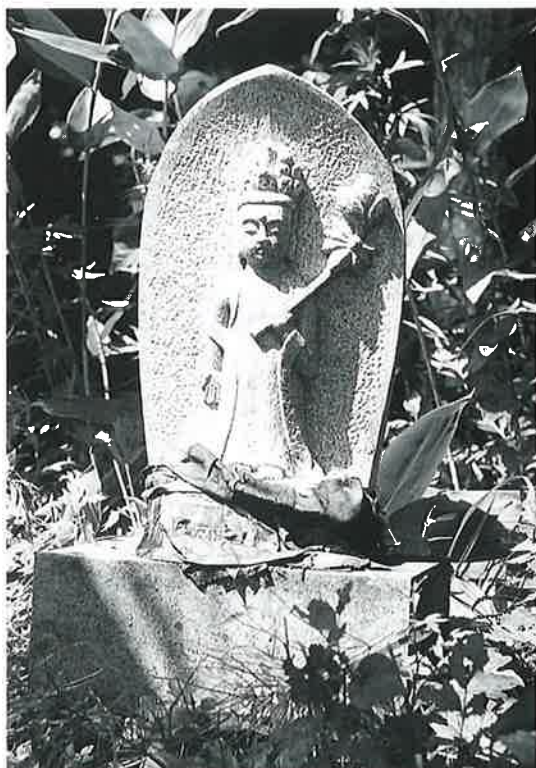
16 十一面観音(秋16番) (50×28×14)