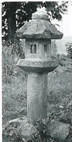
101 常夜燈 土橋 明治9年(110×90×70)