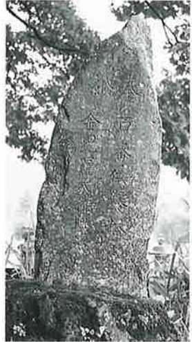
21 供養塔 裏落合 文化 14年5月(125×35×7)