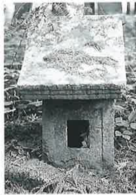
138 大山祇命 乘廻 文政3年8月(52×24×21)