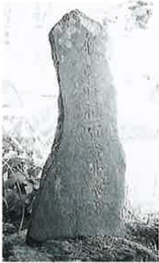
84 供養塔(巡礼百番) 表落合 享保9年9月(113×46×13)