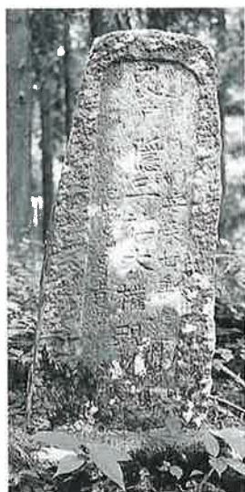
137 戸隠社碑 乘廻(105×40×30)