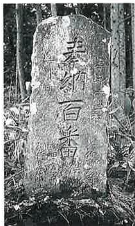
167 供養塔 嘉永6年3月 (155×57×20)