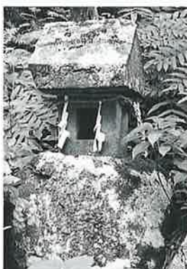
129 大山祇命 苗間 大正4年8月(56×40×48)