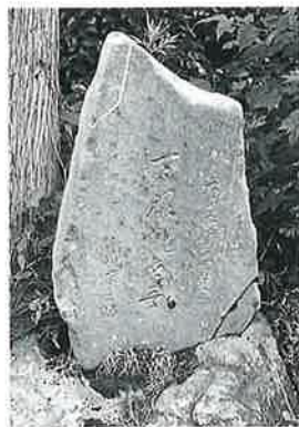
102 馬頭観音 土橋 大正元年(100×40×10)