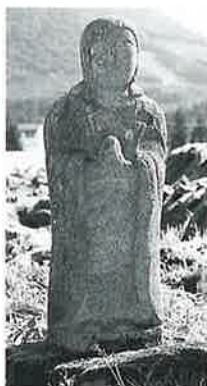
66 地藏尊 下須賀 川(72×30×20)