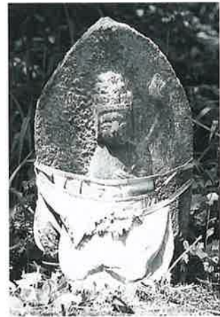
11 十一面観音(秋11番) (53×31×16)