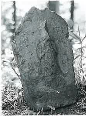
55 馬頭観音 下須賀川 文政2年8月(46×28× 14)