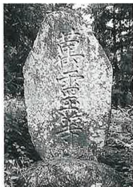
144 万霊塔 乘廻 寛政2年4月(172×77×22)