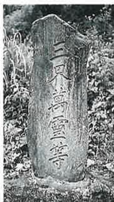
4 三界万霊塔 裏落合 文久3年4月(200×57×40)