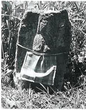
29 十一面観音(秋29番) (40×27×17)