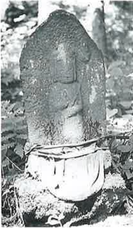
3 十一面観音(秋3番) (50×26×18)