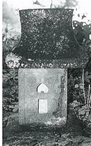
25 庚申塔 裏落合 元禄12年 9月(74×44×44)