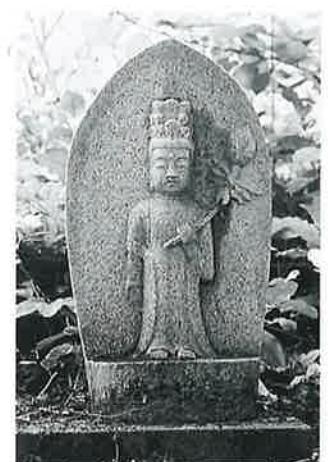
32 十一面観音(秋32番) (49×27×13)