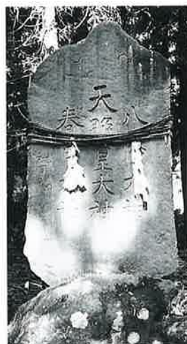
71 神明碑 下須賀川 明 治27年5月(255×100× 19)