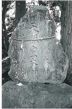
82 神明塔 表落合 明治5年5月(225×126×50)