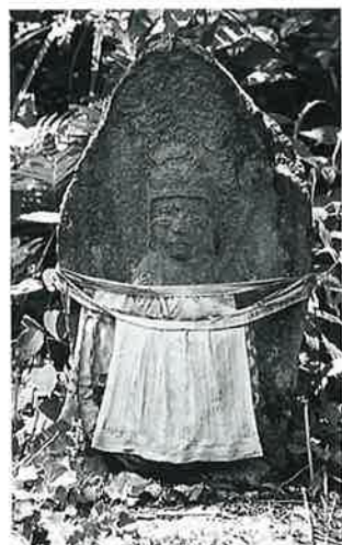
27 十一面観音(秋27番) (52×28×20)