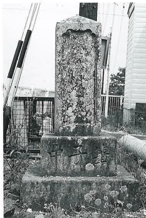
104 筆塚 土橋 文政2年(185×40×40)