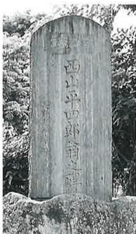
38 頌徳碑 中須賀川(165×73×12)