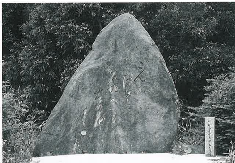
142 句碑 竜王 昭和61年8月(240×250×90)