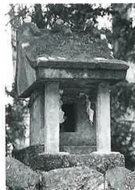
146 大山祇命 乘廻 明治33年11月(70×30×30)