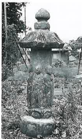
109 六地藏 中須賀川 (160×54×100)