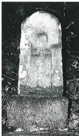
90 庚申塔 裏落合 享保7年9月(88×35×20)