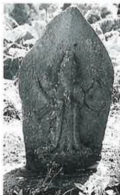
63 庚申塔 下須賀川 安永9年1月(76× 38×17)