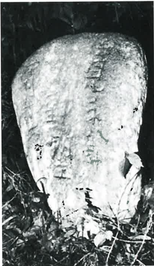
苗間部落開拓の碑(須賀川の部No.169)