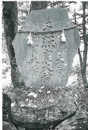
98 神明碑 土橋 明治22年7月(240×120×21)