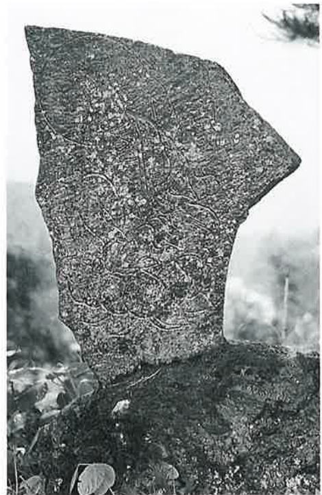
15 西国観音 裏落合 嘉永3年8月(105×60×10)