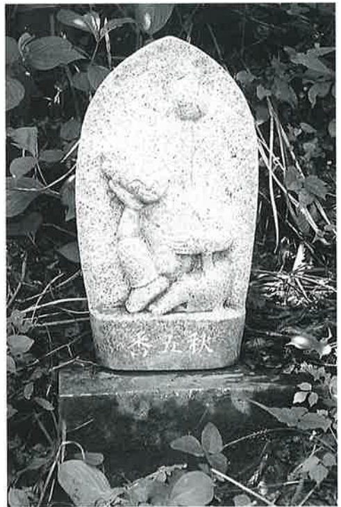
5 如意輪(秋5番) (47×25×14)