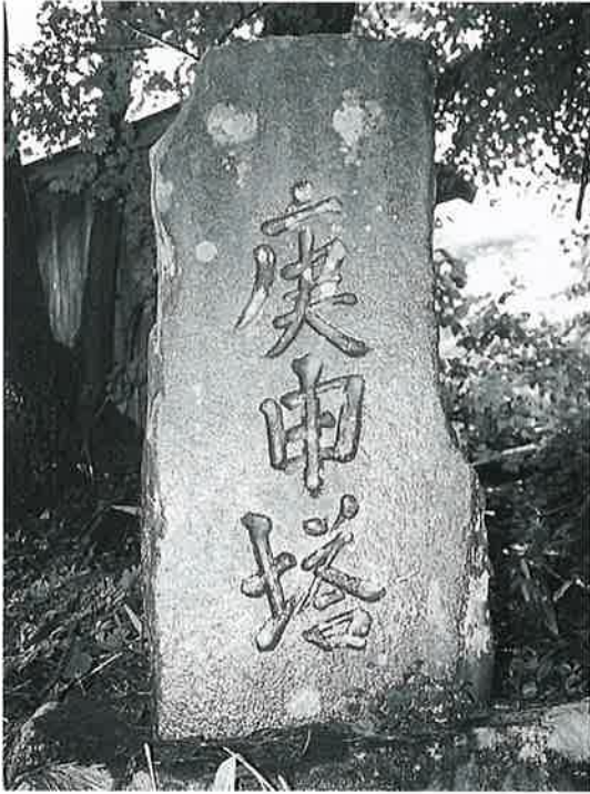
27 庚申塔 裏落合 寛政12年9月(150×60×27)