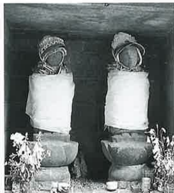
145 地藏尊 乘廻 安永8年4月(100×35×35)