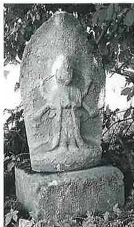
45 庚申塔 下須賀川 天 明元年 5月 (98×37× 20)