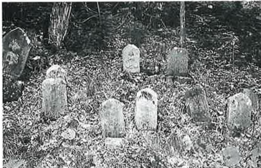
165 馬頭観音群 乗廻 明治21年5月(62×25×11)