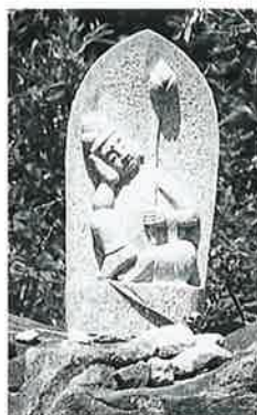
15 如意輪(秋15番) (46×24×14)