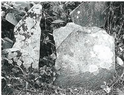
2 供養塔 裏落合 天明4年12月(90×37×10)