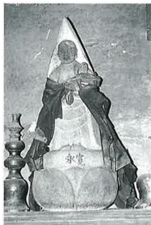
126 観世音 乘廻(73×31×31)