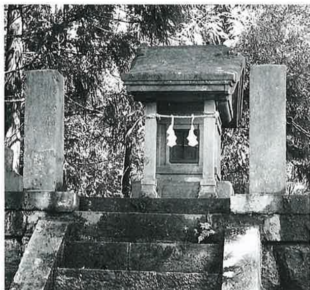
43 美須々宮 下須賀川(178×100×85)