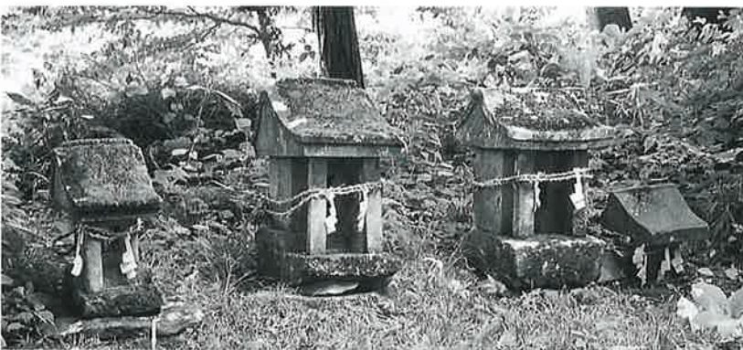
99 大山祇命 土橋(58×19×19)