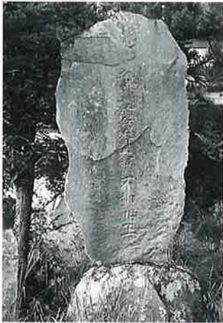
96 不動明王 裏落合 明治21年10月(207×81×6)