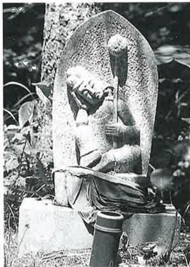
12 如意輪(秋12番) (46×25×14)