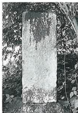
124 供養塔 苗間(74×27×27)