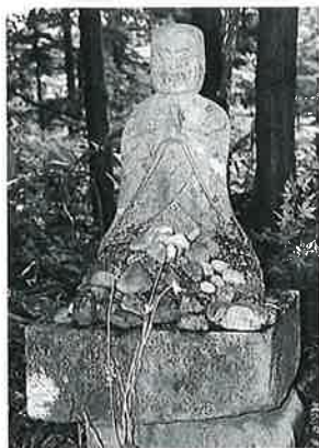
168 地藏尊 乗廻(65×40×25)