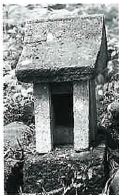
69 戸隠祠 下須賀川 (63×28×46)