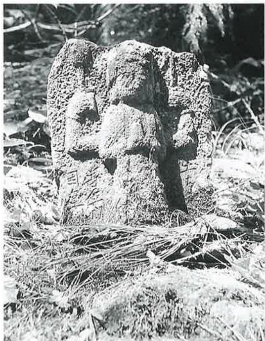
19 千手観音(秋19番) (38×31×11)