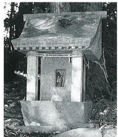
85 大山祇命 表落合 文化8年(35×33×30)