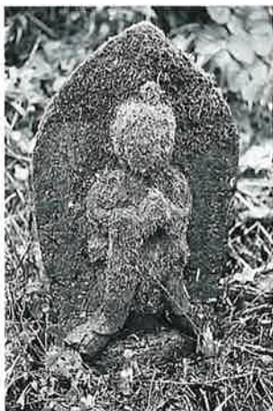
3 馬頭観音 裏落合 延享5年6月(55×35×30)