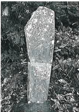
87 神祇碑(日本大小之神祇) 裏落合(144×33×12)