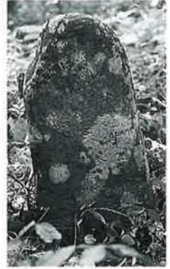
155 供養塔 乘廻 明治7年2月(62×28×13)