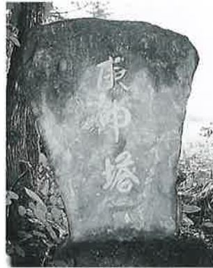
22 庚申塔 裏落合 昭和55年 6月(170×110×20)