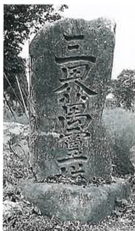
108 三界万霊塔 中須賀川 寛政元年3月(200×80×33)