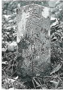
149 大日如来 乘廻 明治16年10月(62×22×15)