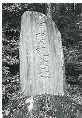
35 記念碑 裏落合 昭和34年10月(155×75×10)