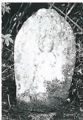
51 馬頭観音 下須賀川 文化11年 (70×28×10)