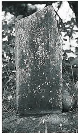
12 観世音 裏落合 安政2年10月(73×26×7)