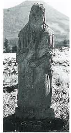
26 観世音 下須賀川 (83×28×17)