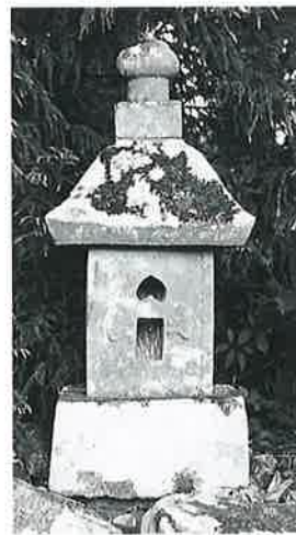
105 庚申塔 土橋 元禄6年(103×28×26)