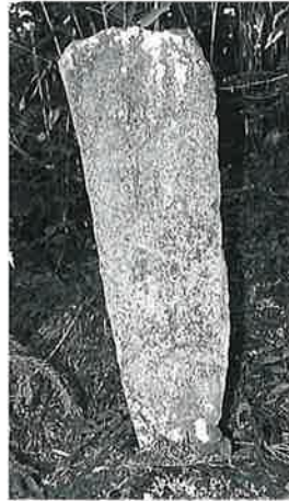
159 妙見神社 乘廻 明治29年9月(117×34×10)