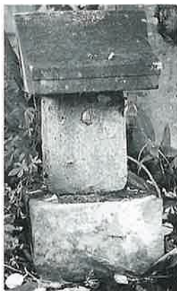
48 法印祠 下須賀川 安永 8年 (52×30×38)