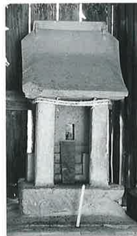
133 金毘羅祠 苗間(80×40×62)