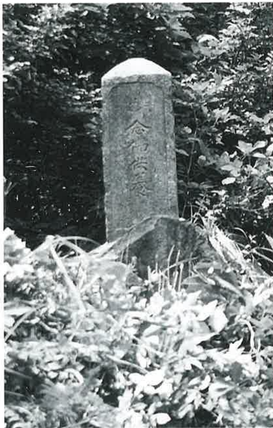
132 念仏供養塔 苗間 元禄元年9月(130×28×23)