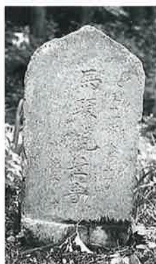
42 馬頭観音 下須賀川 大正11年8月(53×30×15)