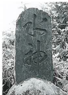
112 水神碑 中須賀川 昭和32年8月(58×30×10)