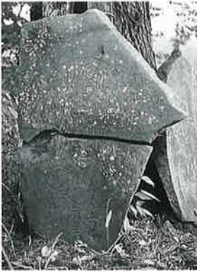
11 坂東観音 裏落合(100×63×10)