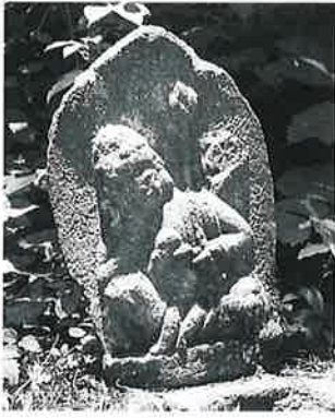
30 如意輪(秋30番) (54×32×18)