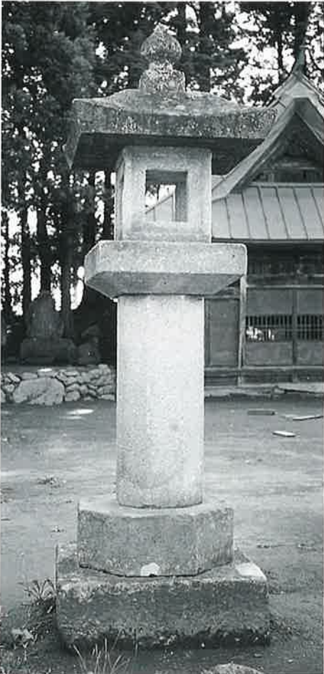
80 石燈籠 表落合 天明元年7月(216×70× 70)