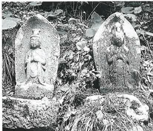
163 馬頭観音 乗廻 文化13年3月(50×30×19) 163 馬頭観音 乗廻 文化6年(65×30×14)