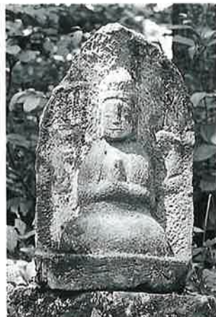
22 千手観音(秋22番) (46×28×22)