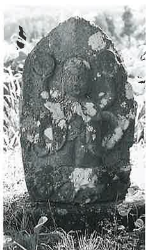
64 庚申塔 下須賀川 寛延 4年10月(68×38×20)