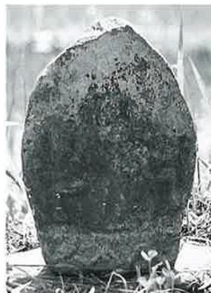
47 庚申塔 下須賀川 (38×17 ×13)