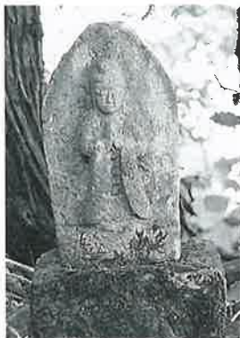
131 馬頭観音 苗間 天保3年(64×22×16)