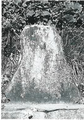
77 坂東観音 表落合(90×60× 12)