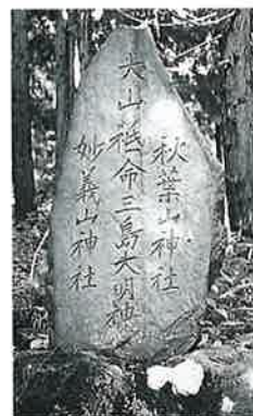
70 大山祇命 下須賀 川 明治15年12月 (156×62×28)