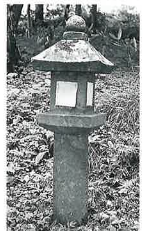
97 常夜燈 土橋 明治19年9月(160×46×46)