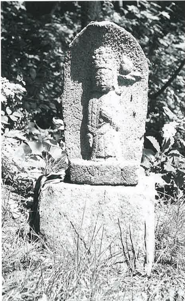
4 十一面観音(秋4番) (52×28×18)