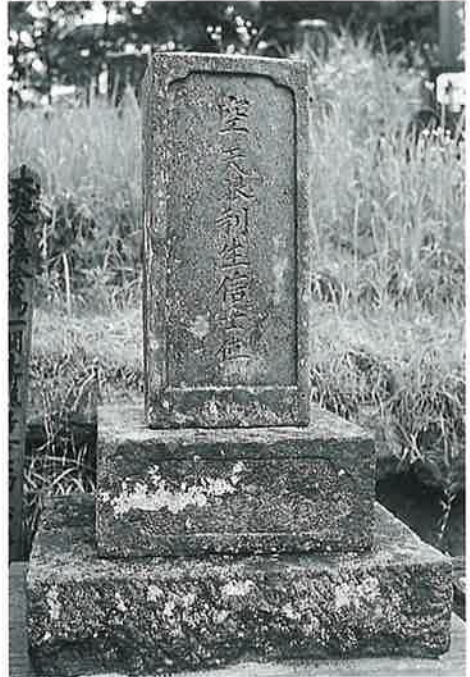
8 筆塚 裏落合 安政4年8月(119×27×21)