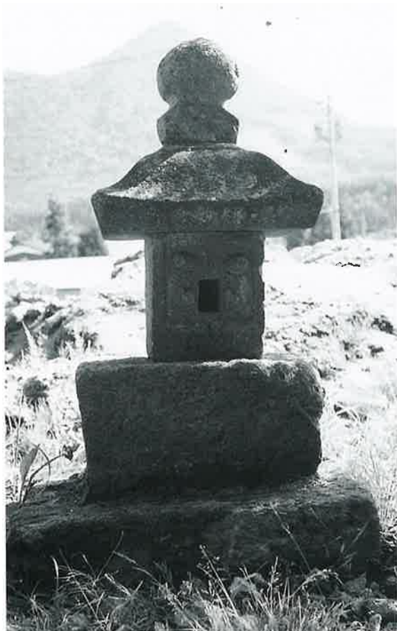
67 庚申塔 下須賀川 元禄17年5月(100×40×40)