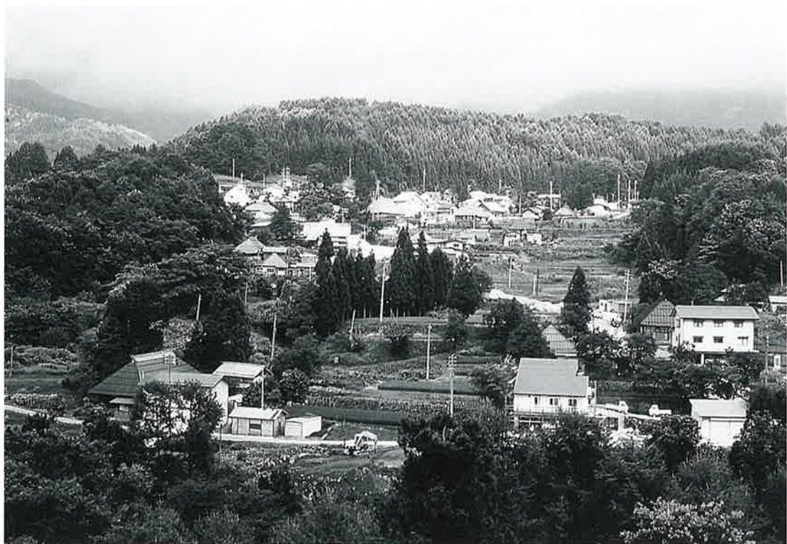
須賀川 とりで観音が見守る山間地—

この地区は高社山の東に位置し、標高七〇〇前後の山間地で、八つの集落からなっている。住民は縄文前期のころより住んでいたが、開拓の始められたのは寛永に入ってからである。近隣の集落と水論・山論などもあったが、幕末には現在の平穏な状態に落ちついた。 交通上からは、飯山方面と山ノ内・草津方面への重要な通路をなし、とりで観音をはじめ多種多様な信仰の香りある石造物が存している。