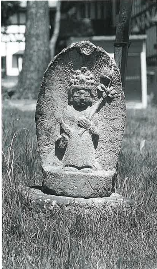
8 十一面観音(秋8番) (51×30×20)