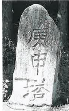
56 庚申塔 下須賀川 寛政12年7月(48× 67×42)