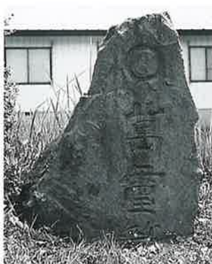
123 万霊塔 苗間(115×70×21)