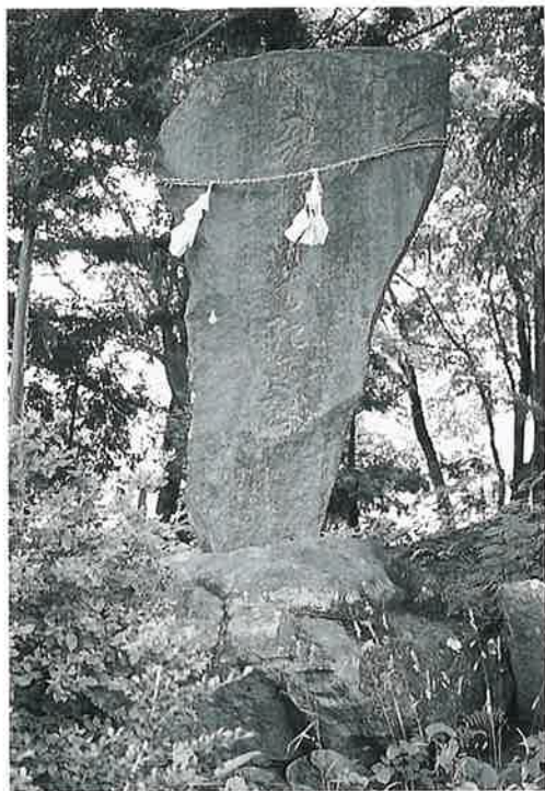
100 記念碑(新堰) 土橋 明治15年10月(300×140×25)