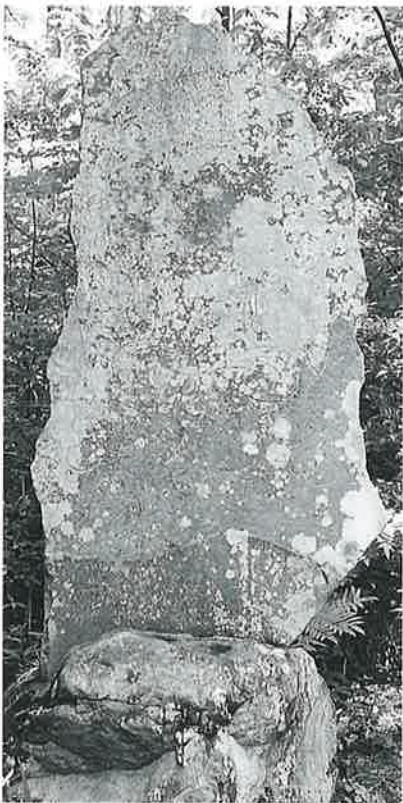
34 千手観音(秋34番) (213×96×12)