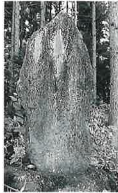
18 供養塔 乗廻 慶 応2年3月(160× 62×50)