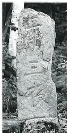
40 二十三夜塔 下須賀川(64×22×18)