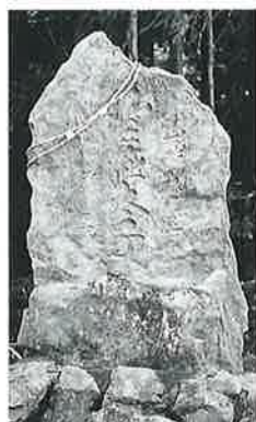
41 聖徳太子 下須賀川 昭和3年11年(160×70×40)