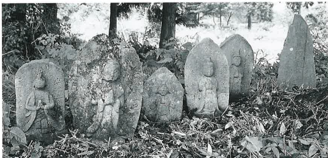
116 馬頭観音群 中須賀川 弘化3年9月(78×32×19)