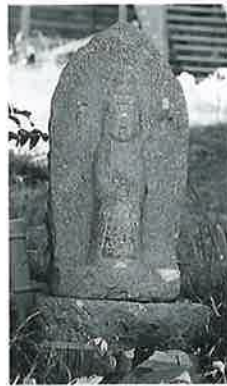
10 十一面観音(秋10番) (50×27×18)