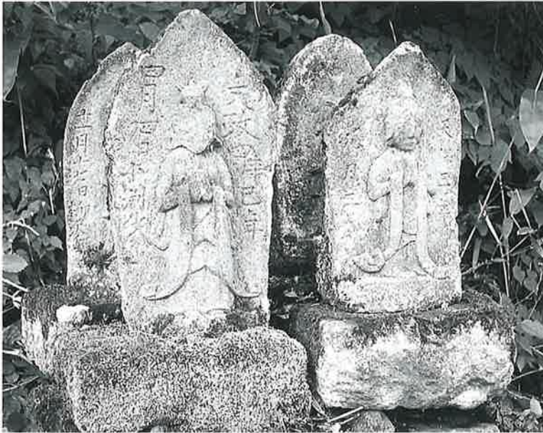
10 馬頭観音 横倉山ノ脇 文政4年4月(64×28×20) 10 馬頭観音 横倉山ノ脇 天保3年9月(59×26×16)