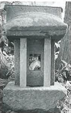
41 辨財天祠 横倉柳原 元文4年(40×22×20)