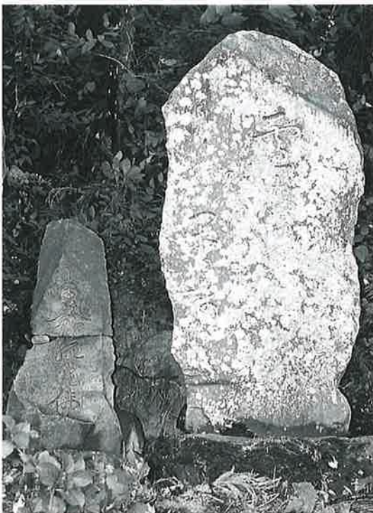
15 句碑(芭蕉) 横倉山ノ脇 天保14年10月(178×70×40)