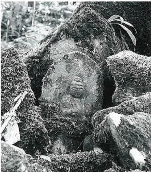
91 弁財天 横倉鴨小場 明和7年 7月吉日 (31×25×15)