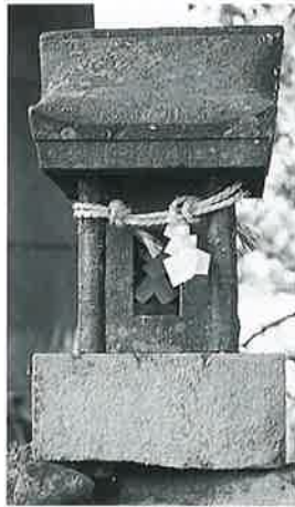
22 祠(宣澄社) 横倉天神 森 明治6年(58×26× 29)