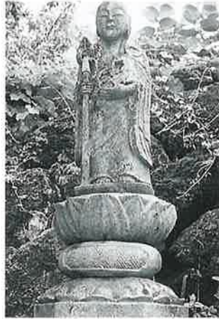
35 地藏尊 横倉道陸神(125×26×23)