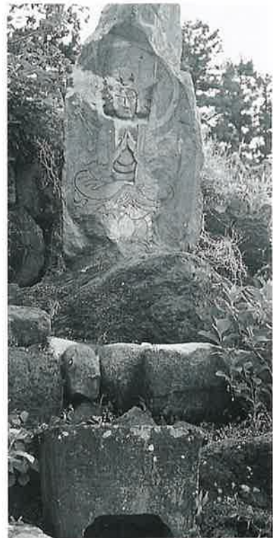
28 馬頭観音 横倉道陸神 万延元年6月(240×90×30)