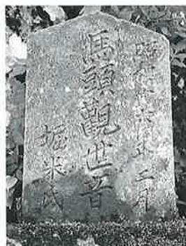
50 馬頭観音 横倉柳原 昭和10年2月(57×27 ×15)