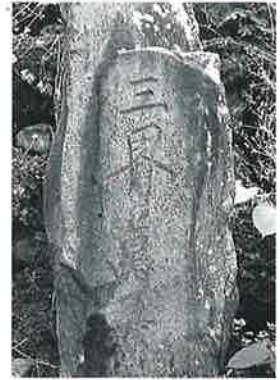
34 供養塔 横倉道陸神(170×80×35)