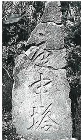
81 庚申塔 横倉岩下 万 延元年6月(100×35×10)