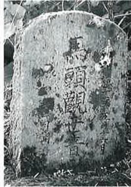
85 馬頭観音 横倉藤ノ木 昭和32年 5月 (57×25× 12)