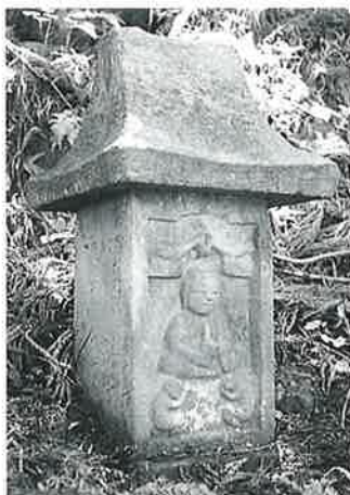
46 庚申塔 横倉藤ノ木 享保6 年正月(85×30×25)