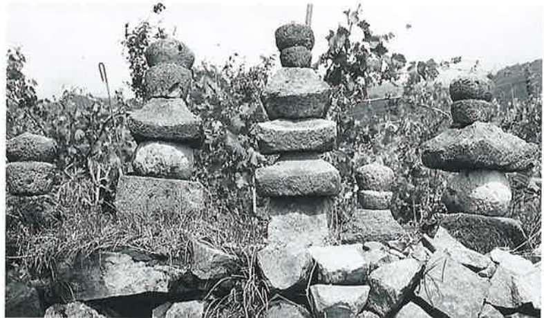
49 五輪塔 横倉柳原(80)