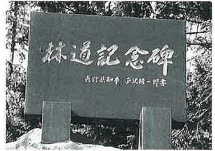
78 記念碑(林道) 横倉藤後坂 昭和48年12月(64×93)