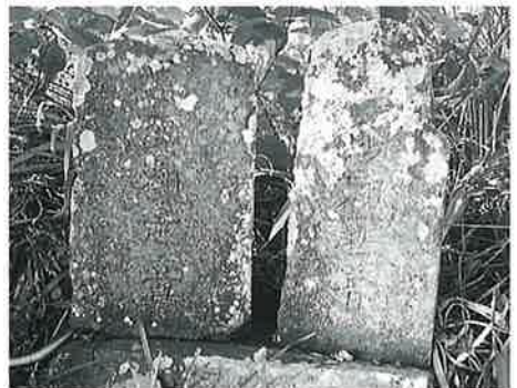
82 馬頭観音 横倉土平 明治16年(20×15×43)