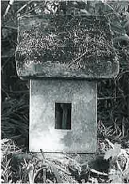
87 社宮神祠 横倉社宮神 大正14年 8月 (25×24× 87)