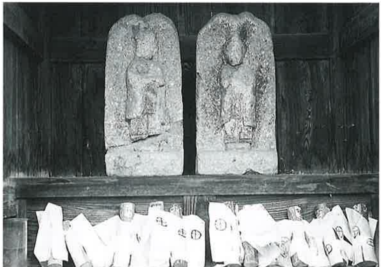
24 道祖神 横倉道陸神 元禄時代?(45×21×10)