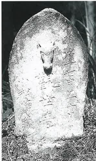
32 馬頭観音(一部浮彫) 横倉城裏 明治17年10月(54×28×12)