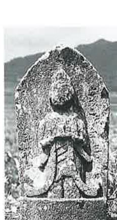
47 馬頭観音 横倉腰 巻 安政3年3月 (65×28×20)