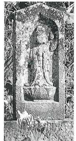
73 供養塔(浮彫) 横 倉上野 文化6年 3月(28×20×68)