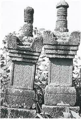
62 宝篋印塔 横倉館