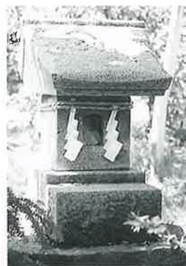
44 辨財天祠 横倉永泉 大正6年5月(22×21 ×45)