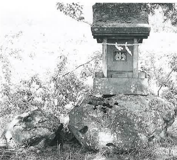
75 水神社 横倉藤後坂 明治42年4月(135×43×41)