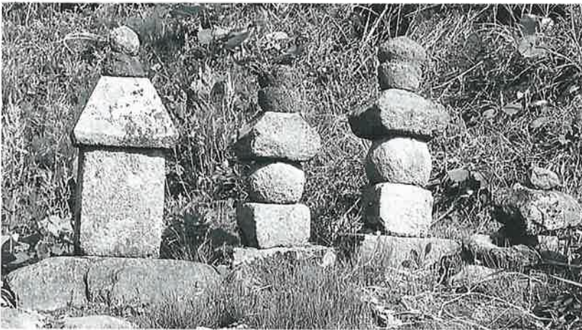
72 五輪塔 横倉上野(80)