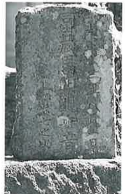
52 馬頭観音 横倉柳原 大正13年8月(55×25×15)