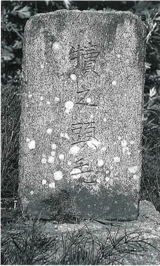
80 供養塔 横倉岩下 明治30年11月(60×26×13)