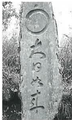
7 大日如来 横倉 天神森 天保15年 3月(245×53×40)