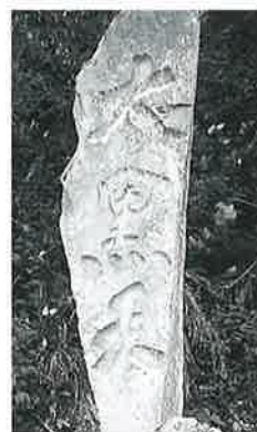
13 大黒天碑 横倉城ノ腰 文政11年8月(280×80×15)