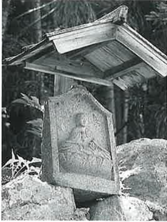
4 弘法大師(浮彫) 横倉藤ノ木 文化9年9月(45×35×15)