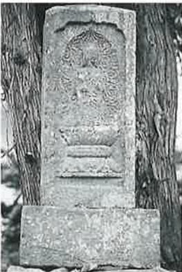
25 供養塔 横倉道陸神 文化9年12月(69×28× 21)