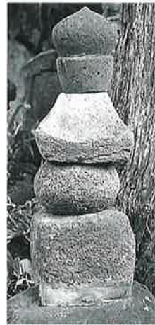
21 五輪塔 横倉天 神森(75)