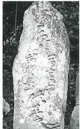
14 供養塔 横倉山ノ脇 天保12年7月(215×75×35)