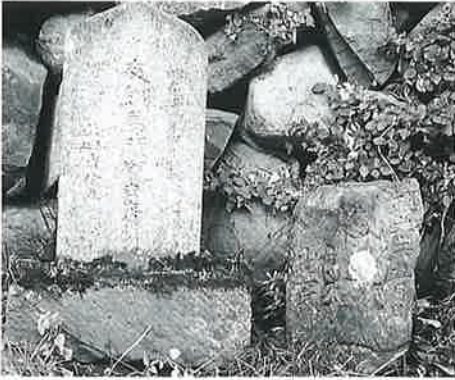
36 馬頭観音 横倉土平 昭和14年10月(60×25×16)