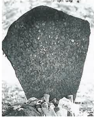
19 馬頭観音 横倉天神森 明 治23年2月(105×58×9)