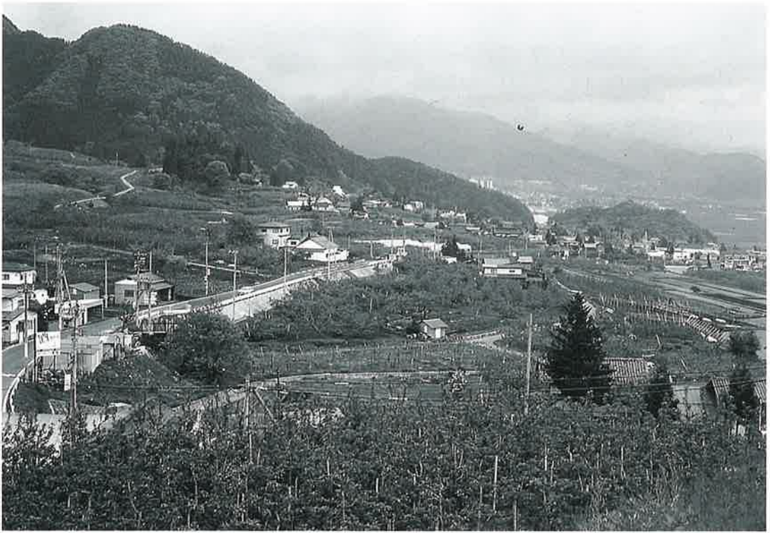
横倉 — 夜交氏の館のあった集落 —

横倉は竜王近辺からの崖錐による扇状地の扇央に位置している。横倉のクラは、小高い盛り上がった地形を指す地名で、牧場に関係した所が多い。