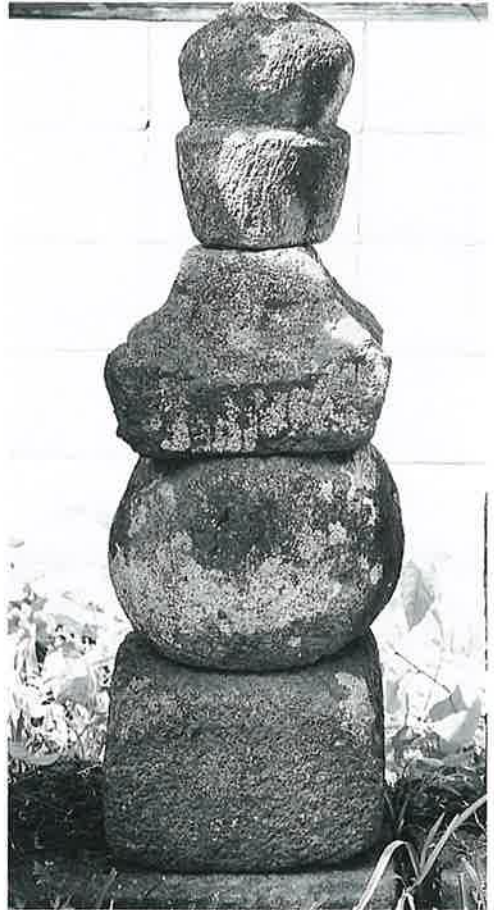
60 五輪塔 横倉館(80)