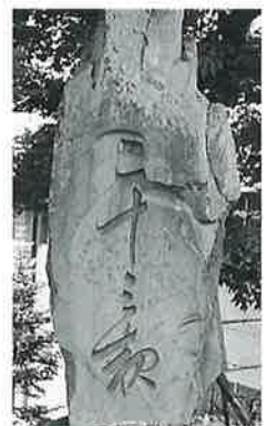
38 二十三夜塔 横倉仲田 文久2年3月(210×70×20)