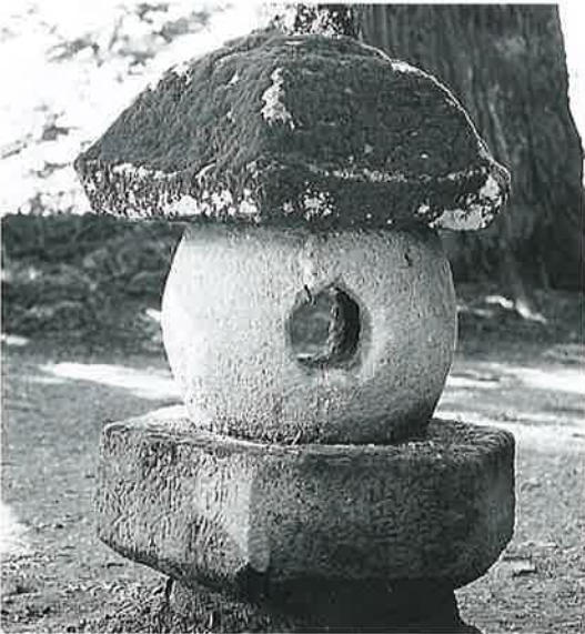
67 石燈籠 横倉土平 正徳5年(80×53)