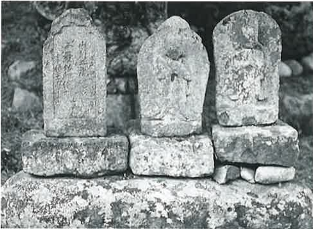
3 馬頭観音碑(浮彫) 横倉藤ノ木(42×26×16) 3 馬頭観音碑(浮彫) 横倉藤ノ木(44×28×20)