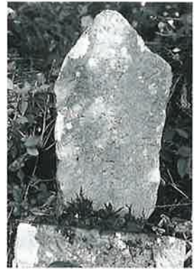
76 馬頭観音 横倉水口 万延2年正月(65×26×15)