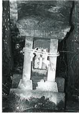
86 社宮神祠 横倉社宮神 昭和9年 4月 (118×25 ×24)