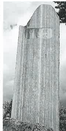
74 記念碑(横倉渠) 横倉藤後坂 昭和 15年11月(420× 126×20)