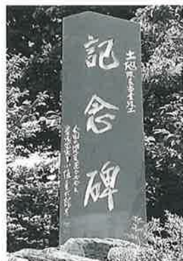
42 記念碑(土地改良) 横 倉仲田 昭和55年10月 (225×72)