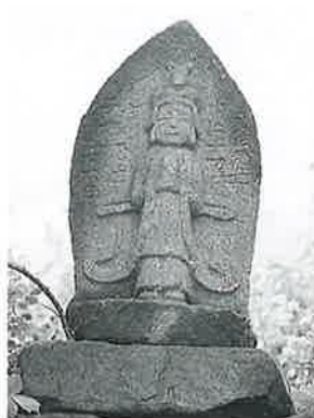
6 馬頭観音 横倉天神森 元治元年11月(60×28×18) 明治11年5月