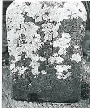
53 馬頭観音 横倉藤沢 大正6年6月(55×25×15)