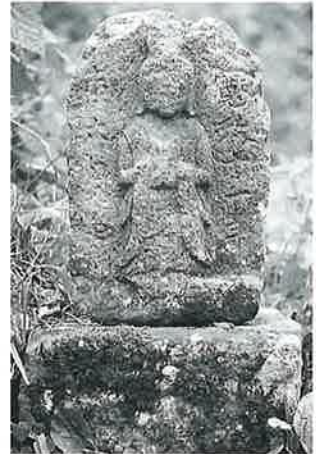
9 馬頭観音 横倉城ノ腰 寛政11年6月(53×23×15)