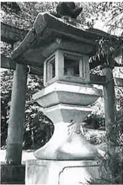
64 石燈籠 横倉土平 文政11年7月(265)