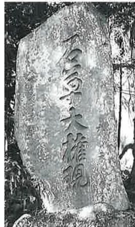
66 石尊大権現碑 横倉土平 嘉永5年7月(325 ×82×30)