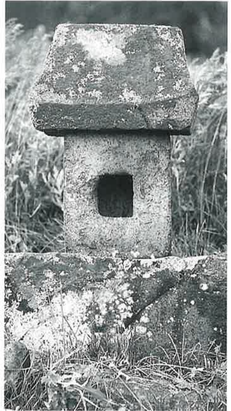
神明社 横倉岩宮 享保16年9月(77×23×23)