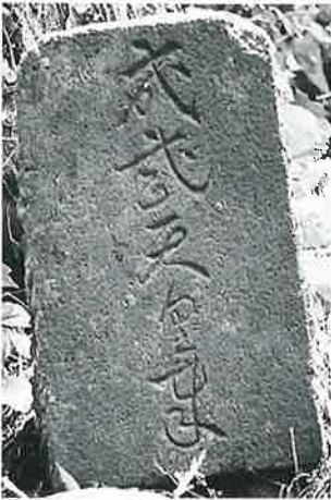
23 石碑(成務天皇奉) 横 倉道陸神(40×24×13)