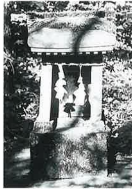
77 大山祇命 横倉岩下 昭和29年12月(120×50)