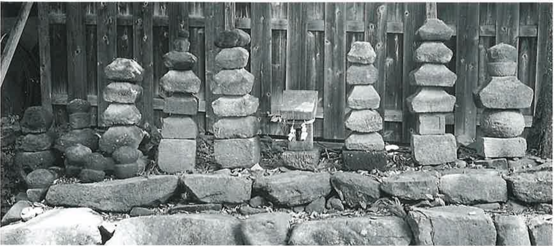
37 五輪塔 横倉仲田