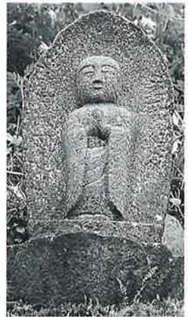
17 地藏尊 横倉藤ノ木 宝暦9年7月(53×31 ×20)