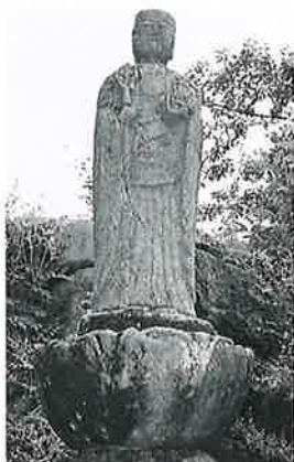
33 地藏尊 横倉道陸神 正徳2年(114×36×30)