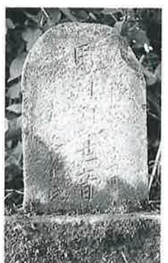
56 馬頭観音 横倉大境 大正14年8月(25×15×40)