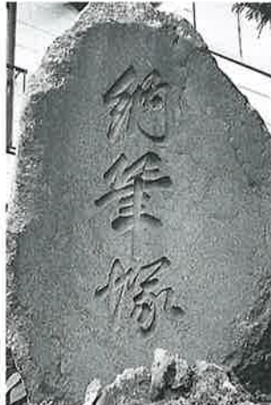
40 筆塚(納筆塚) 横倉土平 明治21年3月(255×140×30)