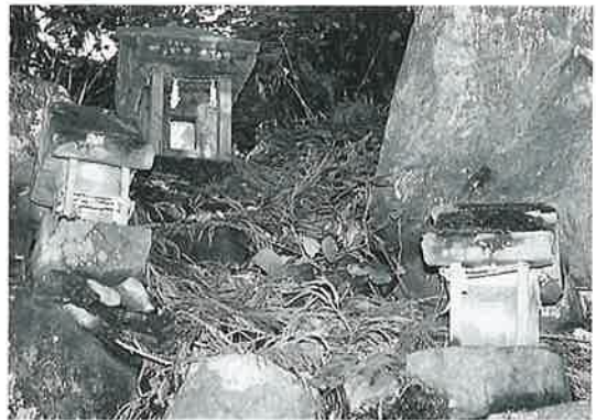
68 猿田彦命祠 横倉土平(15×15×37)