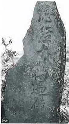
55 供養塔(心経十万遍) 横倉林檎 嘉永4年3月(250×80×20)