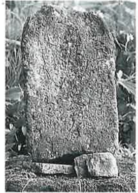
16 馬頭観音 横倉藤ノ 木 明治32年8月(46 ×26×15)