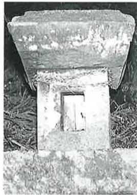
69 石尊大権現 横倉土 平 万延元年9月(48× 27×23)