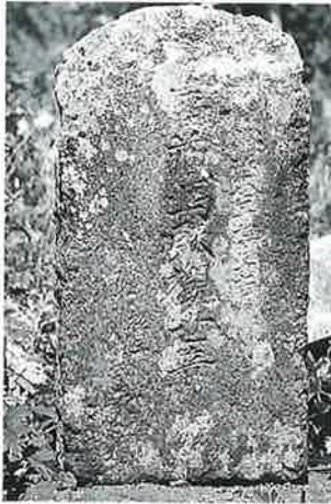
51 馬頭観音 横倉柳原 明治8年7月(67×30×16)