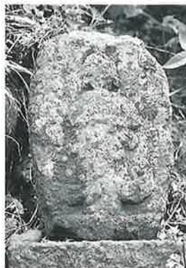
39 馬頭観音 横倉土平 (54×28×15)