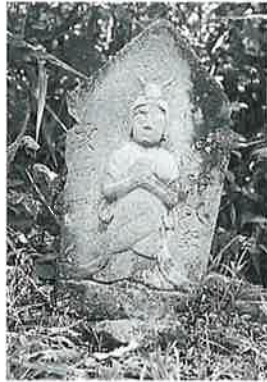
61 馬頭観音(浮彫) 横倉 古屋敷 明治8年4月 (55×27×15)