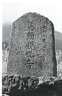
57 馬頭観音 横倉下前坂 昭和9年3月4日(37×25×8)