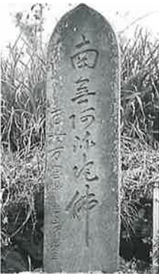
8 名号碑(南無阿弥 陀仏) 横倉天神 森(166×35×15)