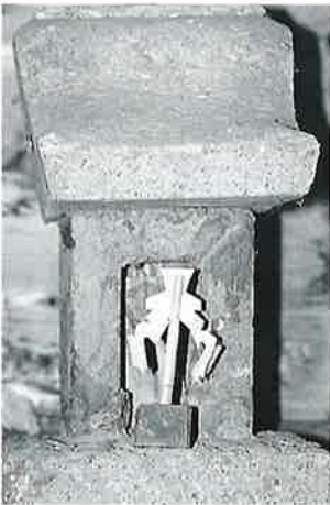
83 二十三夜祠 横倉千手寺 天保15年3月(40×17×17)