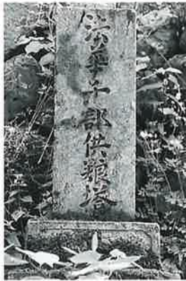
30 供養塔 横倉道陸神 文政4年9月(158×31×28)