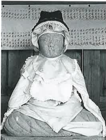
58 弘法大師像 横倉林檎 明治3年7月(153×45)