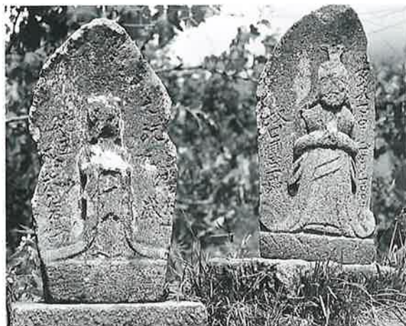
48 馬頭観音 横倉腰巻 文政2年(57×23×18) 48 馬頭観音 横倉腰巻 安政7年2月(61×27×14)