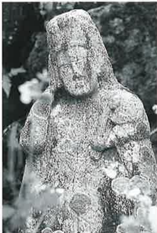
31 如意輪観音 横倉道陸神 (74×28×16)