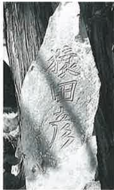
63 猿田彦命 横倉土平 (135×38×11)