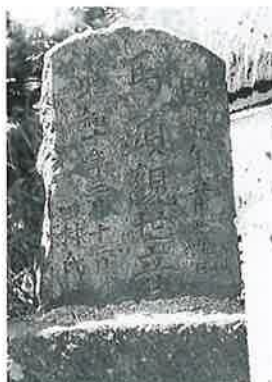
43 馬頭観音 横倉仲田 昭和9年5月(48×24 ×14)