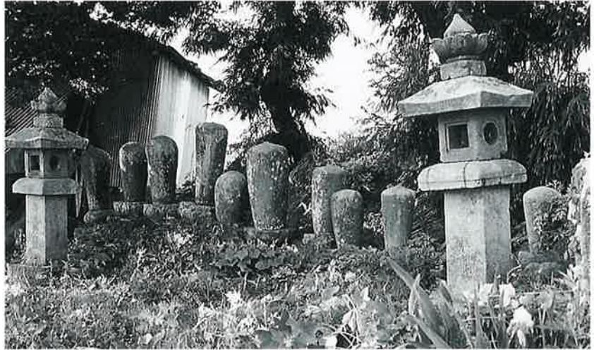
88 石燈籠 横倉上入 寛延元年 8月 (175×40×40)