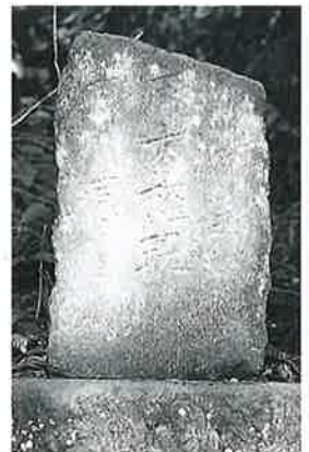
65 青麻大権現碑 横倉土平 元治元年5月(58× 27×11)