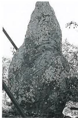
54 馬頭観音 横倉林檎 嘉永4年3月(195×58×20)