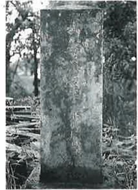
27 史跡碑(善誘学校跡地) 横倉道陸神 昭和63年7月(73×91×15)