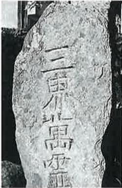
89 供養塔(三界万霊塔) 横倉城ノ腰 (170×80 ×35)