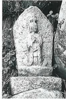
18 馬頭観音 横倉藤ノ 木 文化7年8月(55× 27×13)