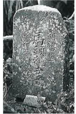
84 馬頭観音 横倉千 手寺 明治41年10月 (50×22×10)