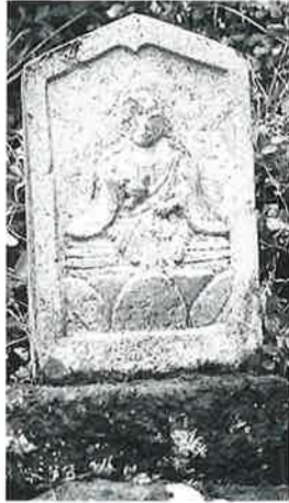
2 百番供養塔 横倉藤ノ木 文政9年9月(61×29×13)