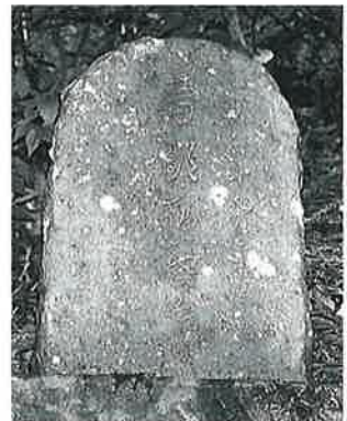
11 馬頭観音 横倉城ノ腰 昭和19年5月(58×30×20)