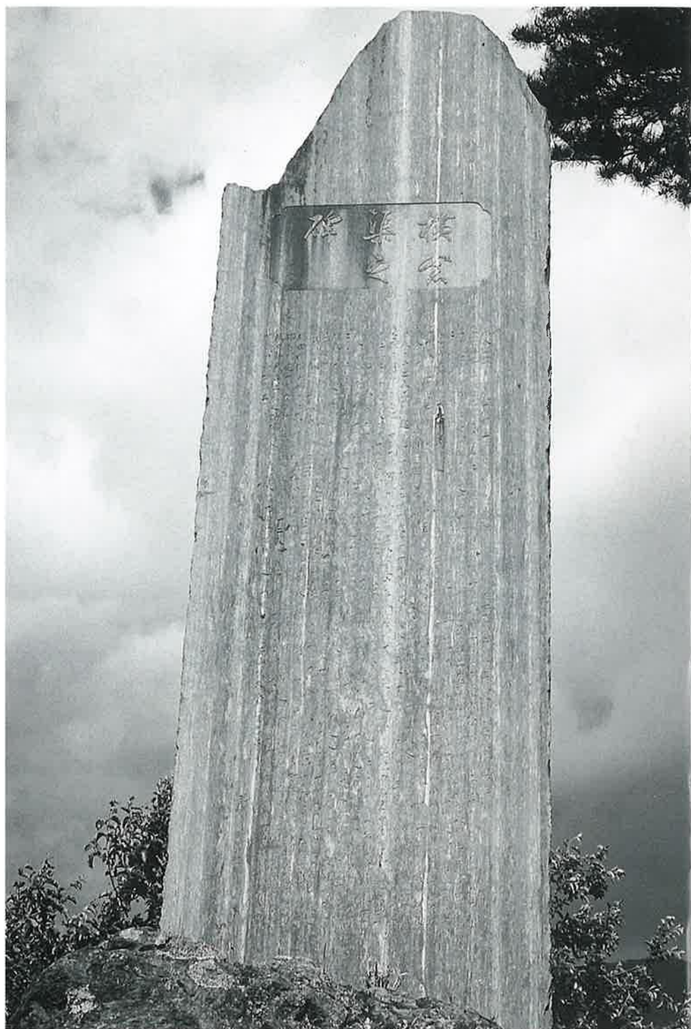
横倉渠碑（横倉の部No.74）