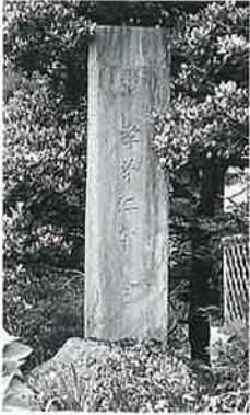
20 筆塚 横倉天神 森 昭和34年春(180 ×50×8)