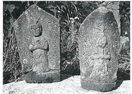
79 馬頭観音 横倉岩下 安政6年8月(42×24×14)