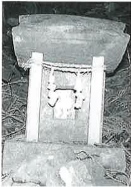
70 石祠 横倉藤後坂 文政12年(50×17×15)