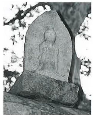
5 馬頭観音(浮彫) 横倉天 神森 文化3年7月(44×26×18)