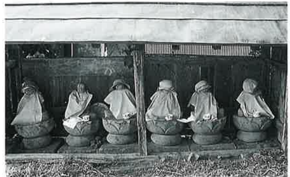
90 六地藏 横倉上入 (85×25)