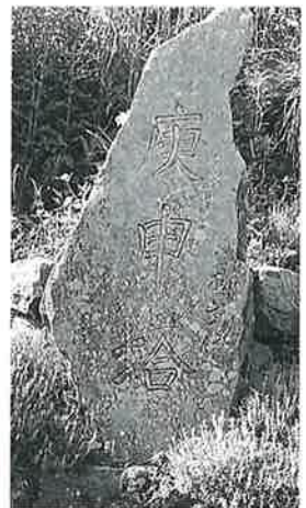
71 庚申塔 横倉藤後坂 (210×65×15)