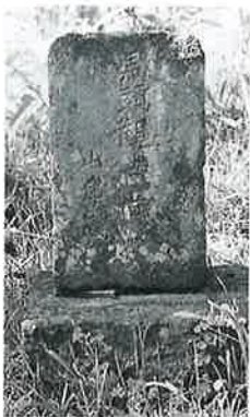
59 馬頭観音 横倉館(56×23×17)