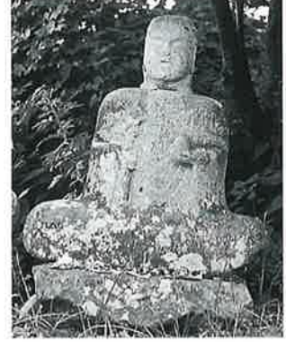
46 地藏尊 宇木谷地(72× 57×23)