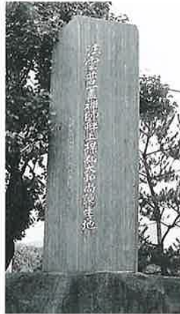
56 頌徳碑(畔上榎仙) 宇木大道付 昭和48年 4月(448×91×16)