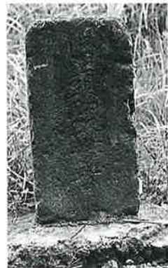
52 馬頭観音 宇木 明治12年2月(63 ×26×16)