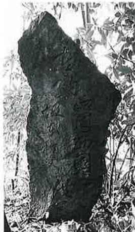
29 供養塔(巡礼) 宇木横前 天保5年3月(124×58×24)