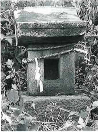
27 大峯祠 宇木松ノ木 享保20年9月(65×25×23)