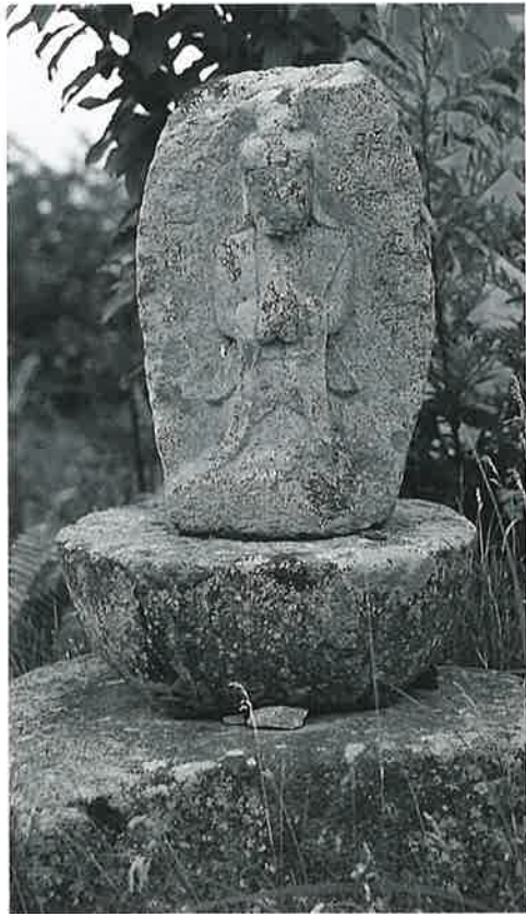
43 観世音 宇木谷地 明和9年11月(64×29× 19)