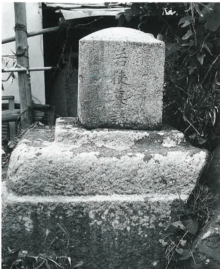
34 若狭墓誌 宇木松長 天徳 6年 5月 (82×30×31)