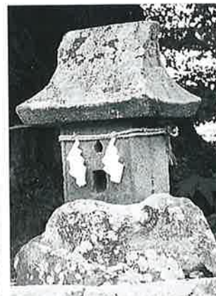
15 庚申塔 宇木赤兀 寛文9年5月 (109×31×31)