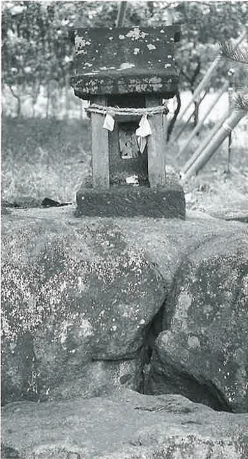
57 白山大権現祠 宇木大道付 正徳4年9月 (70×27×25)