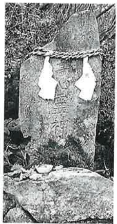
79 高心靈神 宇木高社裏 明治中期(84×33×20)