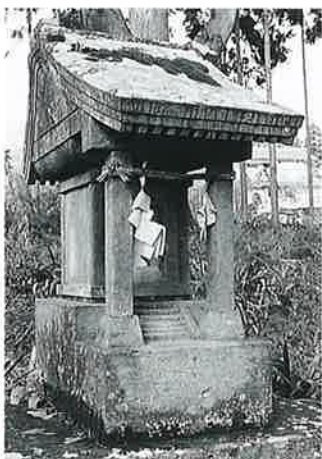
39 水神 宇木松長 昭和 9年 7月 (116×33×33)