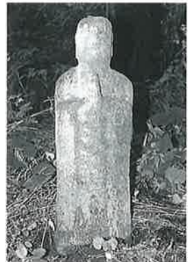
58 地藏尊 宇木大道付 (75×20×11)