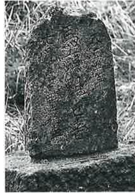
51 馬頭観音 宇木大道付 大正5年7月(61×28× 14)