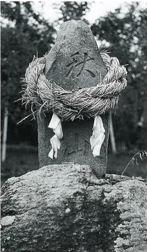
24 秋葉山 宇木林下(162×36×13)