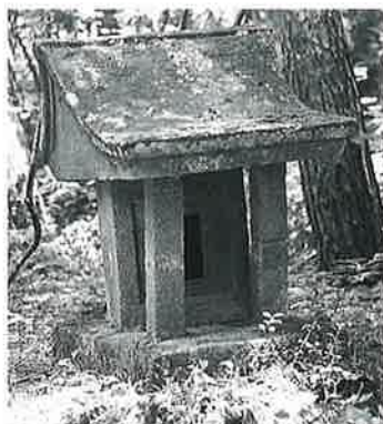
2 大山祇命 宇木天王 天明6年(92.5×32×31)