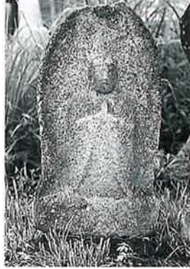
18 地藏尊 宇木林下(66 ×32×21)