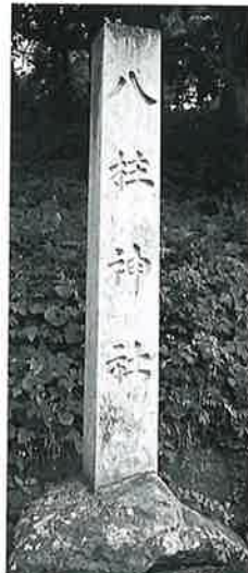
67 標示碑(八柱神社) 宇木宮浦 昭和36年 9月(292×31×31)