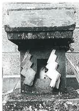
38 三峯 宇木松長 明治 中期 (64×23×21)