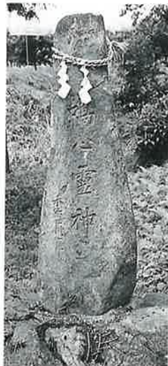
68 靈神碑(晴心靈神) 宇木松長 昭和18年 1月(190×40)