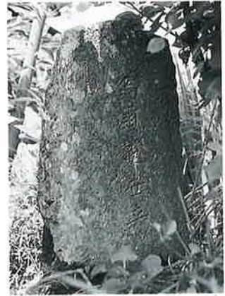
11 馬頭観音 宇木赤兀 明治12年2月 (63×26×16)