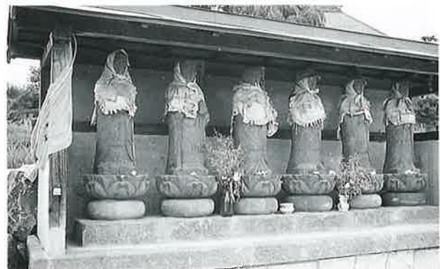
44 六地藏 宇木谷地(101×27×25)