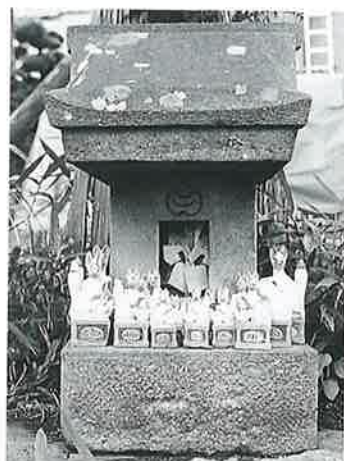
82 伏見稲荷 宇木谷地 明治31年4月(70×24×22)