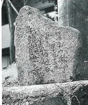
26 牛頭観世音 宇木横前 明治36年10月(44×34×30)