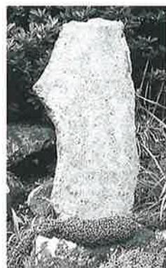
36 蛸薬師碑 宇木松長 (72×26×8)