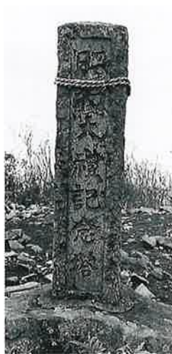
75 標示碑(昭和大禮) 宇木高社裏 昭和3 年11月(150×27×24)