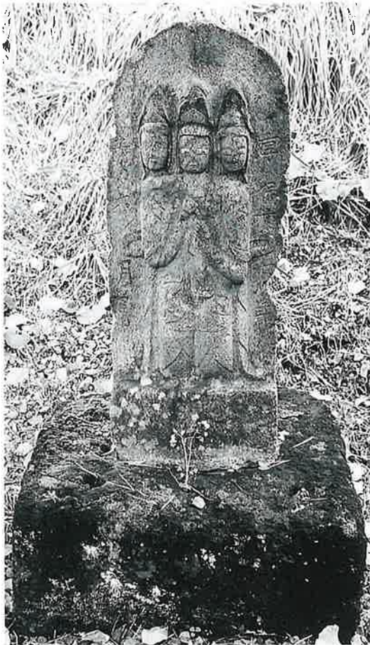
54 三面観音 宇木大道付 享保17年6月(105×33× 20)