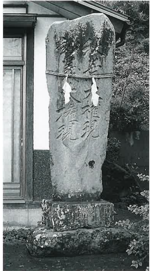
71 秋葉妙義碑 宇木大道付 文政6年4月(218 ×74×16)