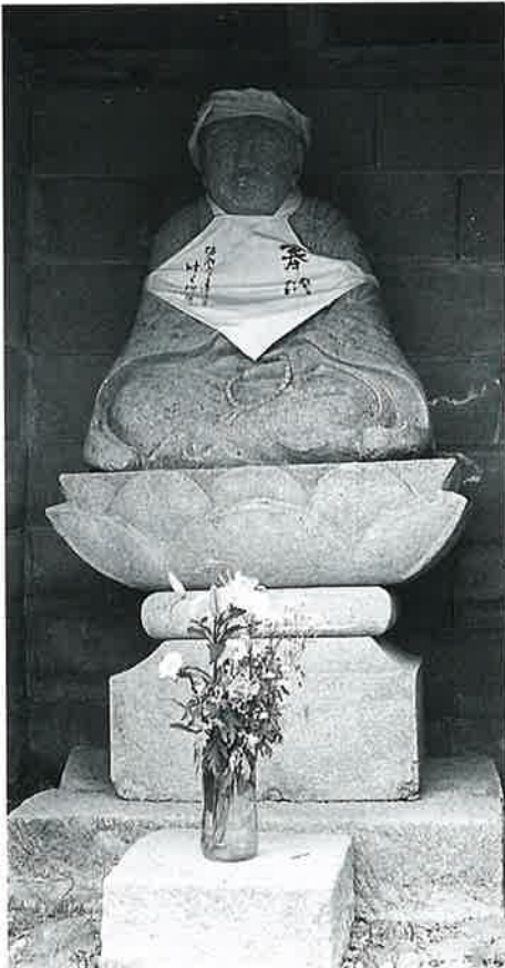
30 弘法大師 宇木松長 明治21年(138×67×47)