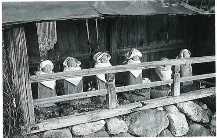
9 六地藏 宇木宮浦 (55×17×12)