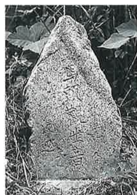
4 馬頭観音 宇木松ノ木 明治10年9月(56×34×14)