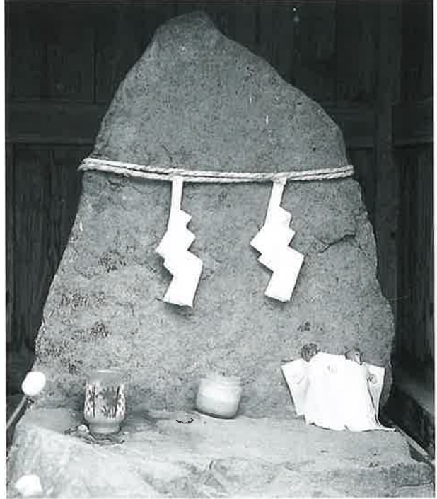
40 猿田彦命 宇木谷地(104×65×51)