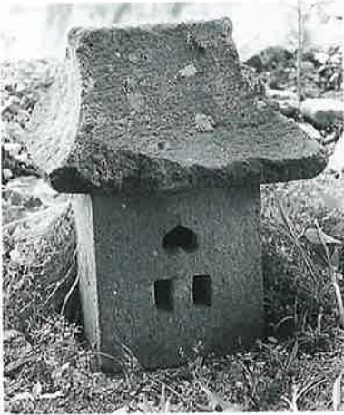
10 庚申塔 宇木宮浦 (79×29×24)