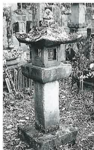
35 筆塚(青木源兵衛) 宇木松長 (146×37×37)