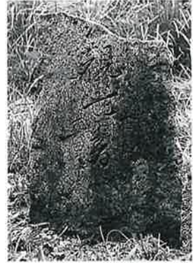
50 観世音 宇木大道付 (55×42×25)