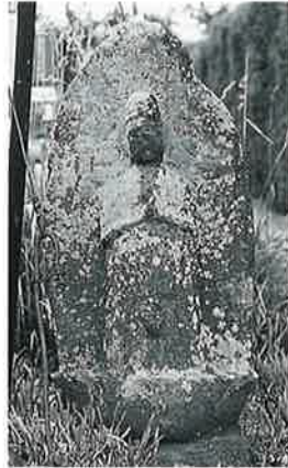
21 供養塔 宇木林下(87 ×38×28)