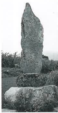
41 万霊塔 宇木谷地 安永8年(243×67 ×27)