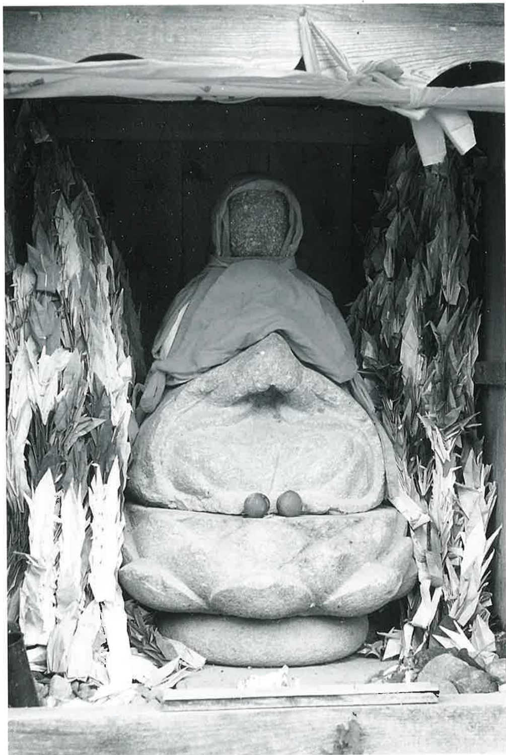
吉野地蔵（宇木の部No.72）