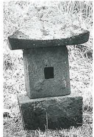
55 庚申祠 宇木大道付 享保 15年6月(80×26×25)