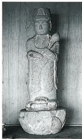
23 聖観音 宇木林下 宝 永8年10月(77×21×19)