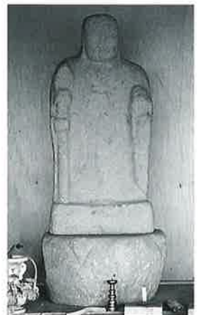
22 地藏尊 宇木林下 (79.5×29×20)