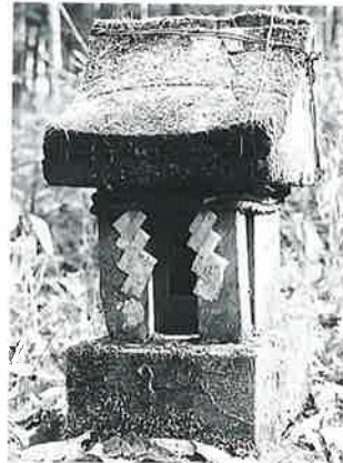
80 若狭水神 宇木臂出原 文久元年酉6月(59×18×18)