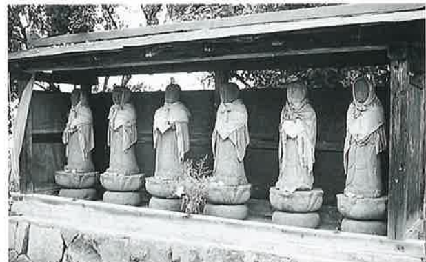
45 六地藏 宇木谷地(92×24×21)