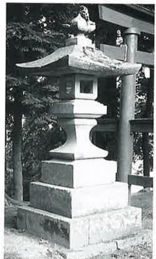
66 石燈籠 宇木宮浦(292×72 ×72)