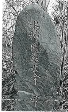
77 水神罔象女命 宇木道島 昭和31年11月(146×56×21)