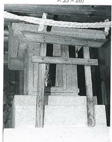
81 水天宮 宇木大道付 昭和12年9月(72×27×27)