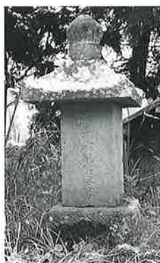
6 供養塔(法華経千部) 宇木宮浦(110×25×25)