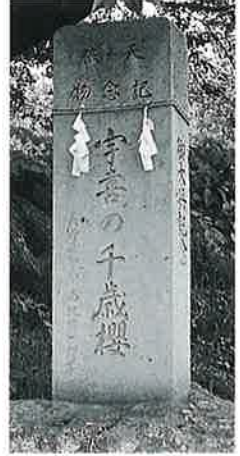
16 記念碑 宇木赤元 昭和38年4月(185 ×45×24)