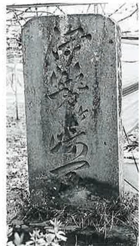
74 頌徳碑(伊勢ヶ崎家) 宇木神戸 明治11年5月 (166×82×20)