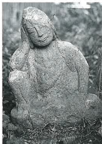
8 如意輪観音 宇木宮浦(49×28×16)