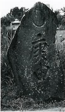
19 庚申塔 宇木林下 文政7年6月(129×71 ×30)