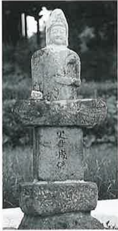
42 聖観音 宇木谷地 元禄11年8月(138× 43×21)