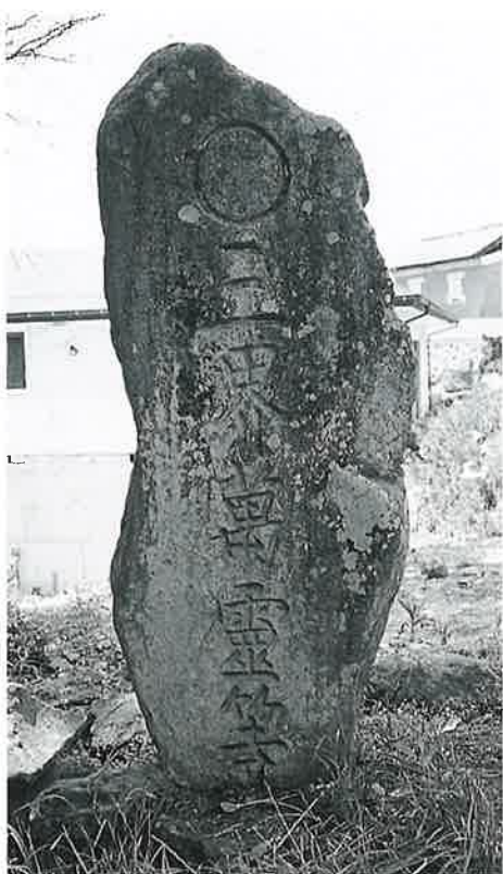
7 三界万霊塔 宇木宮浦(223×73×48)