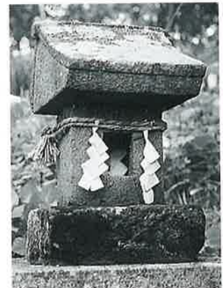
14 石祠 宇木宮浦 (50×20×19)