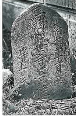
48 馬頭観音 宇木大道 付 大正7年11月 (38.5×23×13)