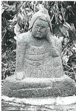
59 如意輪観音 宇木大道 付(50×40×18)