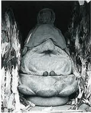
72 地藏尊 宇木畔ノ上 文久 2年6月(97×48×40)