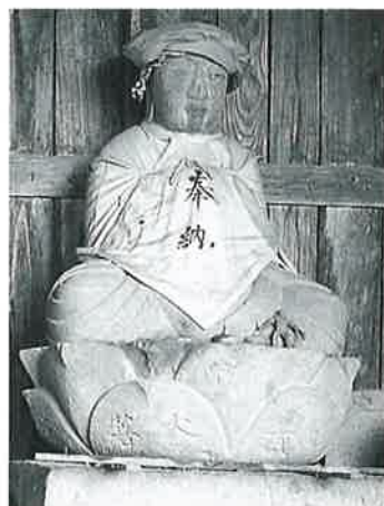
33 地藏尊 宇木道島 明和 9年 4月 (92×59×45)