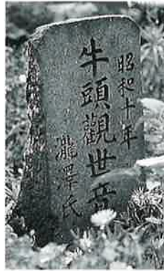
70 牛頭観世 宇木大 道付 昭和10年(57 ×24×17)