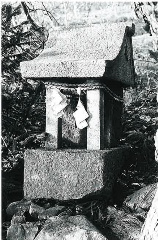
73 熊野権現祠 宇木熊ノ宮 正徳6年5月(71×26×24)