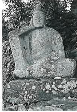
47 如意輪観音 宇木谷地 (77×49×25)