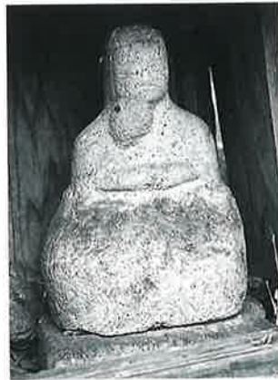
12 地藏尊 宇木宮浦 (48×24×17)