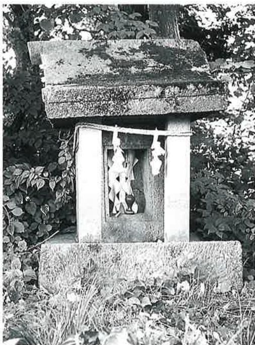
3 大山祇命 宇木森脇 正徳5年4月(136×55×52.5)