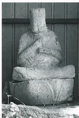
5 行人像 宇木林下 正徳年間(56×36×28)