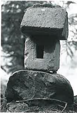
65 稻荷祠 宇木宮浦 (52×10×14)