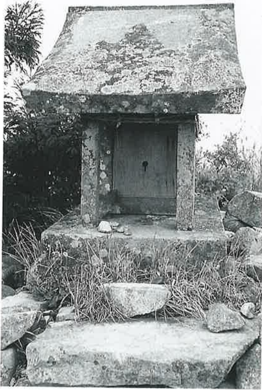
78 高社山頂御嶽社 宇木高社裏 明治18年6月(127×45×45)