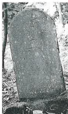
37 供養塔 宇木松長 明治 37年 10月 (72×29×22)