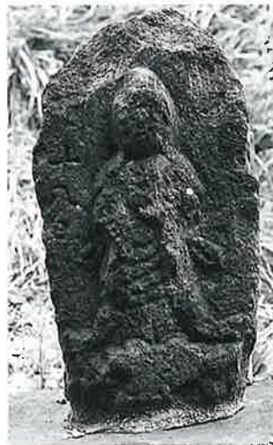
53 供養塔(菩薩) 宇木大道 付(58×24×16)