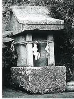
17 稻荷祠 宇木横前 元 文5年7月(74×24× 21)