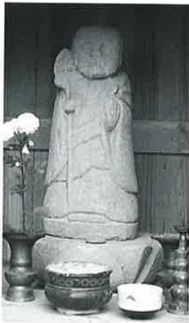
69 地藏尊(夢地藏) 宇木 大道付(55.5×20×17)