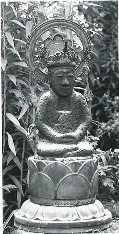
13 大日如来 宇木宮浦 (52×23×20)