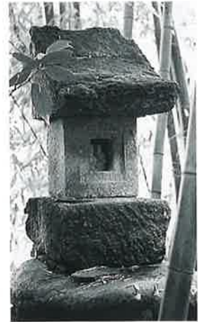
28 大山祇命 宇木横前 享保7年6月(68.5×21×18.5)