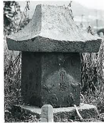
31 庚申塔 宇木森脇 明和4年4月(82×28×27)