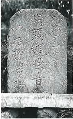
49 馬頭観音 宇木松 長 明治31年3月 (42×28×17)