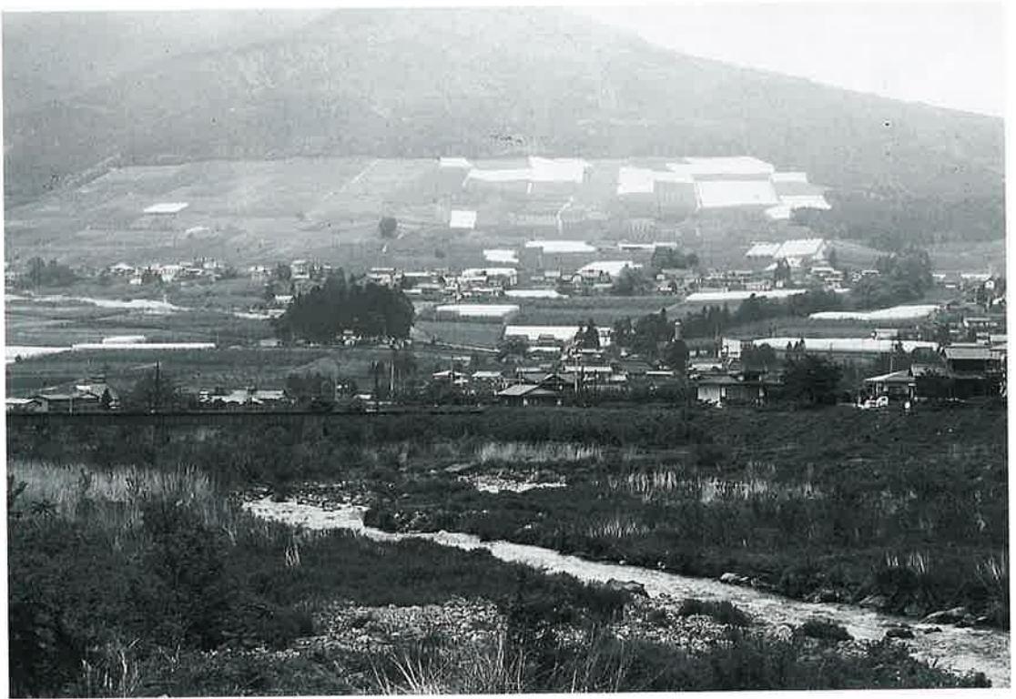
宇木 高社山信仰の濃い集落一

高社山麓の南面の緩傾斜地が、夜間瀬川岸にまで広まった地域で、平安朝期から笠原御牧の一部として利用された。宇木の名も「牛の柵」の牛牧から出た。集落として開けたのは室町期以後の開墾によるのである。