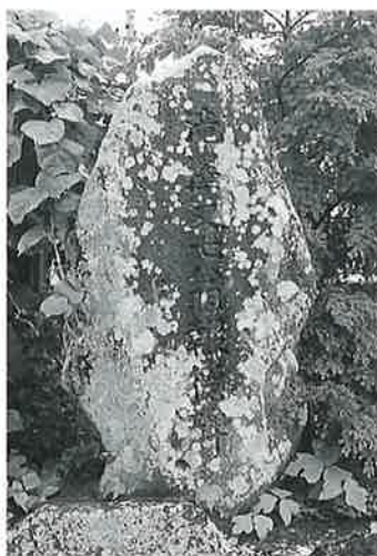
61 頌徳碑(滝沢又七) 宇木大道 付 昭和41年11月(201×97×75)