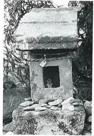
76 天王社 宇木高社裏(71×24×24)