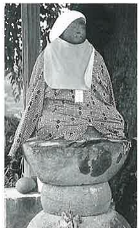
60 地藏尊(桜下) 宇木大 道付(89×46×31)