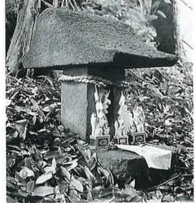
25 稲荷祠 宇木横前(63×15×15)