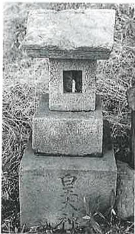
83 皇大神宮 宇木谷地 (53×18×15)