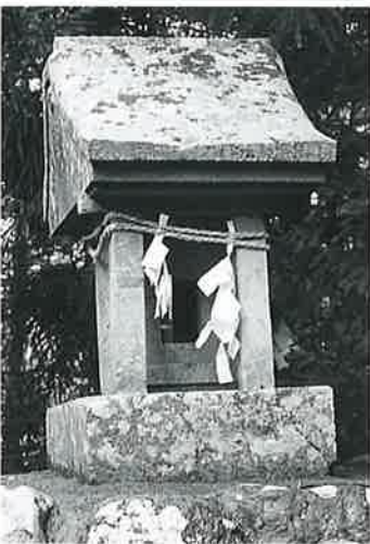
62 戸隠祠 宇木宮浦 明治16年 10月(95×29×30)