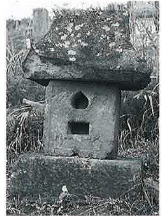
20 庚申塔 宇木林下 正徳4 年9月(87×31.5×31)