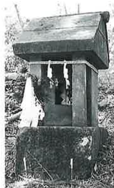
1 馬背神社 宇木天王(147×46×44)