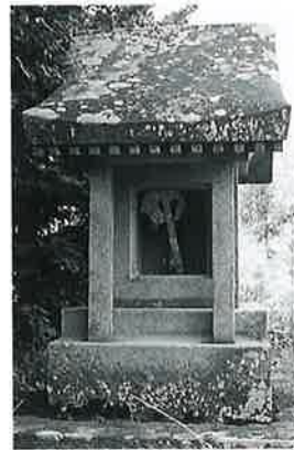
32 金刀比羅 宇木森脇 明治7年4月(139×46×47)