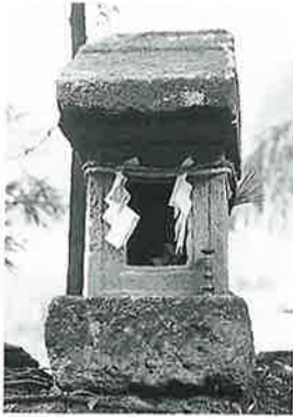
64 大山咋命 宇木宮浦 宝永元年6月(77×27 ×27)