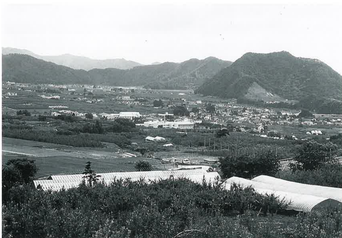
本郷 — 市 いち が立って賑わった集落

本郷は高社山の崖錐地の尖端と、夜間瀬川に沿って広がった緩傾斜地にある。かつては草津方面から山ノ内へ入った道は、この市道 いちみち 近辺で中野と飯山方面へ分かれ、山ノ内地区南部では中心的な存在をなしていた。