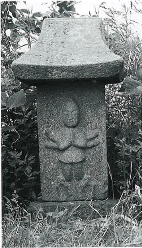
24 庚申塔(青面金剛) 本郷東町 享保8年11月 (93×47)