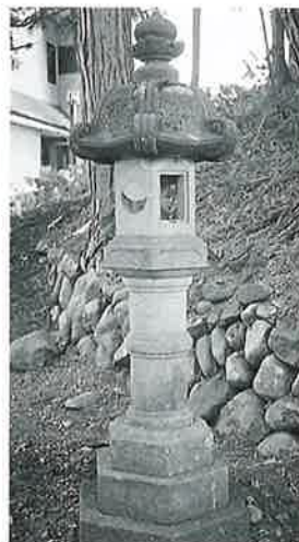
18 石燈籠 本郷実相寺 明治30年 (60×40×40)