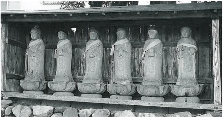
11 六地藏 本郷実相寺 安永5年3月(134×31×23)