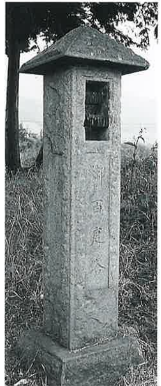
4 百度塔 本郷 昭和9年10月(133×28×26)