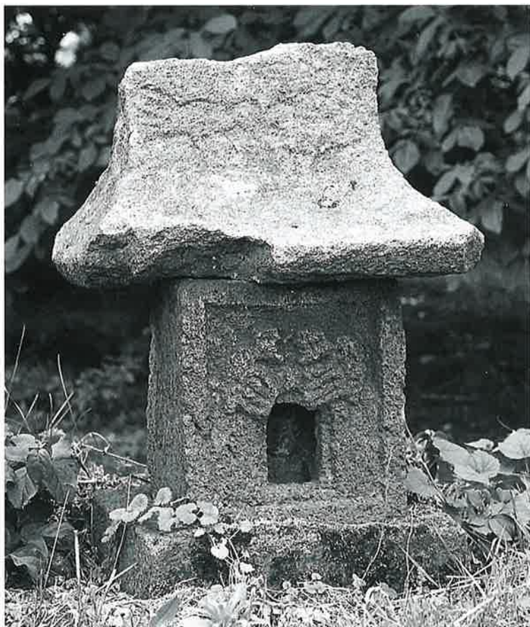
28 庚申塔 本郷(82×45×27)