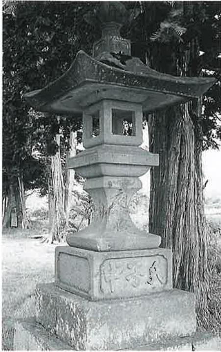
3 石燈籠 本郷豊受社 天明7年秋(322×35×35)