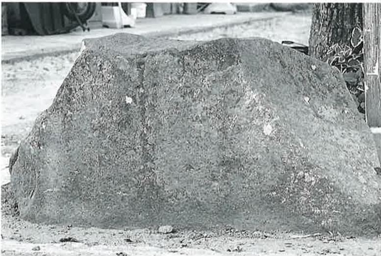
6 市神 本郷町(90×150×63)