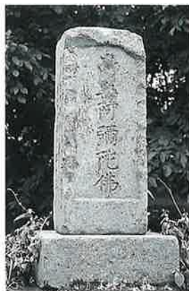
27 名号碑 本郷 宝曆8年12月(110×30×23)