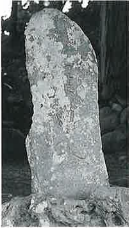
12 庚申塔 本郷実相寺 万延元年(181×50)