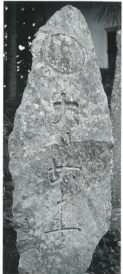
13 大日如来 本郷春日山 文政8年10月 (168×90×18)