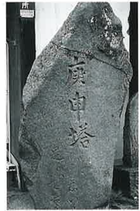
22 庚申塔 本郷東町 安永6年