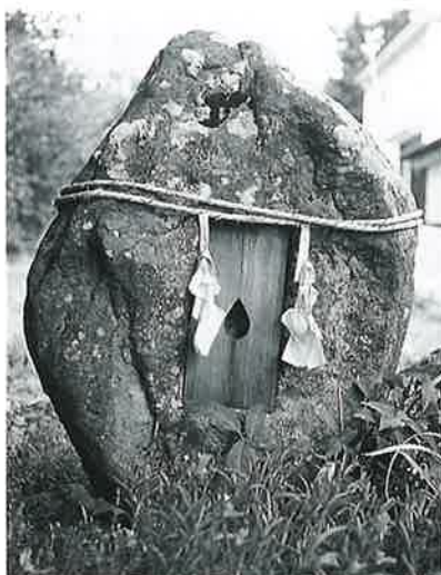
31 秋葉山 本郷新田(88×46×45)