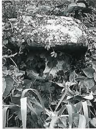
21 石燈籠 本郷実相寺