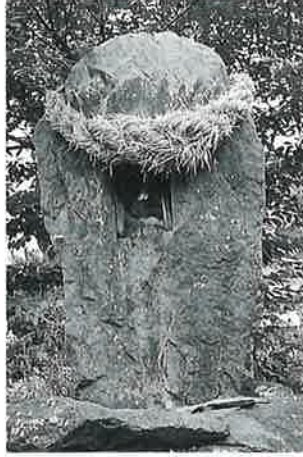
8 秋葉大権現 本郷市道(198×117×56)