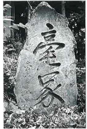
20 筆塚 本郷実相寺 (168×98×46)