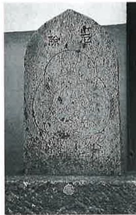
23 千手観音 本郷東町 (53×30×10)