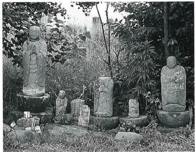
25 地藏尊群(一) 本郷東町 右(91×33×20) 左(67×30×20)