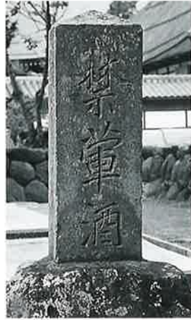
10 結界石(禁軍酒) 本郷実相寺 安政元年(155×33×28)