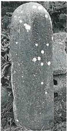
16 供養塔 本郷実相寺 文化6年3月 (100×32)