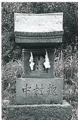
29 水神宮 本郷中河原文久元年3月(162×54×28)