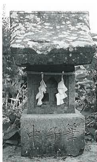
30 筆塚 夜間瀬橋上 慶応2年(100×33×33)