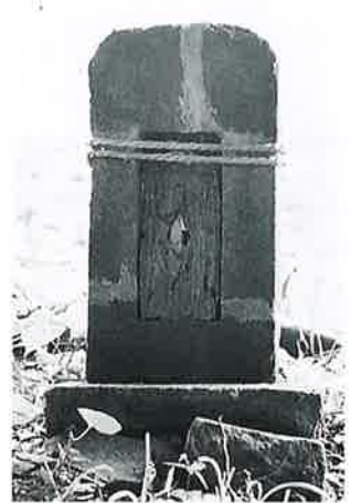
1 蚕神祠 本郷町(61×27×13)