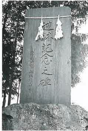
2 記念之碑 本郷 昭和39年9月(155×72×14)