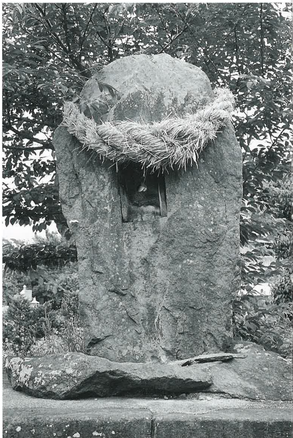
秋葉大権現（本郷の部No. 8）