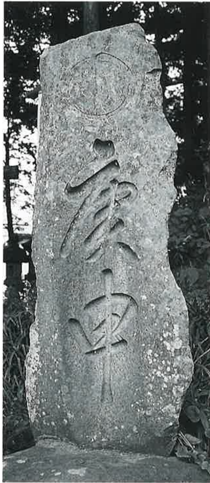
14 庚申塔 本郷春日山 万延元年