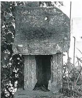
19 石 祠 本郷春日山 (83×45×20)