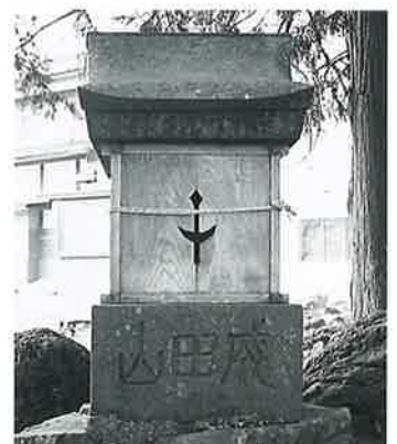
17 成田山 本郷春日山 明治2年7月 (115×53×82)