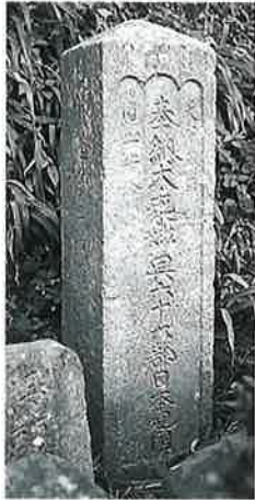
15 供養塔 本郷実相寺 延享3年9月 (115×30)