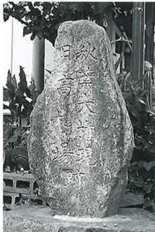
5 秋葉大権現 本郷町 昭和53年1月(111×50×18)