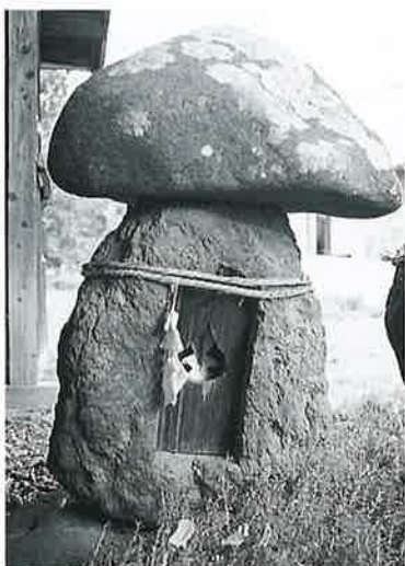
32 秋葉山 本郷新田(78×57×46)