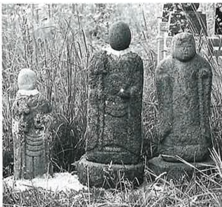
26 地藏尊群(二) 本郷東町 真中(70×36×13)