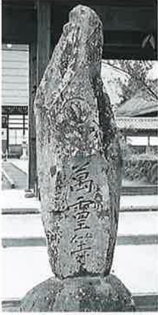
9 供養塔 本郷実相寺 明和(193×62×26)