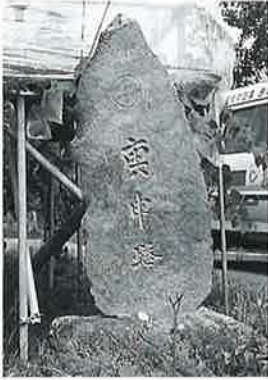
51 庚申塔 戸狩伊沢 文政12年8月(93×42× 25)