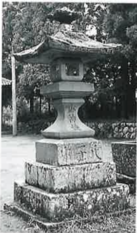
7 石燈籠 戸狩仲屋敷 嘉永3年7月(340×130 ×35)