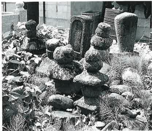
41 五輪塔 戸狩箱山(79×26×26)