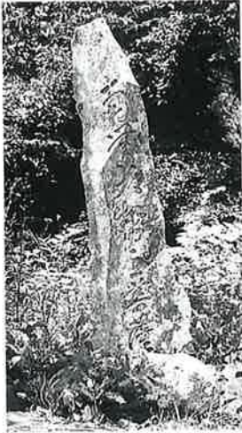
27 供養塔 戸狩伊沢山頂 弘化3年8月(139×42 ×15)