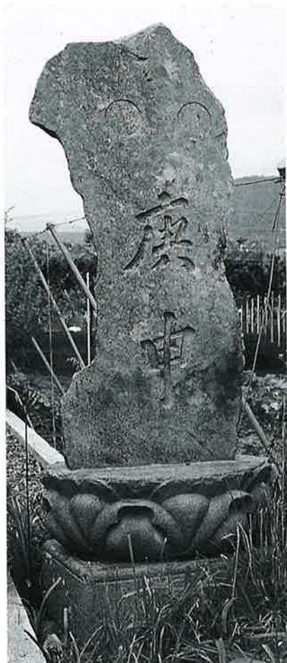
46 庚申塔 戸狩原 文化12年9月(135×63×17)