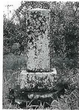
2 供養塔(西国百番) 戸 狩仲屋敷 明治37年8月 (100×47×31)