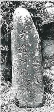
23 名号碑 戸狩 寛延2年 (120×33×38)