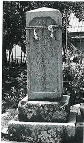
4 供養塔(西国百番) 戸 狩仲屋敷 文化12年8月 (63×25×25)