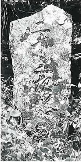
20 二十三夜塔 戸狩伊沢 山麓 嘉永3年(106× 45×12)