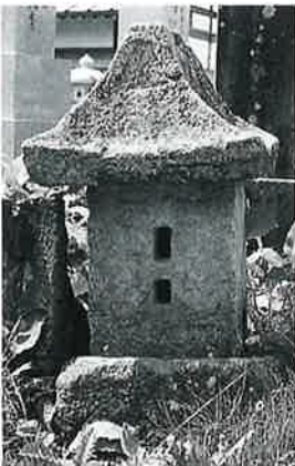
39 庚申塔 戸狩箱山 (80×27×25)