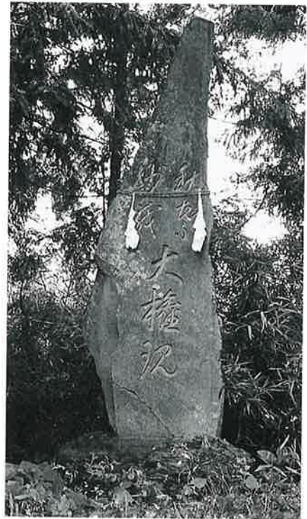
8 秋葉妙義大権現碑 戸狩仲屋敷 文化 13年5月(270×95×32)