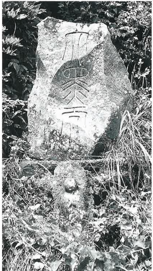
21 大黒天 戸狩伊沢山麓 元治元年8月(95×45×16)