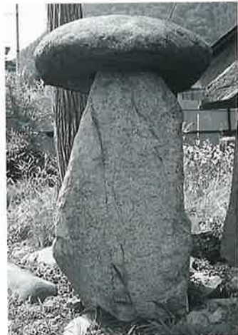
32 供養塔(湯殿山) 戸狩箱山 天保13年(140×90×42)