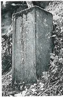
29 供養塔 戸狩箱山峠 元文4年(84.5×32×29)