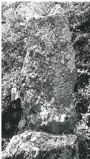
22 句碑 戸狩伊沢山麓 明 治14年(145×65×43)