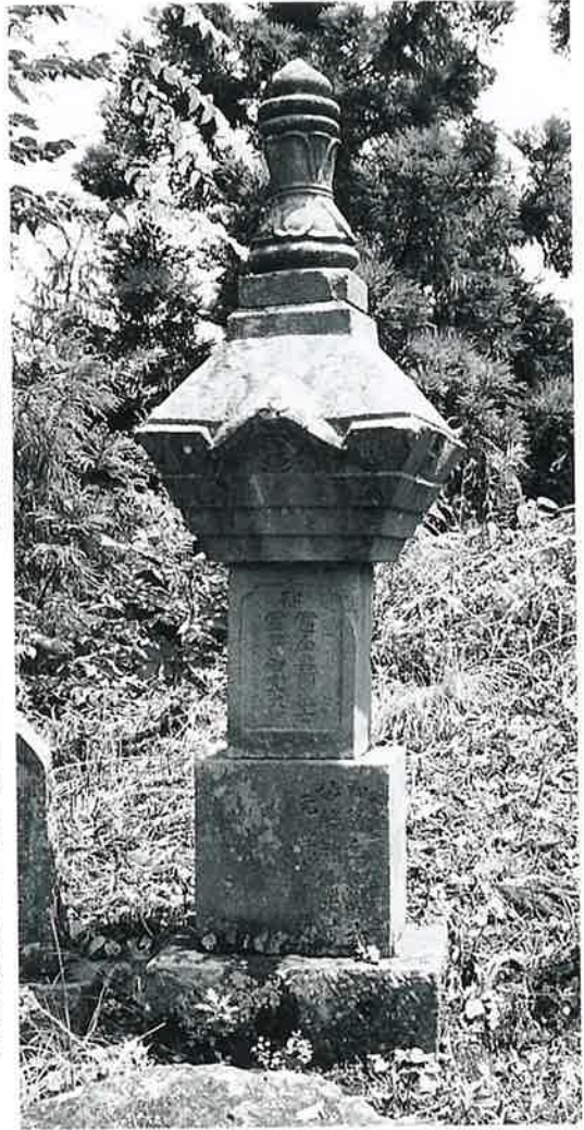
25 宝篋印塔 戸狩伊沢山麓(180×26×24)