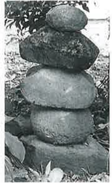
48 五輪塔 戸狩伊沢 (15×26×33)