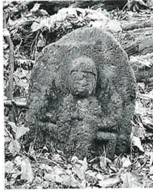
28 千手観音 戸狩箱山峠(56 ×33×19)