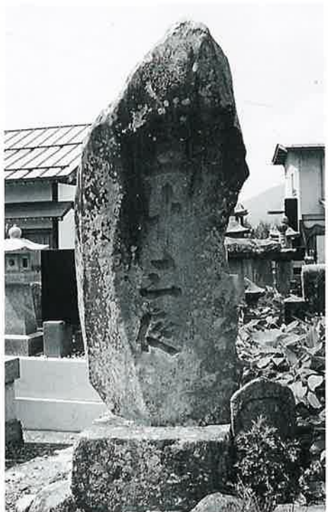
38 二十三夜塔 戸狩箱山 天保12年3月 (150×70×25)