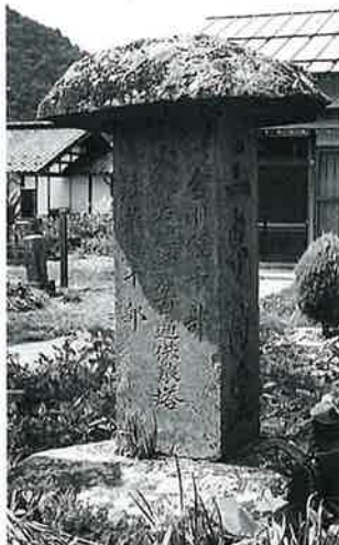
37 供養塔 戸狩箱山 文化13年3月 (153×70×27)