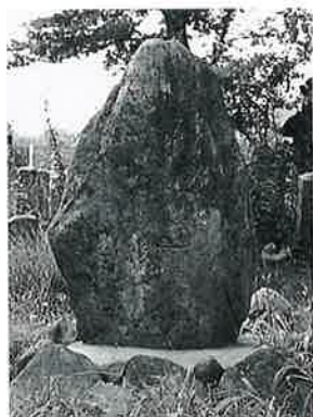
47 句碑(倭穂) 戸狩原 昭和55年7月(115×78×45)