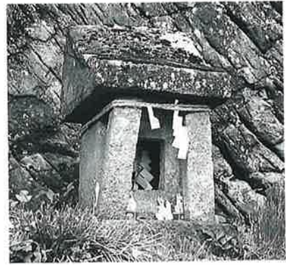
30 稻荷祠 戸狩箱山(70×46×29)