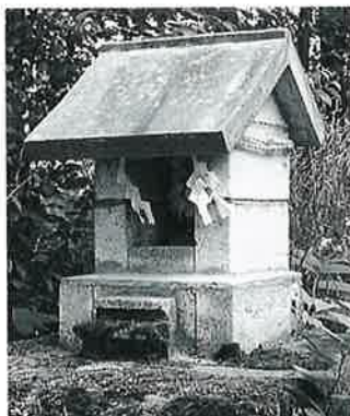
44 天神祠 戸狩原(72×55×39)