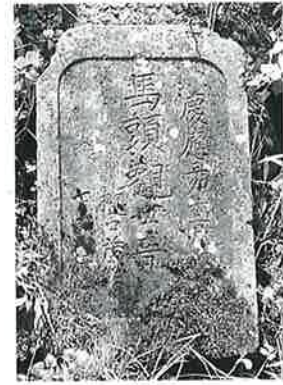
15 馬頭観音 戸狩 慶応 3年12月(41×26×10)