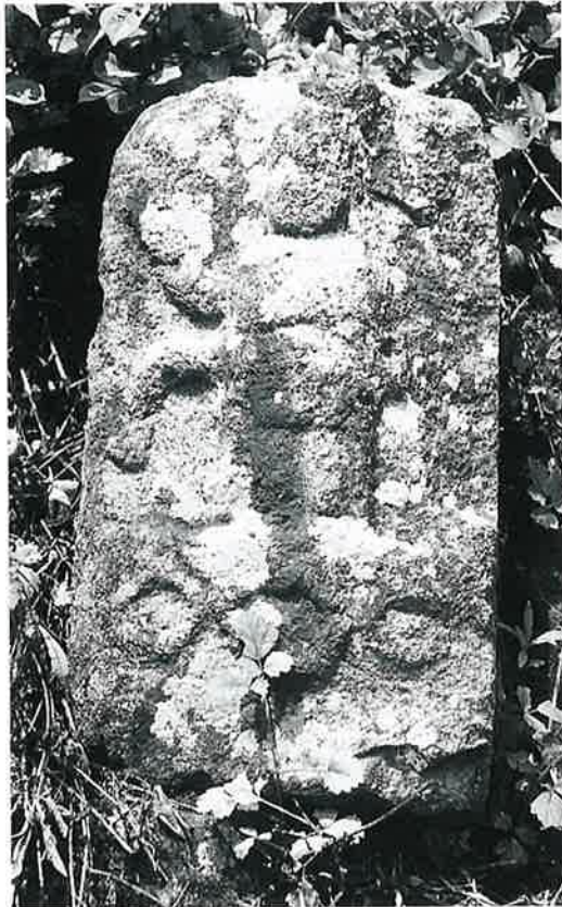
16 庚申塔 戸狩(47×45×18)