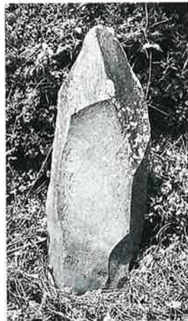
14 道 標 戸狩 嘉永7 年8月(118×42×24)