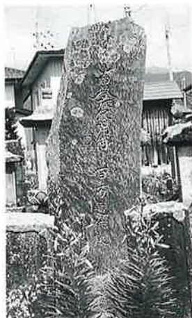
42 供養塔 戸狩箱山 嘉永3年3月(220×60×27)