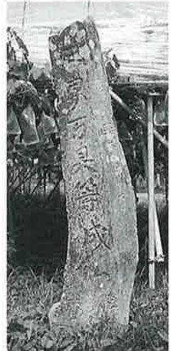
52 供養塔 戸狩伊沢 享保2年8月(130 ×30×32)