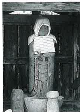
40 地藏尊 戸狩箱山 享保9年8月(91×40×16)