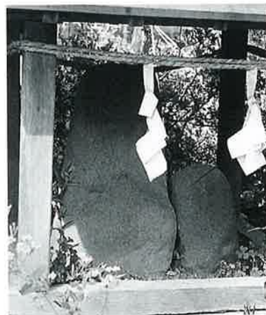
45 道祖神(自然石) 戸狩原(45×25×24)