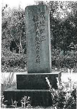
5 頌徳碑(佐藤) 戸狩仲 屋敷 昭和4年7月 (117×40×20)