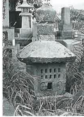
49 墓 祠 戸狩原(98× 36×30)