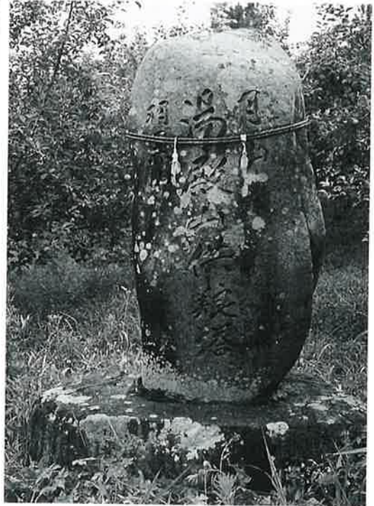
供養塔(湯殿山) 戸狩仲屋敷 明治24年4月(142 ×70×65)