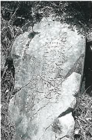
57 耕地所持境石 戸狩箱山 (170×77)