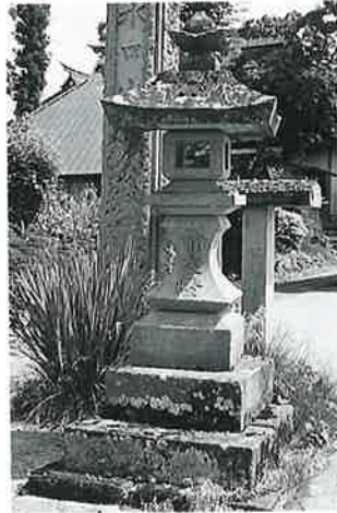
31 石燈籠 戸狩箱山 元治元 年(70×46×27)