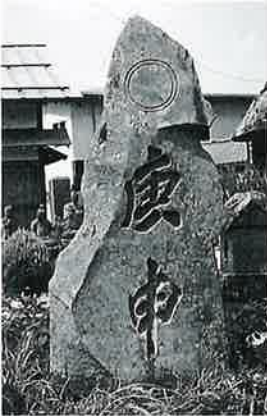
36 庚申塔 戸狩箱山 文化13年3月 (140×80×30)