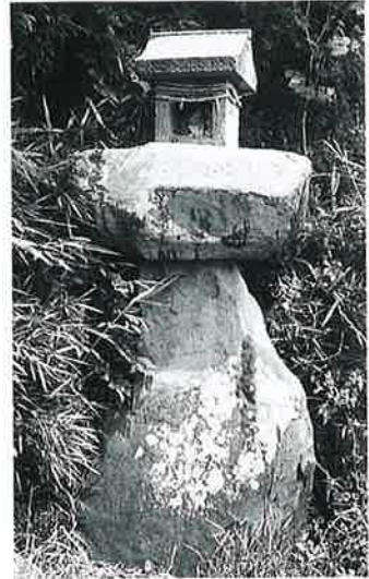
9 三峯祠 戸狩(201×90×30)