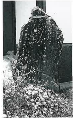
13 句 碑 戸狩仲屋敷 明治34年(118×68×26)