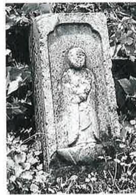
17 観世音 戸狩伊沢山麓 寛政4年5月(67×28× 23)