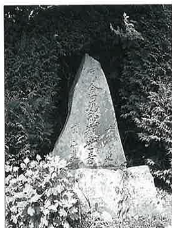
43 馬頭観音 戸狩原 弘化2年(95×46×15)