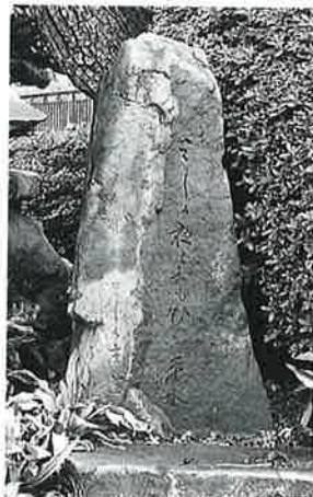
6 句碑 戸狩仲屋敷 明 治24年4月(110×30×32)