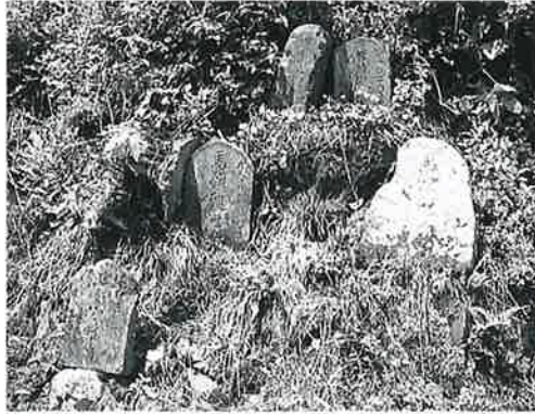
19 馬頭観音群 戸狩伊沢山麓