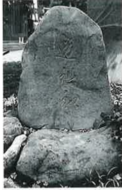
10 道祖神碑 戸狩仲屋 敷 明治2年正月 (75×44×20)