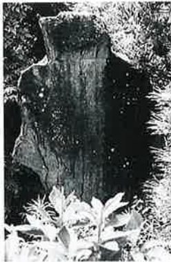
12 句 碑(南山) 戸狩 仲屋敷 明治3年 (137×83×20)