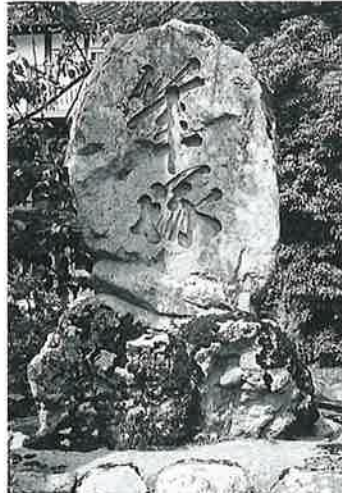
53 筆 塚 戸狩 明治11年5月 (173×80×35)