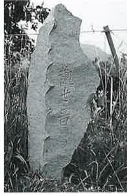
50 観世音 戸狩原(100 ×40×10)