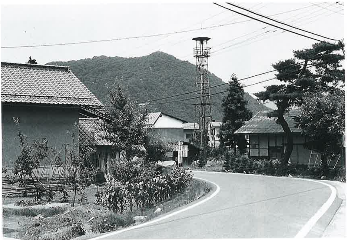
戸 狩 — 箱山にかかわりの深い村 —

北は箱山があつて中野に接し、東は夜間瀬川が迫っている緩い傾斜地である。弥生中期の遺跡もあり、かつては原始的集落があつたと思われ。