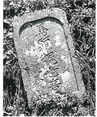
18 馬頭観音 戸狩伊沢山麓 (36×21×13)