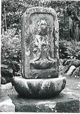
3 観世音 戸狩仲屋敷 寛政10年5月(50×23× 22)