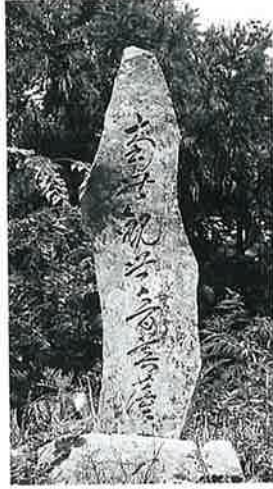
26 供養塔 戸狩 弘化3 年8月(143×35×26)