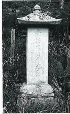
11 観世音 戸狩 文 政年中(150×37× 35)