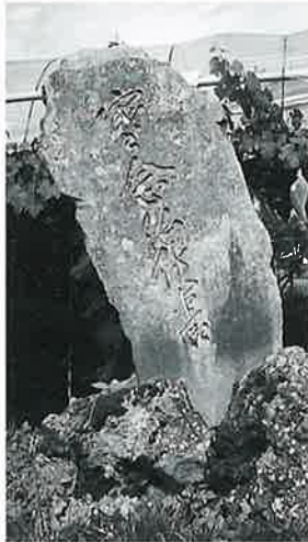
54 寒念仏供養塔 戸狩 文政6年(130×63×21)