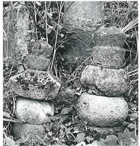
55 五輪塔 戸狩(68×22×30) 55 五輪塔 戸狩(59×27×21)