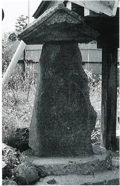
33 厄除観音 戸狩箱山 文政12年4月 (128×60×24)