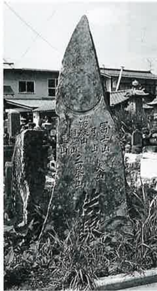
35 供養塔 戸狩箱山 文化13年7月 (156×40×20)