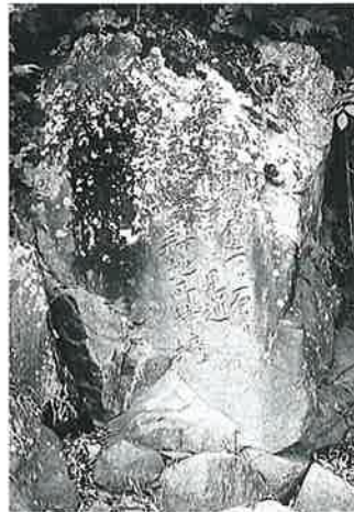
56 耕地所持境石 戸狩箱山 (240×220)