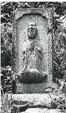
24 観世音 戸狩伊沢 山麓 寛政4年5 月(66×28×25)