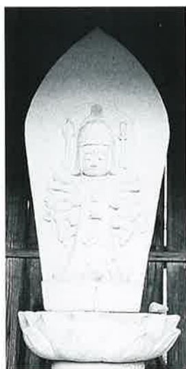
15 千手観音 菅円生里