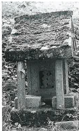
95 天神祠 寒沢大坂(78×50)