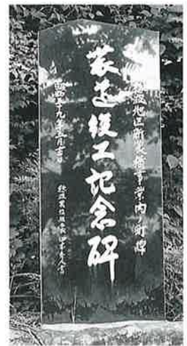
84 記念碑(農道竣工) 寒沢内ノ町 昭和59年 5月(190×60×6)