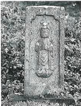
63 供養塔(一百番) 寒沢 上野 文化4年7月(98 ×25×27)