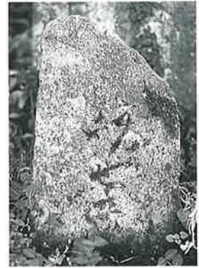
60 馬頭観音 寒沢上野 (68×30×16)