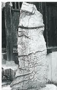
44 地藏尊 菅円生里 (159×28×25)