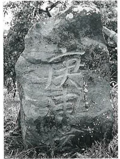
27 庚申塔 菅円生里 寛政12年3月 (100×75×45)