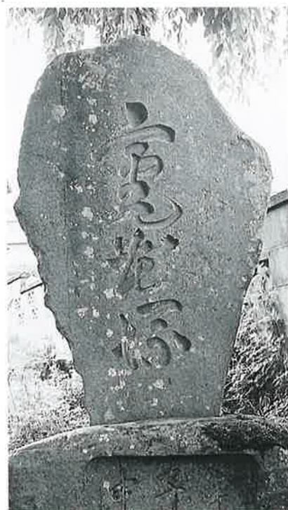
14 筆塚 菅円生里 明治22年5月 (326×88×50)