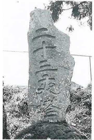
48 二十三夜塔 寒沢上野 天保15年5月 (195×57×17)