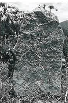
38 薬師如来碑 菅山ノ脇 (130×68×30)