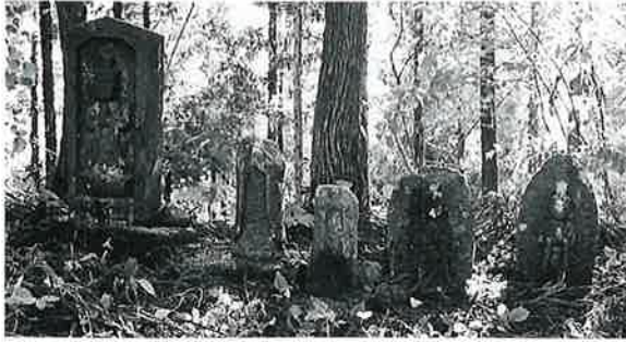
100 地藏尊 菅赤向坂峠(38×15×14)