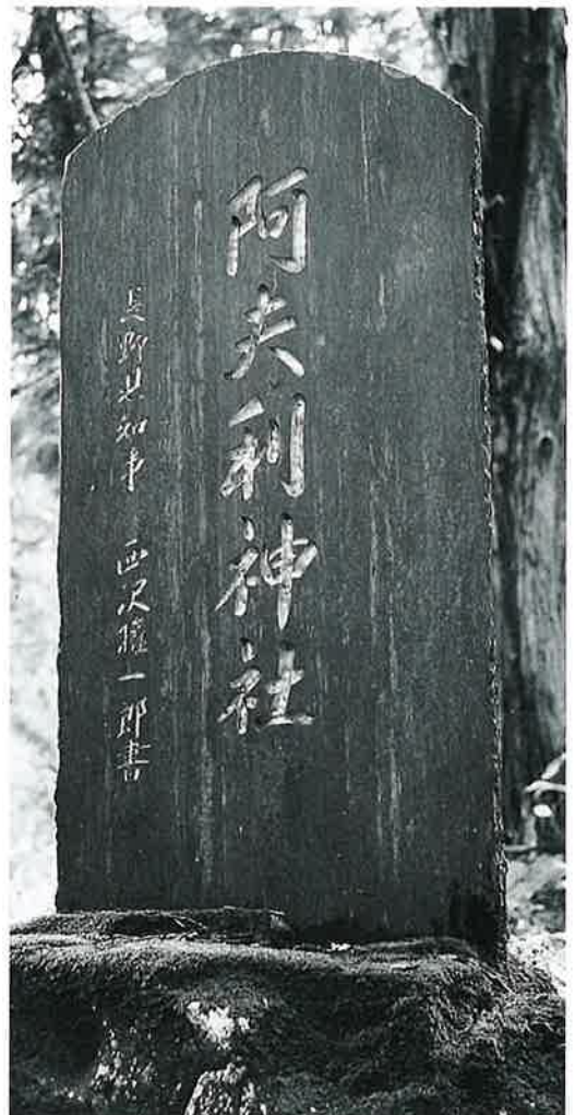
99 阿夫利神社碑 菅石尊山入口 昭和49年9月(160×52×8)