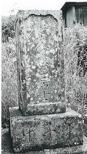
22 筆塚 菅田生里 安政6年8月(118×30×27)