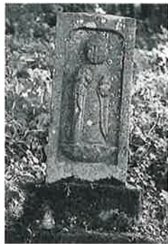
69 供養塔(延命経一万卷) 寒沢上野 寛政12年 3月 (113×23×21)