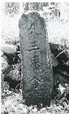
19 供養塔 菅田生里 明和元年8月(80×22×20)