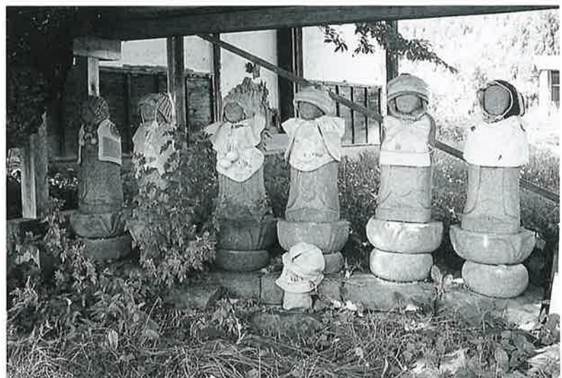
77 六地藏 寒沢上野(91×23×15)