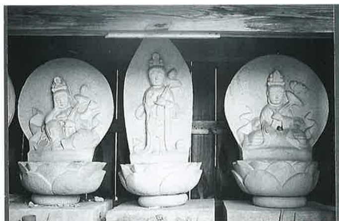
16 六地藏 菅円生里 嘉永7年8月(104×40×30)