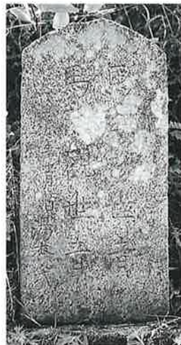
86 馬頭観音 寒沢内ノ町 大正8年6月(69×22× 15)