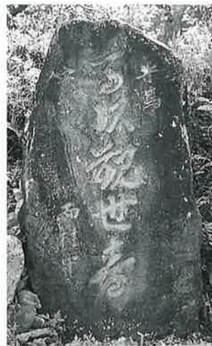
85 馬頭観音 寒沢内ノ町(110 ×55×25)