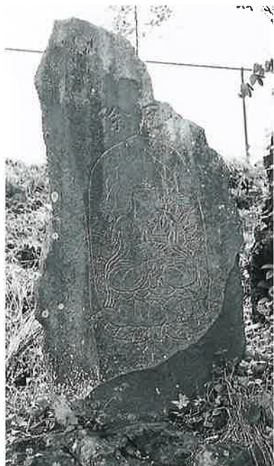
47 観世音 寒沢上野 天保6年6月 (155×120×10)