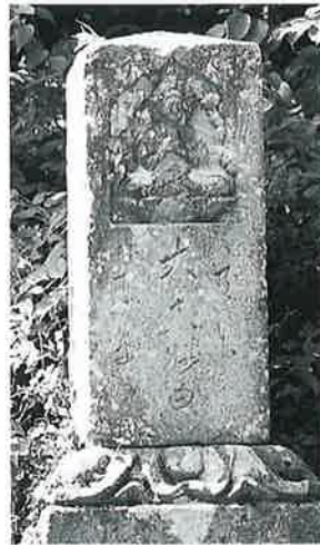
94 供養塔(大乘妙典) 寒沢大坂 嘉永6年4月 (132×30×30)