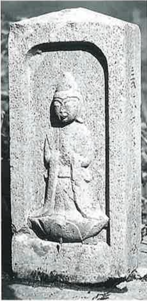
92 供養塔(百番巡礼) 寒沢大坂 寛政3年3月 (100×23×22)