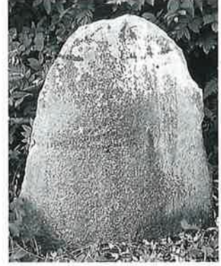
89 畜魂碑 寒沢内ノ町 (110×75×30)