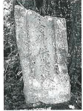
56 供養塔(念仏) 寒沢上 野(89×39×23)