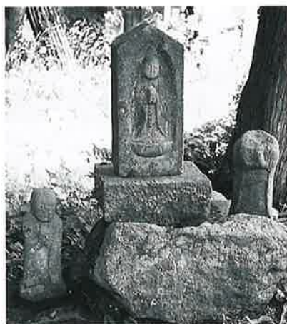
10 地藏尊 菅円生里(104×24×18)