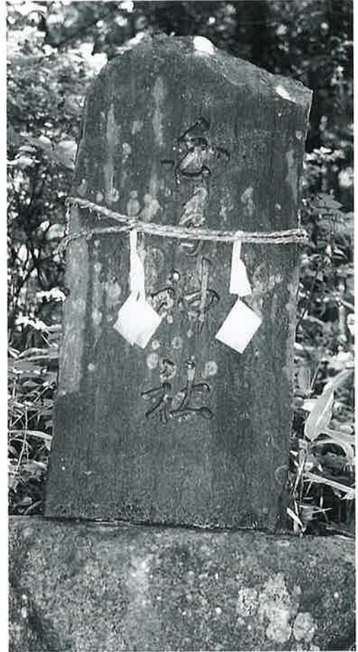
25 白鳥神社碑 菅円生里 昭和33年8月(132×75×8)