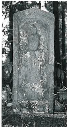
98 地藏尊 菅赤向坂峠(66×41×21)