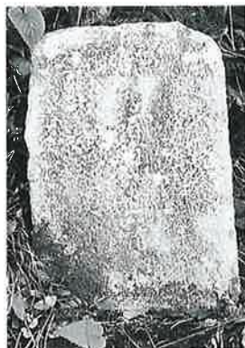
12 馬頭観音 菅井沢 明 治21年8月(50×27× 15)