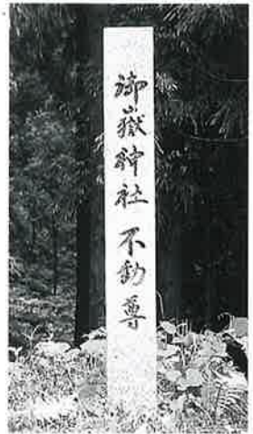
1 道標 菅不動社入口 昭和60年4月(124×15×8)