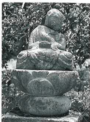
32 地藏尊 菅円生里 文化元年10月(160×36×23)