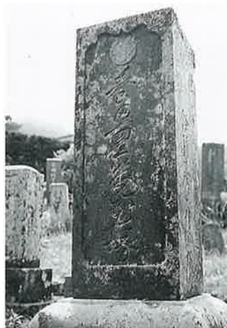
21 筆塚 菅田生里 明治11年8月(129×30×28)