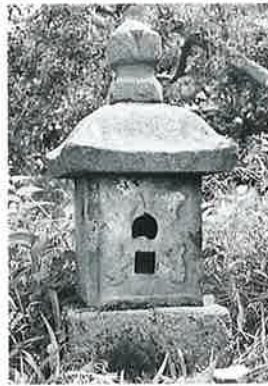
28 庚申祠 菅円生里(103 ×33×31)