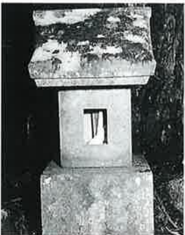
104 弁財天祠 菅池尻(59×20×20)