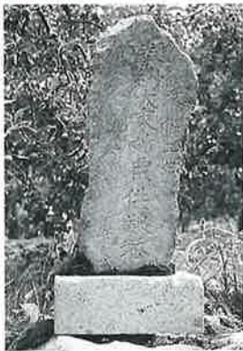
29 供養塔(大乘妙典) 菅円生里 文化2年9 月(90×31×17)