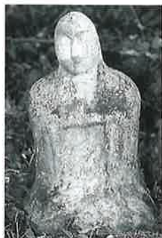
67 地藏尊 寒沢上野 (60×26×16)