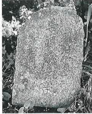
57 馬頭観音 寒沢上野 明治 15年4月(62×24×12)