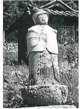
81 地藏尊 寒沢上野(107 ×22×16)