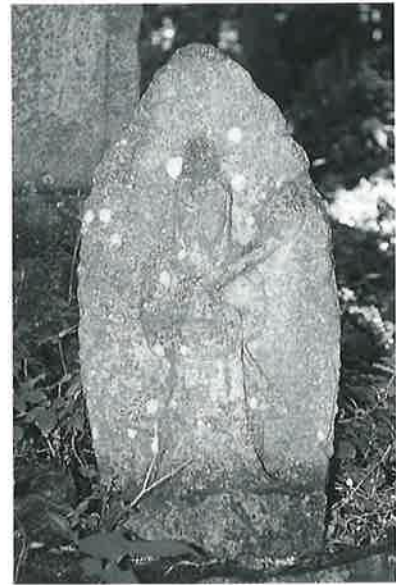
59 観世音 寒沢上野 天明7年9月 (79×25×17)