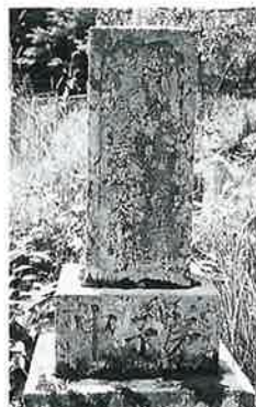
41 筆塚 菅山ノ脇 明治42年11月(80× 30×30)