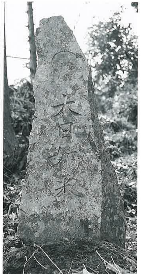
49 大日如来碑 寒沢上野 明治5年4月 (120×45×16)