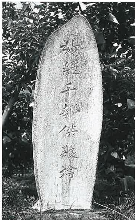
72 供養塔(妙経千部) 寒沢上野 明治17年 12月(117×41×25)