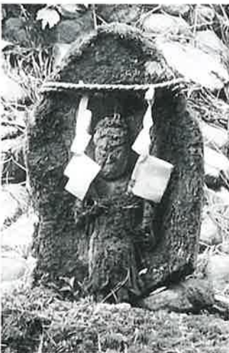
8 不動明王碑 菅不動社内 明治11年8月(40×61×28)