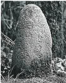
101 道標 菅阿夫利神社入口(36×17×12)