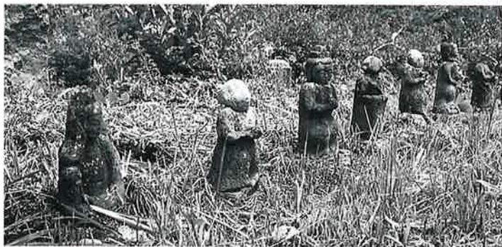
39 六地藏 菅山ノ脇(40×15)