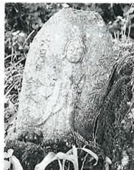
54 馬頭観音 寒沢上野 文化4年6月 (56×24×18)