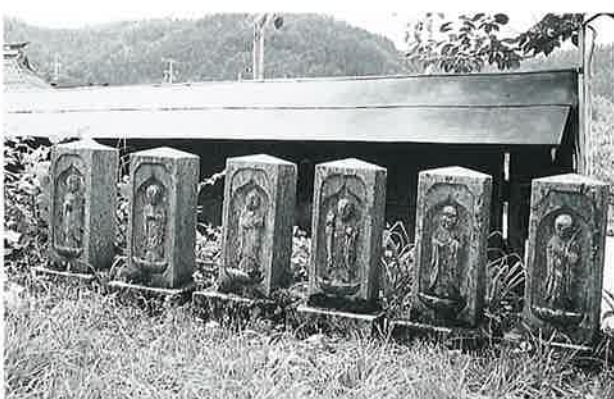
45 六地藏 菅円生里 文化10年7月(80×26×26)