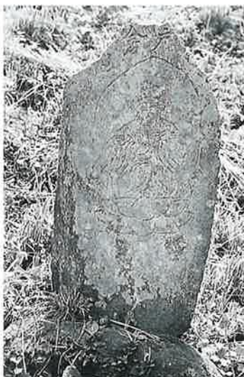
46 観世音 寒沢上野 天保15年8 月(67×45×18)