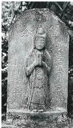
102 馬頭観音 旧山田街道 万延2年11月(45×24×10)