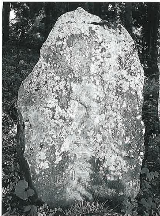
65 供養塔(二十三夜百番) 寒沢上野(134×84×46)