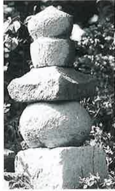
91 五輪塔 寒沢内ノ町