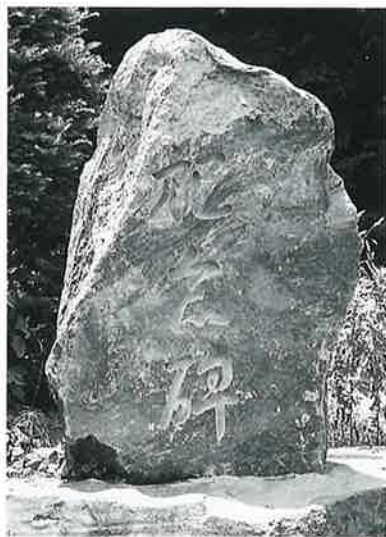
37 記念碑(土地改良) 菅山ノ脇 昭和56年11月(170×68×46)