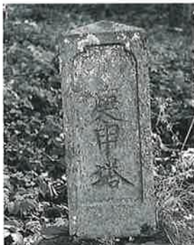
64 庚申塔 寒沢上野 天 明元年7月(87×24×17)