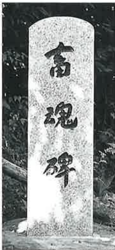
87 畜魂碑 寒沢内ノ 町 昭和59年11月 (136×27×18)