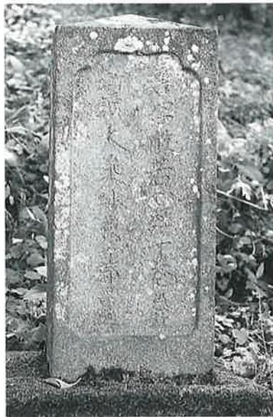
62 供養塔(般若経千卷) 寒沢上野 文化6年(79×27×23)