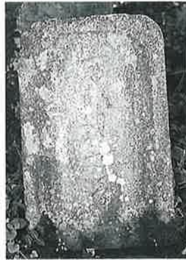
61 馬頭観音 寒沢上野 (41×25×10)