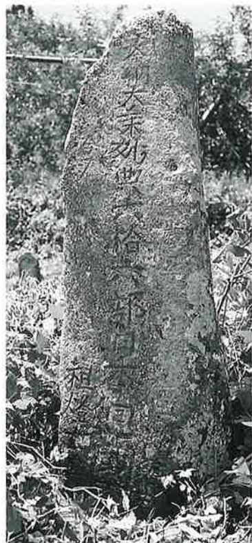
40 供養塔(六十六部廻国) 菅山ノ脇 (135×38×26)