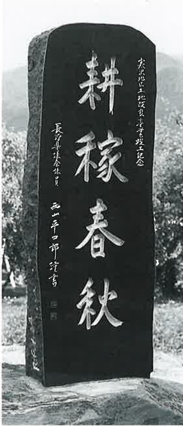
88 記念碑(土地改良) 寒沢大坂 昭和59年11月(255×85×22)