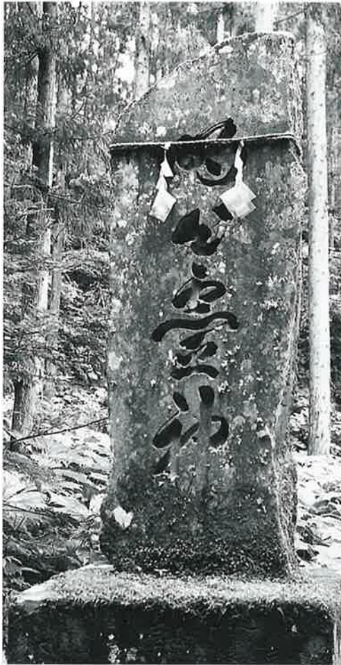
2 靈神碑 菅不動社内 明治22年6月(196×55×23)