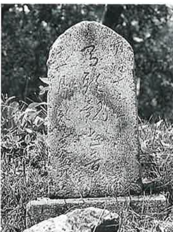
23 馬頭観音 菅下見王 明治2年11月(45×24×10)