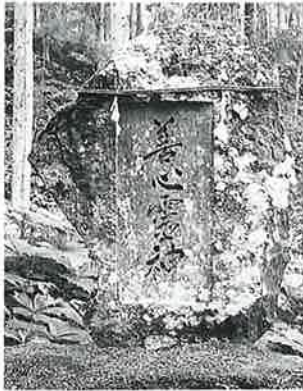
3 靈神碑 菅不動社内 明治23年9月(235×130×20)