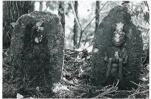
97 馬頭観音(左側) 菅赤向坂峠 文化11年9月(45×26×13)