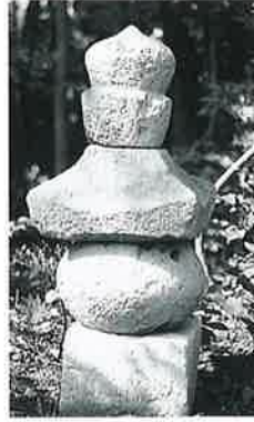
90 五輪塔 寒沢内ノ町 (75×26×26)