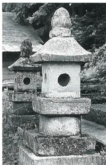
42 石塔 菅円生里(143×28×28)