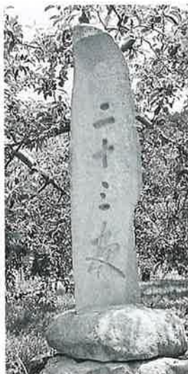
31 二十三夜塔 菅円生里 天保11年8月(235×39 ×18)