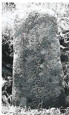
18 供養塔 菅田生里 寛延2年(64×33×25)