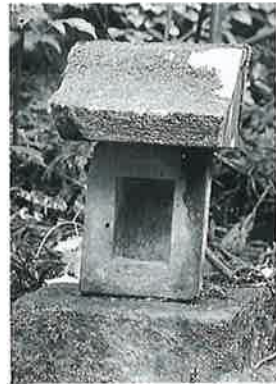
9 蛇神祠 菅大近 明治 22年(59×28×21)