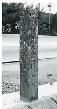
35 道標 菅新田 昭和3年(106×15×15)