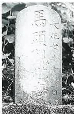
13 馬頭観音 菅井沢 大正7年10月(52× 18×11)