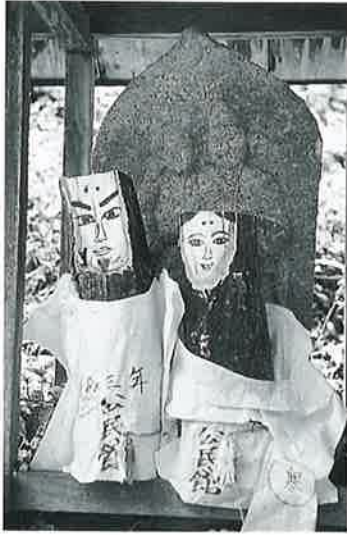
51 双体道祖神 寒沢上野 (50×30×18)