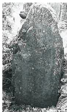
17 供養塔 菅田生里 元文4年(100×50×20)