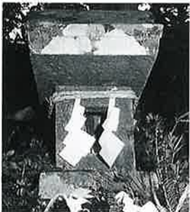
103 不動尊祠 菅三沢山 文久2年(60×23×23)