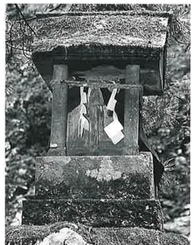
6 靈神碑 菅不動社内 明治11年8月(40×61×28)