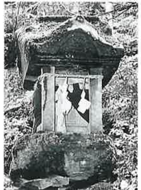
5 靈神碑 菅不動社内 慶応3年(41×36×35)