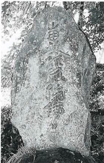
55 供養塔(念仏) 寒沢上野 文化14年9月 (60×26×16)