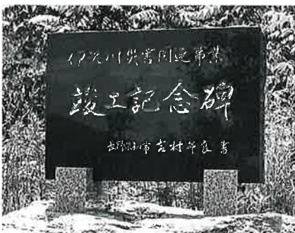
36 記念碑(災害事業) 菅新田 昭和58年12月(148×97×15)