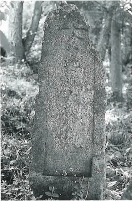
58 金毘羅大権現碑 寒沢上野 文政7年 8月(107×28×12)