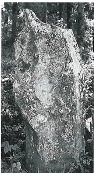
66 青面金剛碑 寒沢上野 明 和元年 6月(120×41×35)