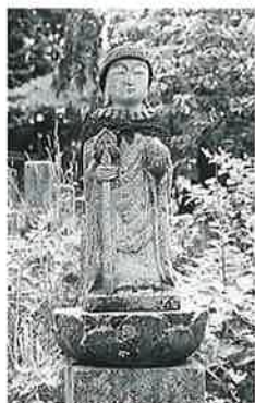
43 供養塔 菅円生里 安永3年7月(135 ×38×26)