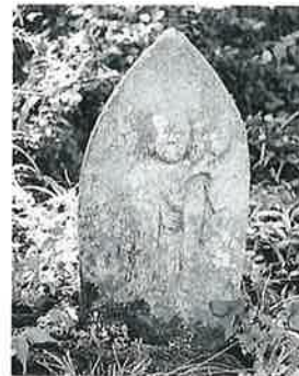
53 観世音 寒沢上野 (57×28×16)