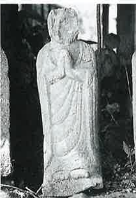
80 地藏尊 寒沢上野 (52×18×12)