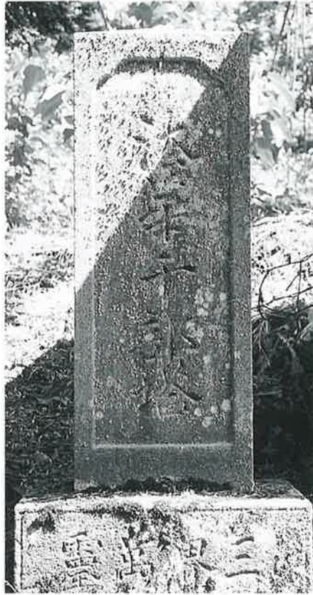
82 供養塔(法華千部塔) 寒沢上野 文政 8年7月(127×33×28)