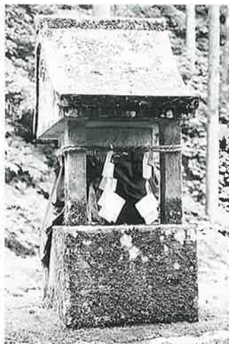
7 靈神碑 菅不動社内 明治11年8月(190×43×30)