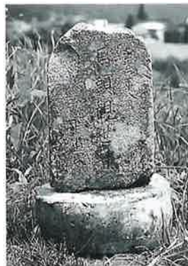
11 馬頭観音 菅宮原 大 正2年8月(64×24×16)