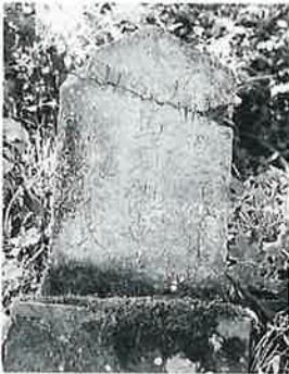
52 馬頭観音 寒沢上野 明治3年7月 (59×27×12)