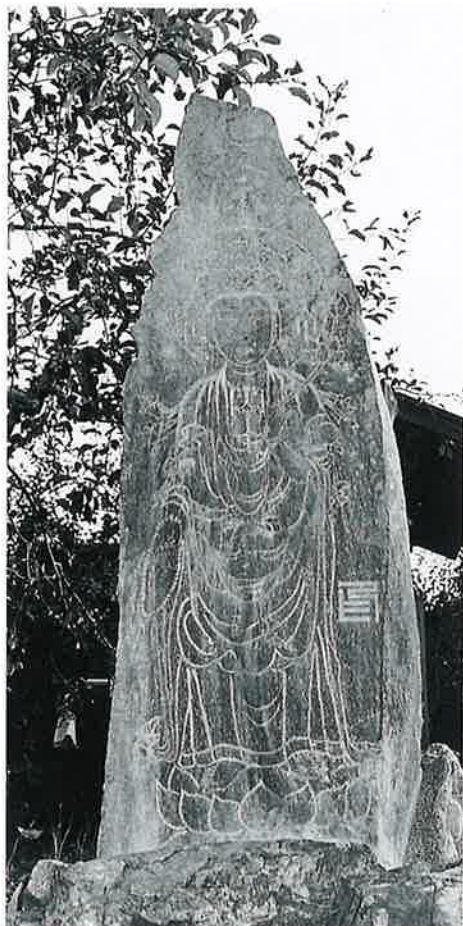
34 北向観音 菅円生里 文政3年(254×50×30)