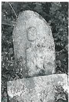
68 地藏尊 寒沢上野 (67×25×12)