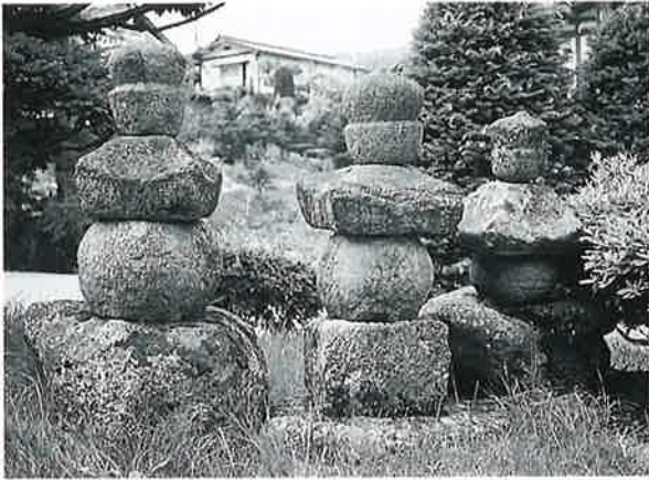
26 五輪塔 菅円生里(83×27×27)