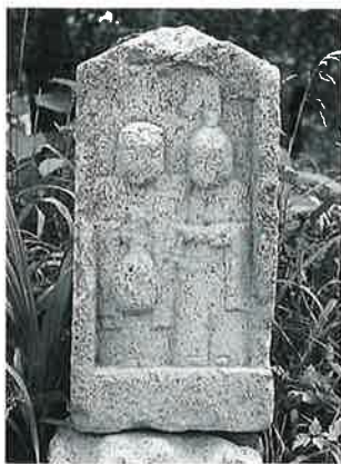
33 双体道祖神 菅円生里 文政7年9月(60×29×25)