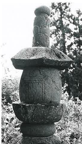
71 宝篋印塔 寒沢上野(141×35 ×35)