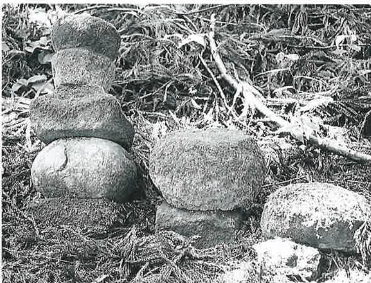
24 五輪塔 菅下見王(61×27×27)