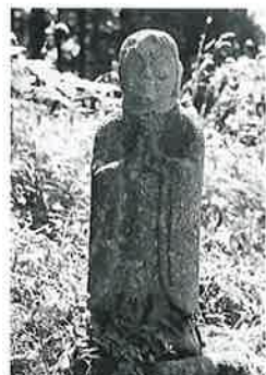
70 地藏尊 寒沢上野 (90×20×15)