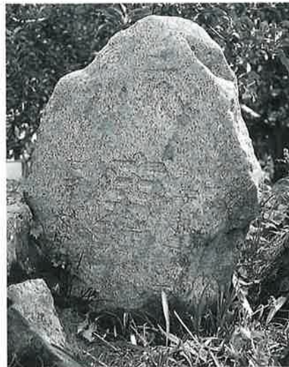
30 庚申塔 菅円生里 安永2年7月(55× 61×21)