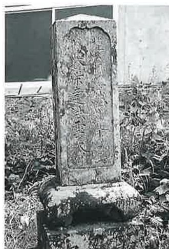
20 筆塚 菅田生里 安政3年6月(152×30×27)