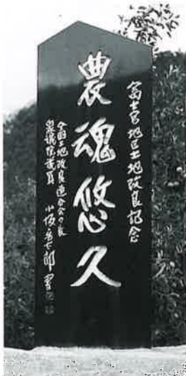
96 記念碑(農魂悠久) 寒沢富士宮 昭和57年7月 (230×69×22)