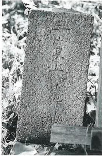
50 三宝大荒神碑 寒沢上野 (37×18×15)