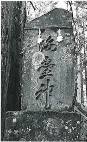
4 靈神碑 菅不動社内 明治26年6月(230×25×27)