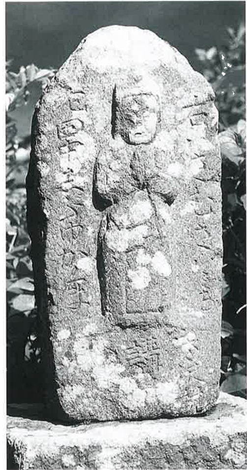
93 観世音(道標) 寒沢大坂 文政13年11月 (113×26×15)