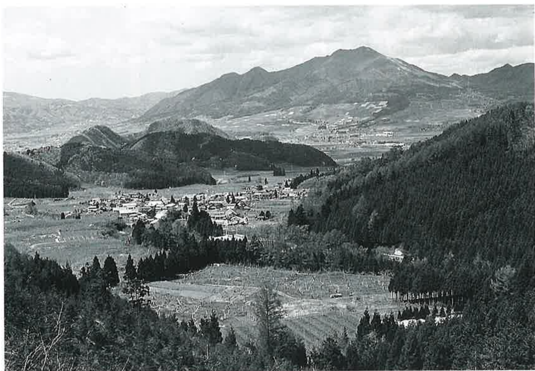
菅・寒沢 — 多種多様な石造文化のある村 —

ここは、古代の日野郷の中心地であった新野・間山と、峠一つ越して隣接した村で、早くから集落が形成されていた。菅の初見は、須毛郷として嘉暦四年（一三一九）に諏訪大社に玉垣を寄進しており、寒沢村は江戸時代の慶長年間とみてよい。