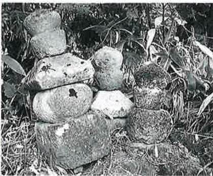
46 五輪塔 上条吉ノ入 (75×26×26)