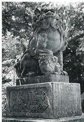
52 狛犬 上条和田十社 昭和28年6月(222×62×70)