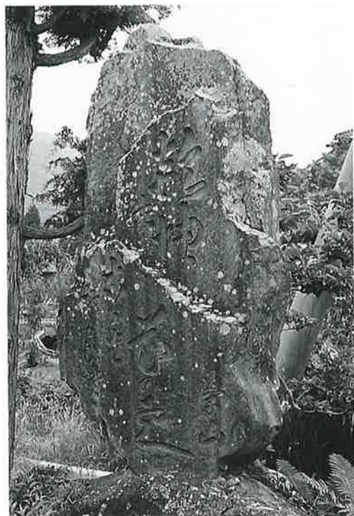
42 句碑(学山) 上条下手 大正4年4月 (185× 90×43)