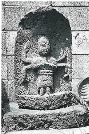
22 青面金剛 上条上原 寛政元年 (65×42)