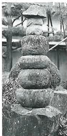
65 五輪塔 上条中村(100×30×30)