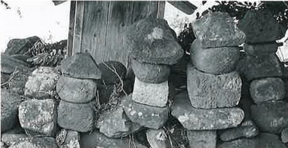
47 五輪塔 上条樽本 (70×27×27)