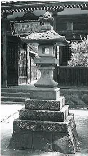
36 石燈籠 上条西下(180×30 ×30)