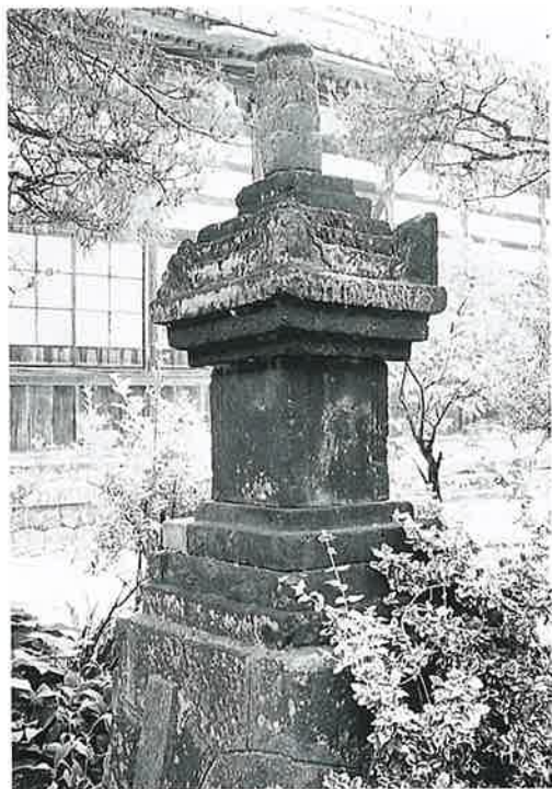
38 宝篋印塔 上条善応寺 (155×36×35)