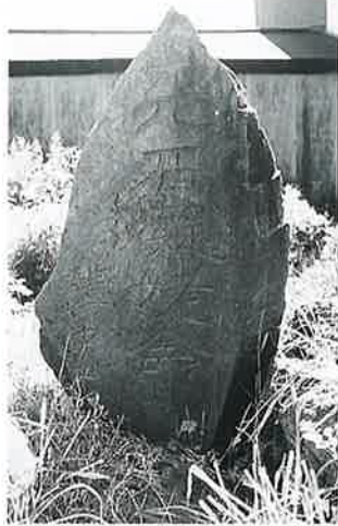
2 天石凝姥命 上条上原 明治11年4月(102×45×12)