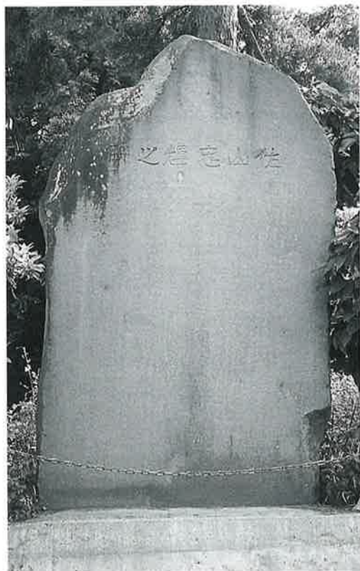
14 佐山忠輝碑 上条川原 明治11年2月(315×180×54)