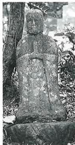
64 観世音 上条和田(52×22×13)