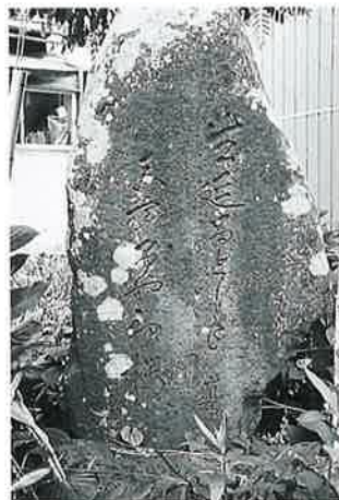
8 句碑 新湯田中 明治26年4月(170×85×26)