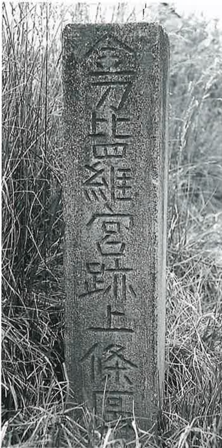
5 金刀比羅宮跡 上条川原(86×20×19)