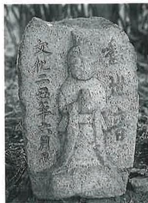
37 観世音 上条善応寺 文 化2年6月 (41×25×16)