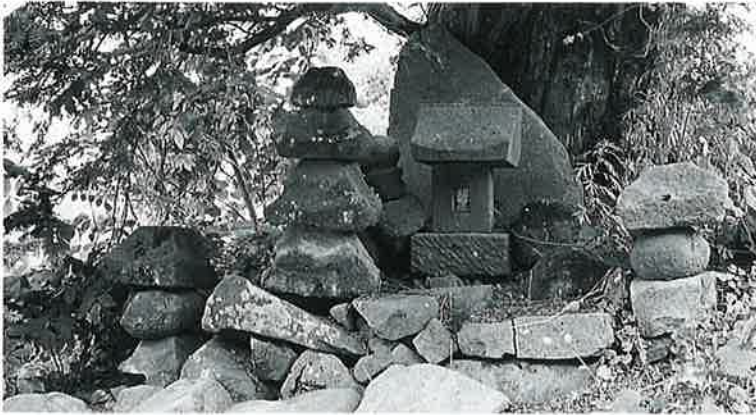
45 五輪塔 上条吉沢