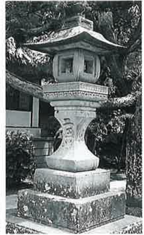
25 石燈籠 上条善応寺 文化8年3月(350×41 ×41)