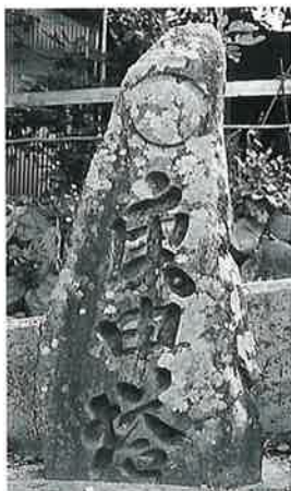
12 庚申塔 新湯田中八幡坂 享和3年(115×45×20)