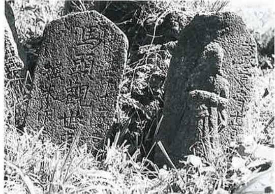
1 馬頭観音 上条上原 明治11年12月(42×25×5) 1 観世音(浮彫) 上条上原 安政3年6月(47×24×6)