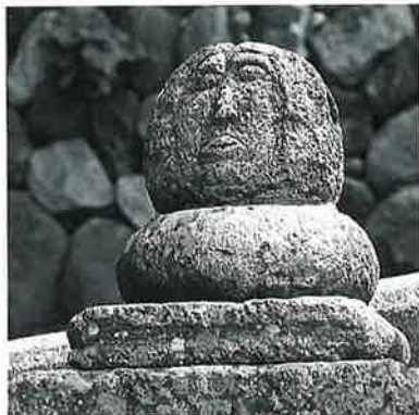
9 仏頭 新湯田中八幡坂(27×25×25)