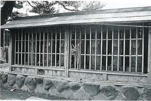
35 六地藏 上条西下