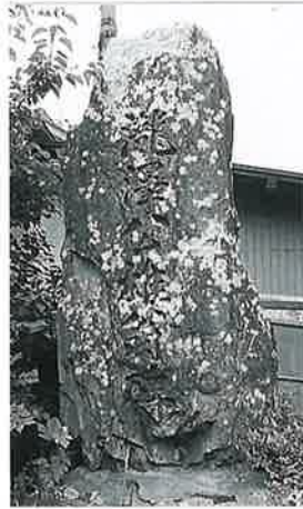
23 頌徳碑(滝沢) 上条西 下 明治44年4月(205 ×105×45)