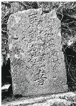
54 馬頭観音 上条東村 明治44年7月(40×24)