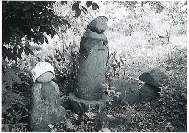
16 地藏尊 上条上原 (84×25×20)