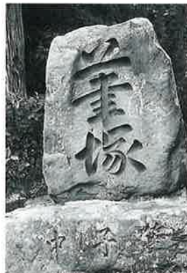
48 筆塚(富岡) 上条和田十社 明治25年12月 (226×98×50)