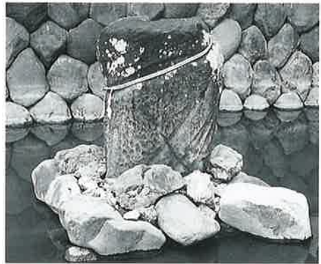
4 狩高尊 新湯田中入口