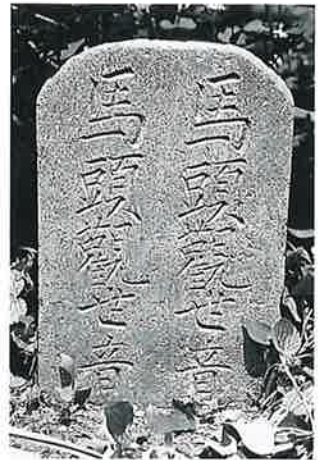
18 馬頭観音 上条西村上 大正9年2月 (42×28×12)