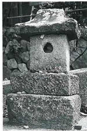
11 庚申塔 新湯田中八幡坂 明治20年9月(80×43×23)