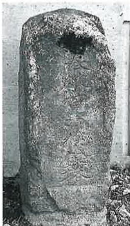
30 供養塔 上条西下 慶応亥3月(51×21× 16)