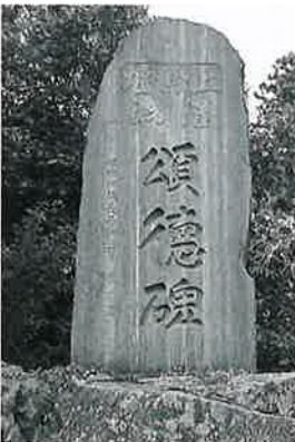
49 頌徳碑 上条和田十社 昭和20年1月 (195×90×14)