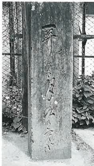
7 句碑 新湯田中(148×38)