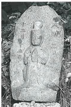
59 馬頭観音 上条和田 天明2年12月(45×25×9)