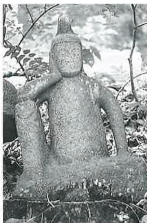
62 如意輪観音 上条和田(64×38×15)