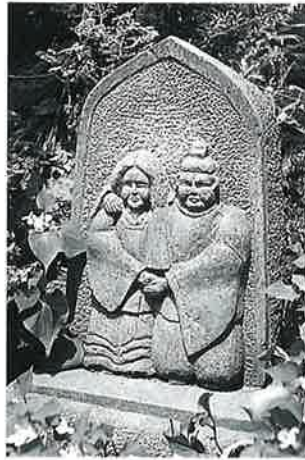
19 双体道祖神 上条西村上 昭和58年 (55×45×11)