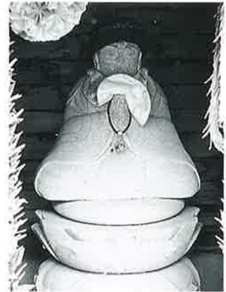
44 地藏尊 上条吉沢 (50×37×17)