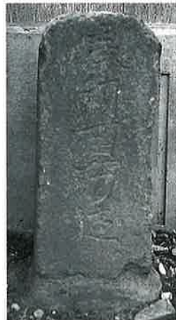
29 供養塔(奉納百万遍) 上条西下 万延2年 (59×26×23)