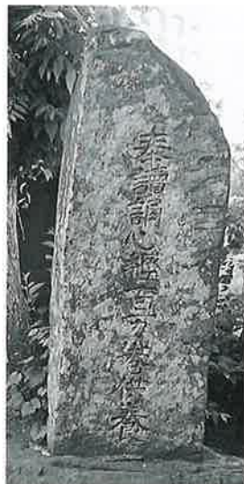
34 供養塔 上条西下(153 ×65×30)