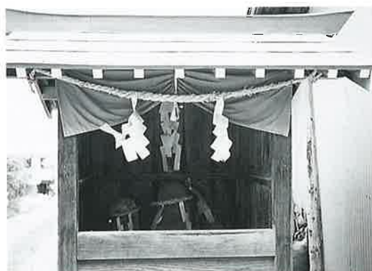
41 道祖神 上条下手 (45×23×20)