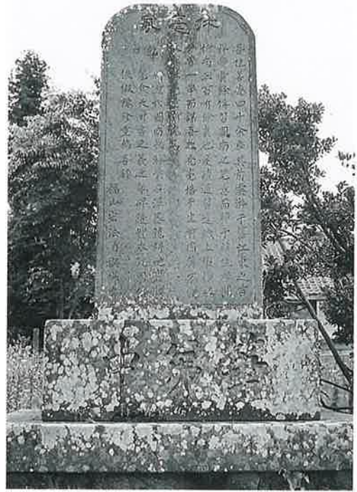
31 筆塚(休毫塚) 上条西下 明治11年4月 (167×80×45)