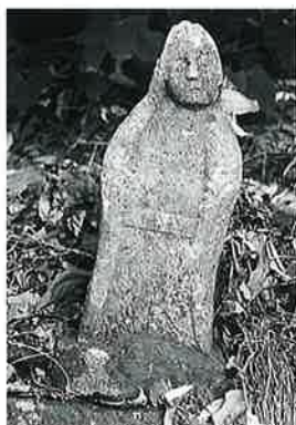
58 観世音 上条和田(45×16×10)