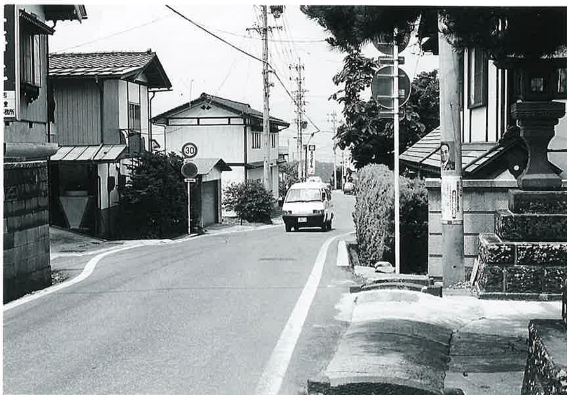
上 条 信仰心の尾を引く土地

鎌倉時代初期に高社山麓に展開していた笠原御牧は、南条と北条に分かれていた。その北条の地域に上条が位置している。