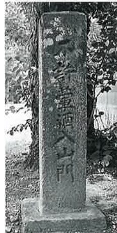
27 結界石 上条西下 寛延2年8月(104 ×27×26)