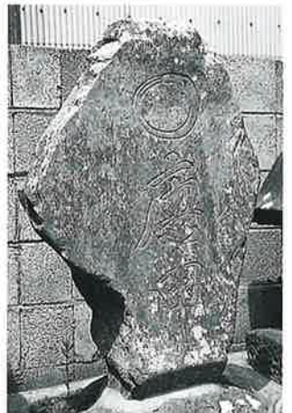
20 庚申塔 上条西村上 寛文 3年8月 (118×32×29)