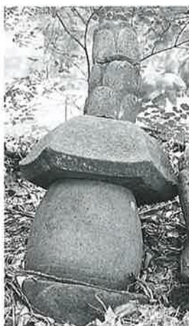
63 多宝塔 上条和田(92×30×25)