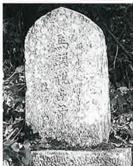
57 馬頭観音 上条和田 昭和15年4月(43×22×15)