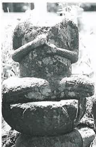
66 大日如来 上条善応寺(36×30×15)