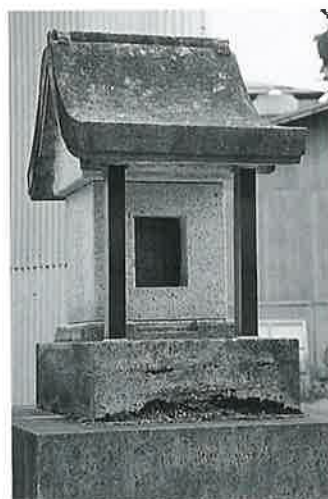
43 石祠 上条中村 貞享5年 4月 (93×33×30)