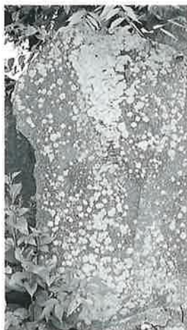
67 観世音 上条善応寺 文化10年8月(100×60×10)