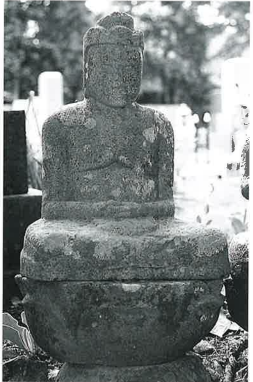
33 大日如来 上条西下(53×30×15)