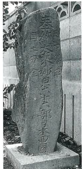
28 供養塔 上条西下(107×29 ×25)