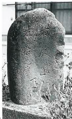
15 道標 上条川原(66×40×24)