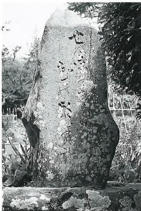
55 句碑(竹園) 上条和田 大正4年4月(125×65×30)