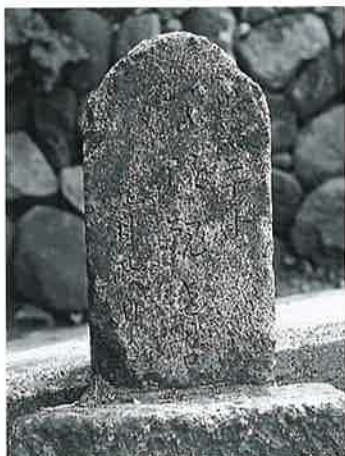
10 馬頭観音 新湯田中八幡坂 明治20年9月(40×20×10)