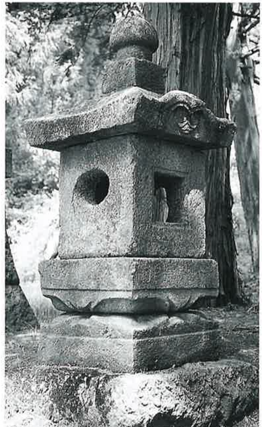
50 石燈籠 上条和田十社 寛延4年3月 (143×35×35)