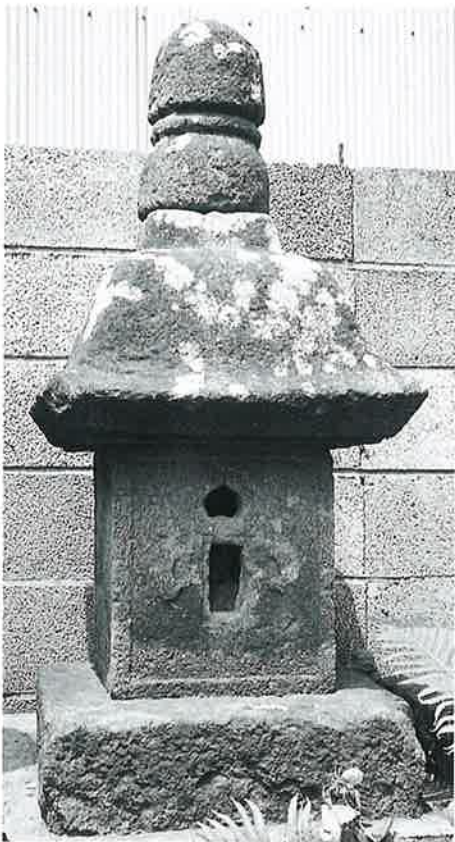
21 庚申塔 上条上原 安政2年3月 (95×65 ×17)