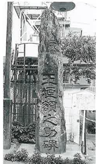
6 頌徳碑(玉垣) 新湯田中入口 明治27年9月(400×100)