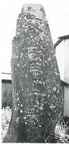
3 寒念仏供養塔 上条上原 文化11年12月(151×62×7)