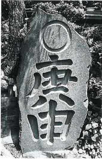
17 庚申塔 上条西村上 寛政12 年12月 (130×58×20)