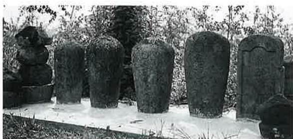
53 名号碑 上条和田十社 享保8年(52×26×26)