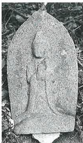
60 観世音 上条和田 天明2年11月(51×30×8)