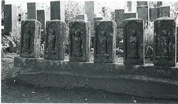
32 六地藏 上条善応寺