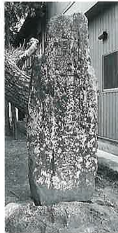
26 供養塔 上条西下 (220×72×57)