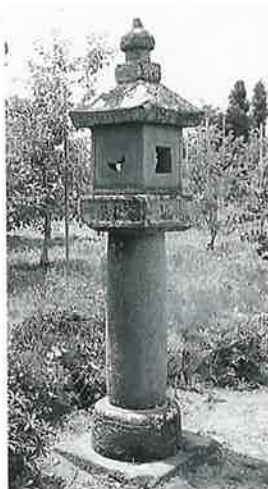
39 石燈籠 上条善応寺 嘉永2年7月 (235×33×33)