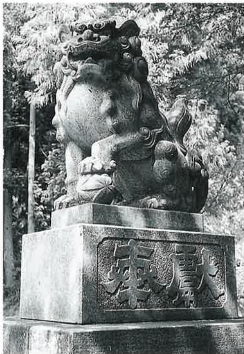
51 狛犬 上条和田十社 昭和28年6月(222×62×70)