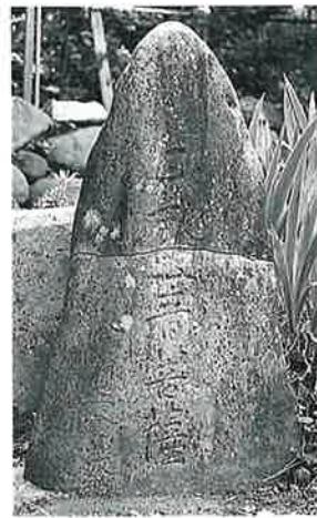
13 聖観世音 新湯田中八幡坂(85×45×18)