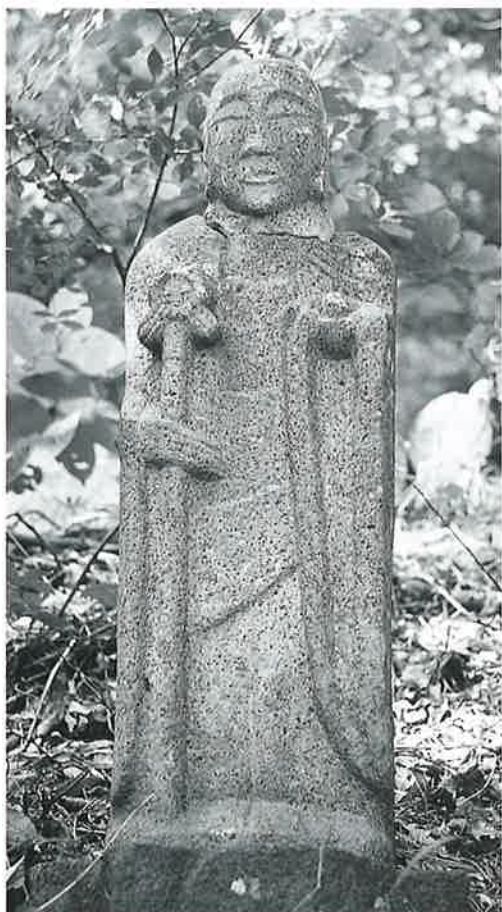
61 地藏尊 上条和田(71×26×17)