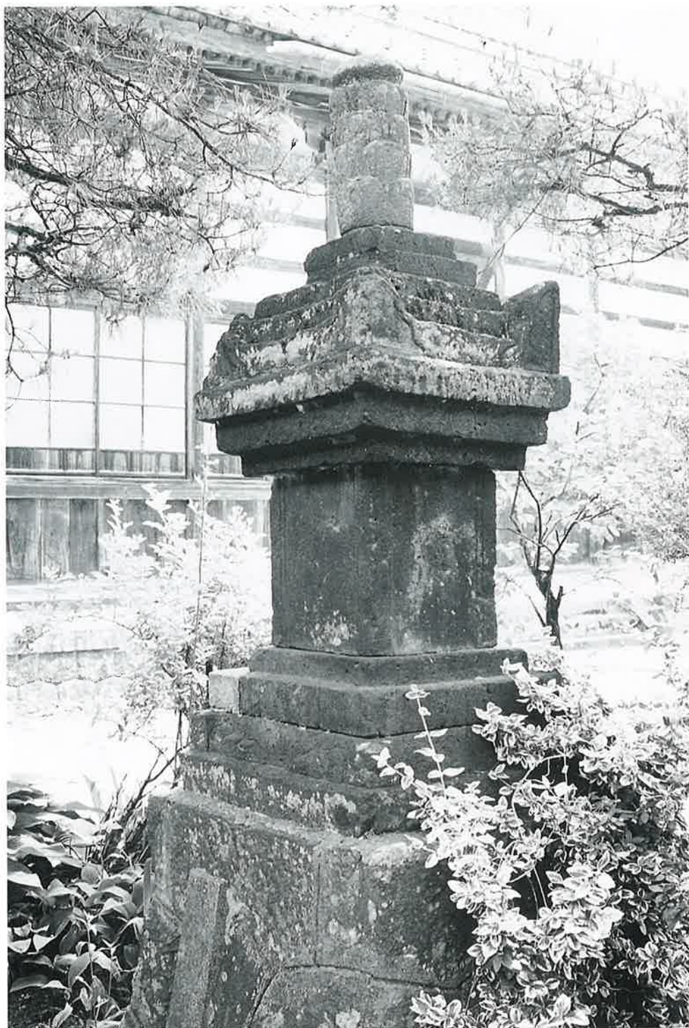
宝篋印塔（上条の部No.38）