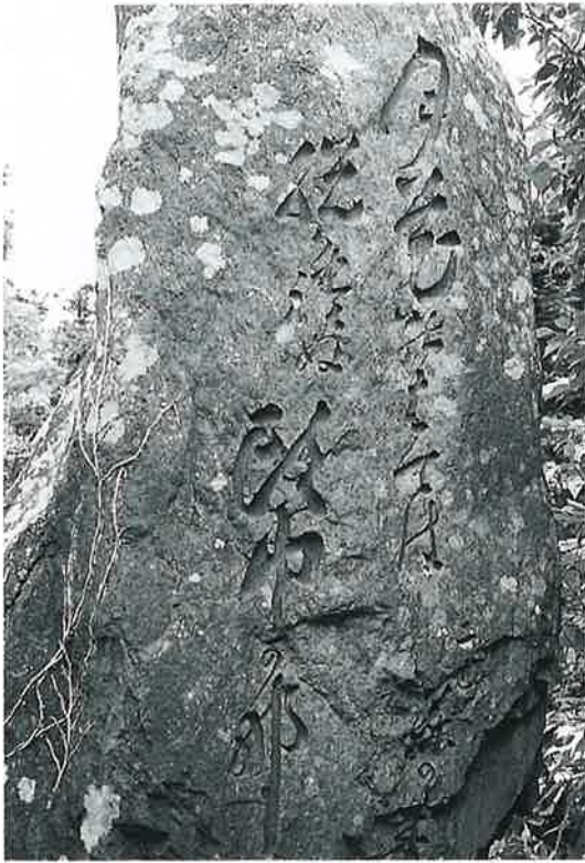
24 23の裏面 月花のはては脱れぬ頭巾かな