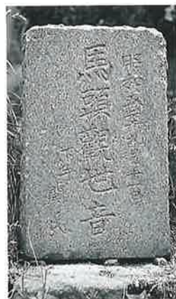
40 馬頭観音 上条西下 昭和5年9月 (42×22 ×13)