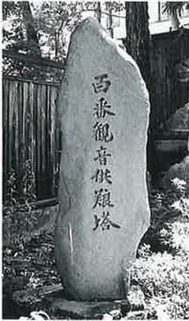
22 供養塔(百番観音) 湯田中梅翁寺 昭和52 年秋(140×43×26)