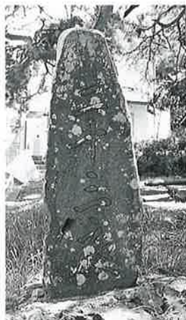
7 二十三夜塔 湯田中座王山 安政2年9月 (113×50)