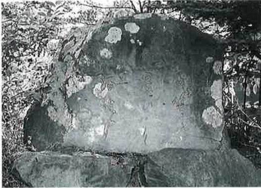
30 句 碑(一茶) 湯田中梅翁寺(105×155×37)