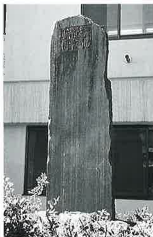
44 頌徳碑(児玉果亭) 文化センター前 大正3年11月(270×88×12)