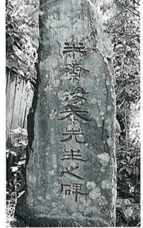
28 頌徳碑(湯本半斎) 湯田中梅翁寺 明治26年4月(165×65×48)