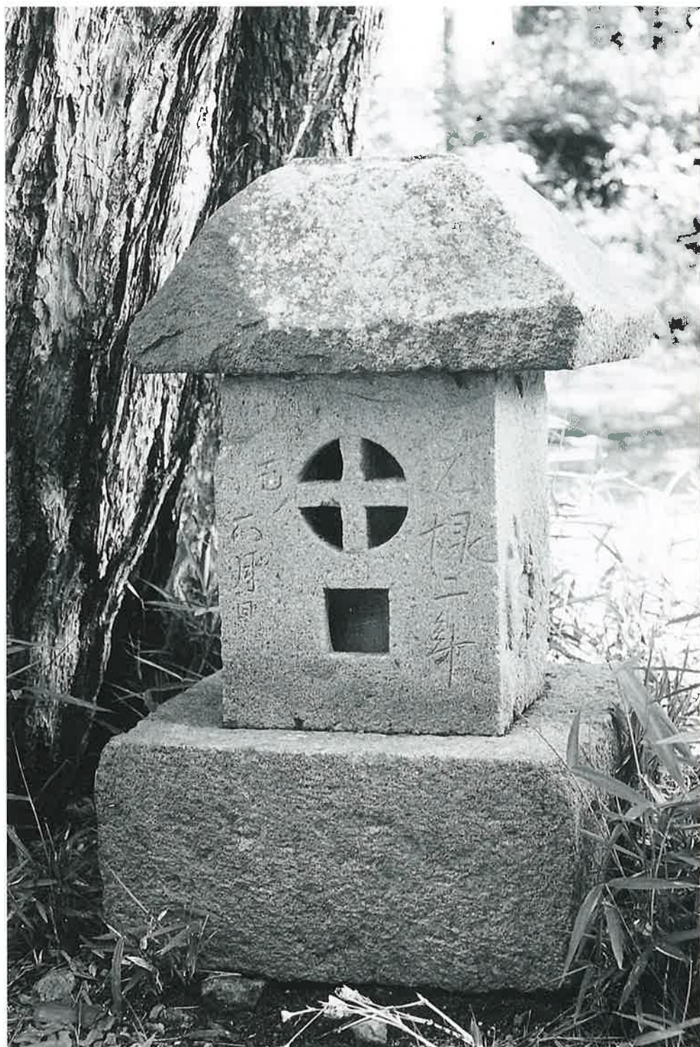
庚申塔（湯田中の部No. 6）