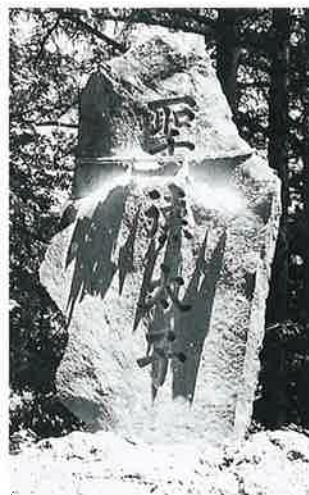
4 聖徳太子碑 湯田中湯宮裏山 (203×113)