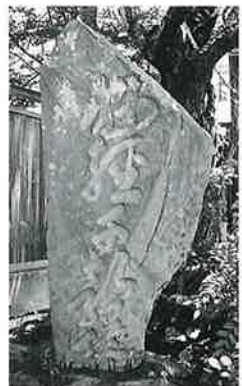
23 納経千部供養塔 湯田中梅翁寺 天 保3年