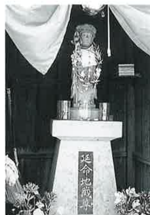
40 延命地藏尊 星川橋の上 昭和49年11月(49×16×10)