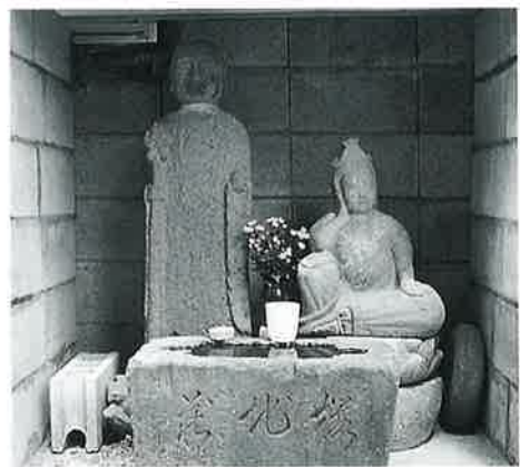
34 地藏尊(桜地藏) 湯田中参拝坂(94×30)