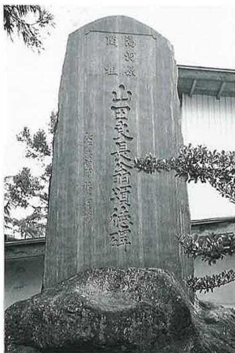
43 頌徳碑(山田良長) 湯川原 昭和33年孟夏(205×105×14)