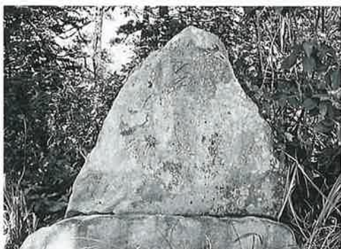
9 句碑(恵泉) 湯田中一茶散歩道 明治26年4月 (95×85×26)