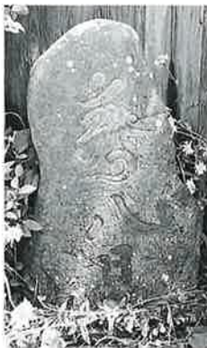
25 供養塔(八日塔) 湯田中梅翁寺(83× 40×25)