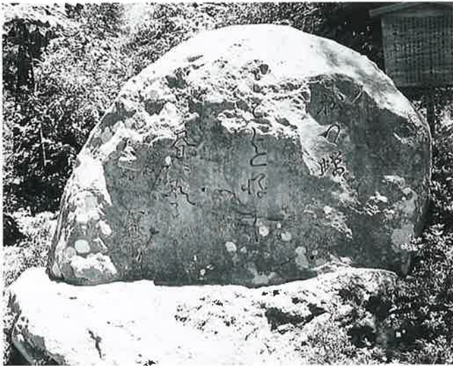
11 句 碑(一茶) 湯田中一茶堂(125×170×58)