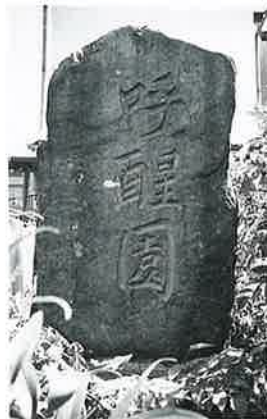
35 記念碑(呼酔園) 湯田中七面堂(110×64×30)