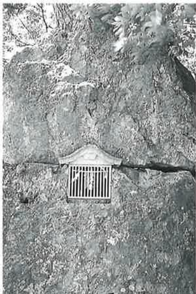
3 記念碑 湯田中 明治16年