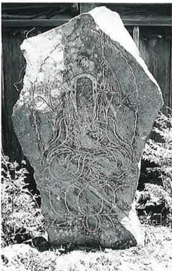
26 不動尊碑 梅翁寺