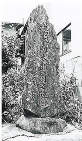
38 頌徳碑(湯本初太郎) 星川 昭和2年(165×50×53)