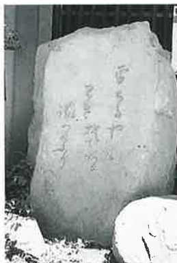
16 句 碑 湯田中大湯前(160×120×38)