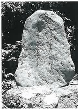
14 句 碑(一茶) 湯田中よろづや前(87×60×20)