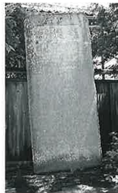
24 頌徳碑(小田切義謙) 湯田中梅翁寺 明治 43年12月(173×73)