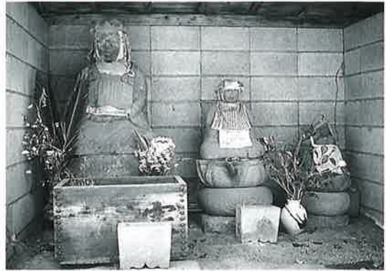
19 地藏尊 湯田中梅翁寺 天保9年10月(98×60× 10)