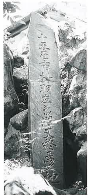
12 記念碑(終焉碑) 湯田中よろづや庭(195×36×15)