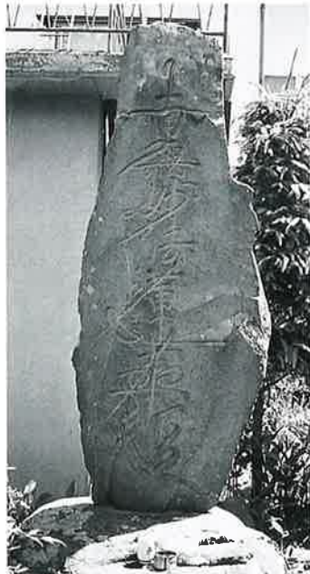
36 供養塔(南無妙法蓮華經) 湯田中七面堂(200×80×20)