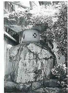
15 句 碑(一茶) 湯田中よろづや前(140×140)