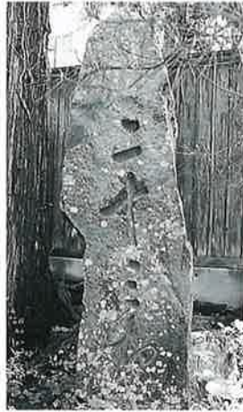
21 二十三夜塔 湯田中梅 翁寺 安政5年5月 (200×55×18)