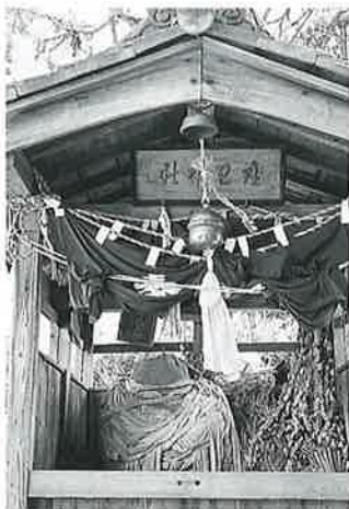
8 座王(山の神) 湯田中座王山 (130×45×50)