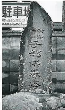
33 供養塔(千部) 湯田中布施谷写真館前(130×46×23)