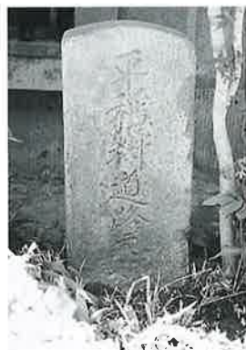
17 道 標 湯田中大湯前(55×26×26)