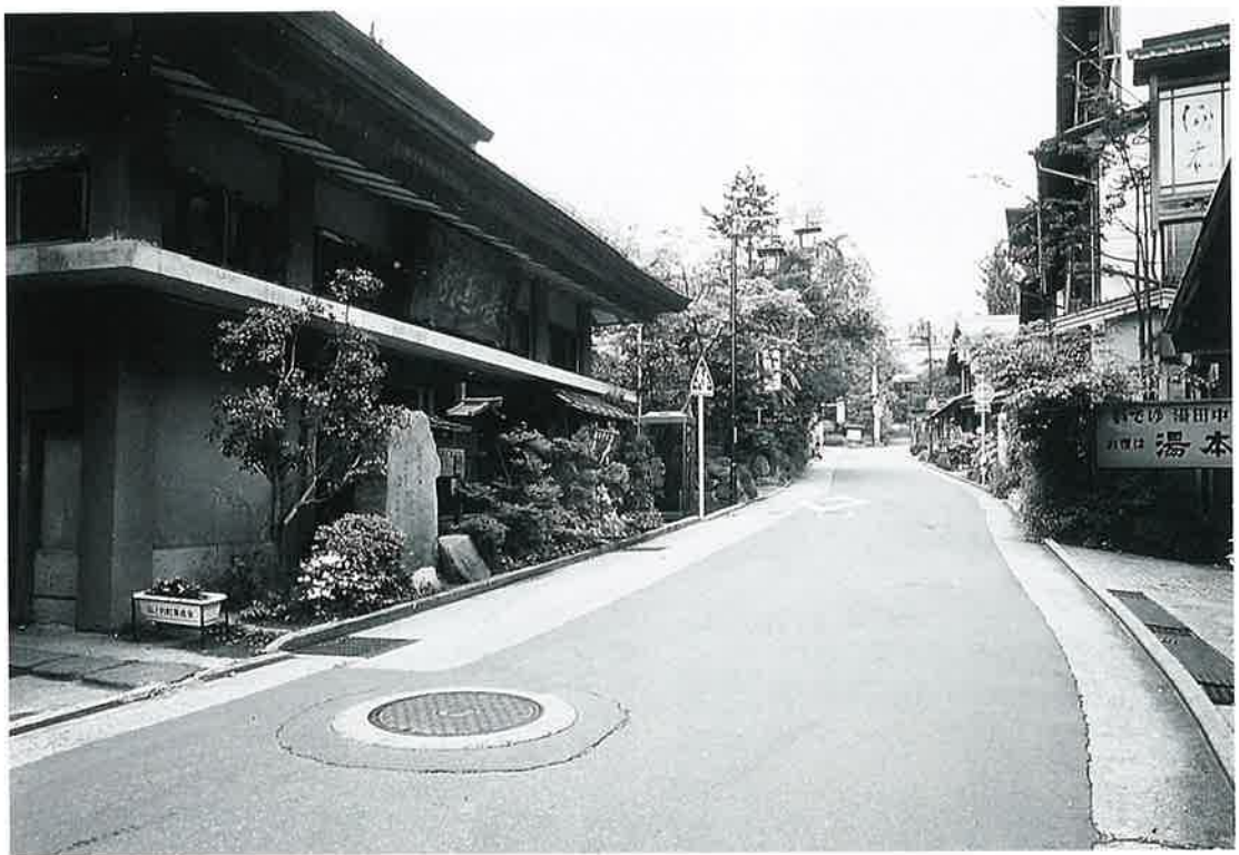
湯田中・星川 —長電の終点に発展した繁華街—

鎌倉時代の金倉井御牧の牧司の居住地は、湯田中近辺でこの温泉もすであつたと思われる。県下最古の弥勒の石仏もこの地に安置されている。室町中期頃から、豪族高梨氏の別荘的な存在となり、江戸時代には松代藩主の湯治場ともなった。 近代に入つては、志賀高原とともに文人墨客の来訪が多くなり、長野電鉄の終点地として星川河原にも発展し、現在の温泉街の形態をなした。