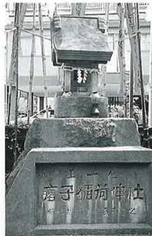
42 稻荷祠(瘡守神社) 湯川原 昭和30年6月(100×50×30)