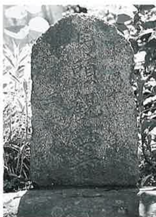
41 馬頭観音 鈴虫坂 明治11年5月(43×26×13)