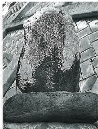
37 供養塔(百番) 星川喜右工門坂 天保13年(78×58×20)