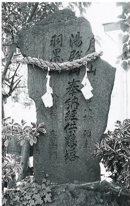
39 供養塔(出羽三山) 星川 文久2年(125×63×15)