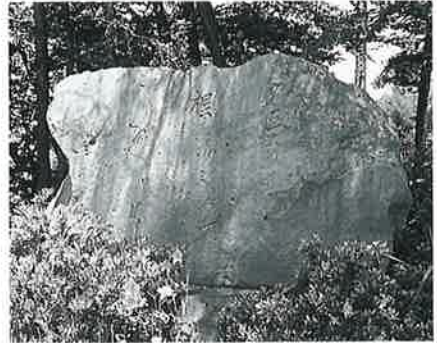
10 句 碑(一茶) 湯田中一茶堂(110×170×50)