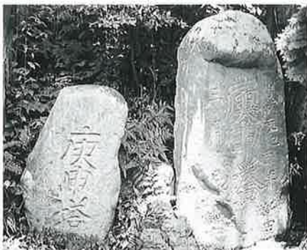
2 庚申塔 湯田中座王山 寛政元年4月 (120×60)