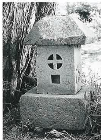
6 庚申祠 湯田中座王山 元禄2年6月 (50×26×24)