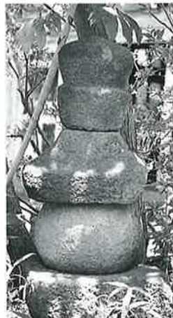
13の1 五輪塔 湯田中よろづや前(76×36×36) 13の2 五輪塔 湯田中市川正主(65×25)