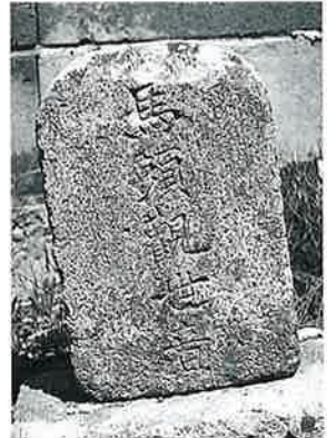
32 馬頭観音 湯田中布施谷写真館前