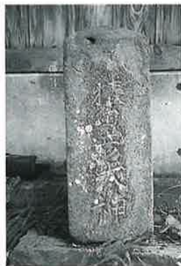
18 猿田彦大神碑 湯田中梅翁寺 延享5年6月(65×25×22)