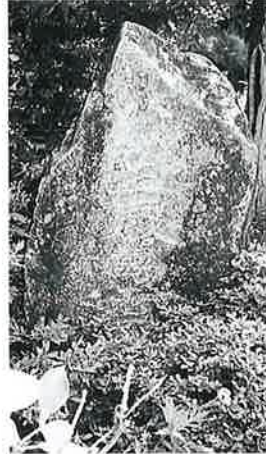
29 三界万霊塔 湯田中梅翁寺(134×66×28)