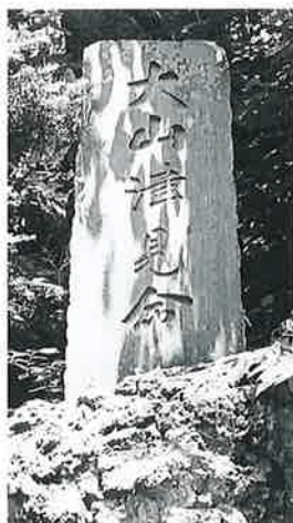
5 大山津見命 湯田中湯宮裏山 大正12年12月 (115×46)