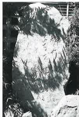
1 句碑(一茶) 湯田中わしの湯前 (175×88×32)