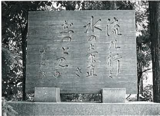
31 句 碑(川柳) 湯田中中島医院 昭和36年6月(94×122×15)