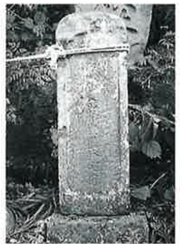
57 供養塔 沓野下組一 (68×23 ×19)