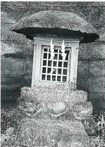
61 稲荷祠 地獄谷