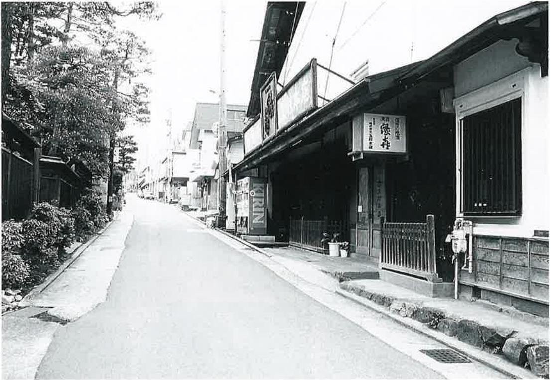
沓野 — 宿場の面影を残す家並み —

沓野は慶長年間には、巢鷹山に 関係した所であった。近世に入っ てからは、草津往來の坂本的集落 として発達し、宿場的な存在とな った。