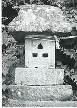
47 庚申塔 沓野下組一 安永6年(104×55)