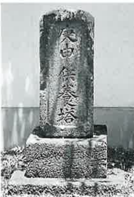
26 供養塔(庚申) 沓野観音寺境内(67×28×24)