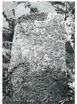
58 百番供養塔 沓野 文政12年(130×45)