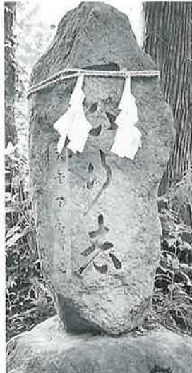
9 靈神碑(一心行者) 沓野上林 昭和52年9月(126×52×35)