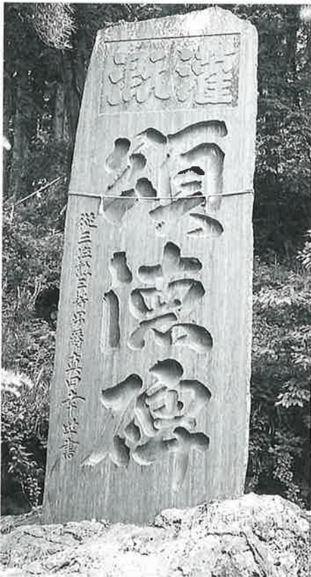
8 頌徳碑(灌漑) 沓野上林 昭和6年6月 (435×150)