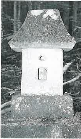
3 庚申塔 沓野十二沢 寛延2年11月(86×31× 31)