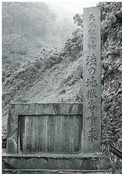
60 記念碑(地獄谷噴泉) 地獄谷 昭和 50年10月(40×140×21)