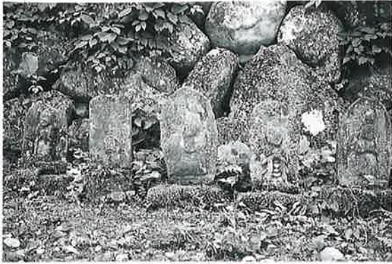
55 観世音群 沓野観音寺(51×29×16)