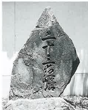
25 二十三夜塔 沓野観音寺境内(96×66×24)