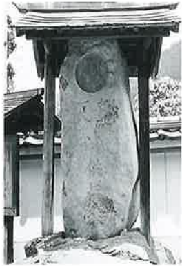
20 供養塔(百八十八番) 沓野観音寺境内 明治22年7月(190×62×55)