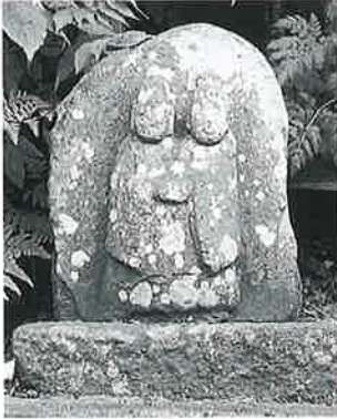
48 双体道祖神 沓野下組一 文政7年(45×35)