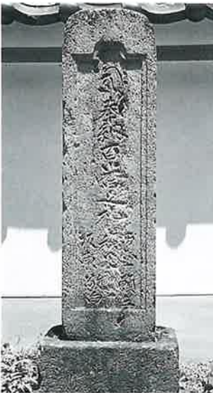
24 百番巡礼塔 沓野観音寺境内 享保元年9月(112×32×25)