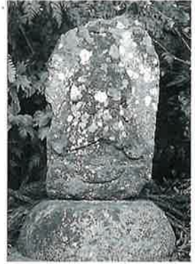
53 聖観音 沓野和合橋 (45×26×8)