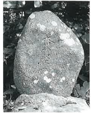
18 記念碑(斎田) 沓野天川神社境内(55×40×11)