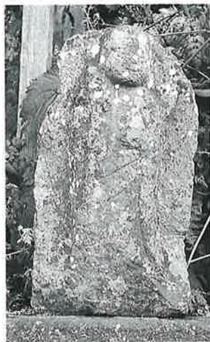
52 地藏尊 沓野和合橋(50×30)