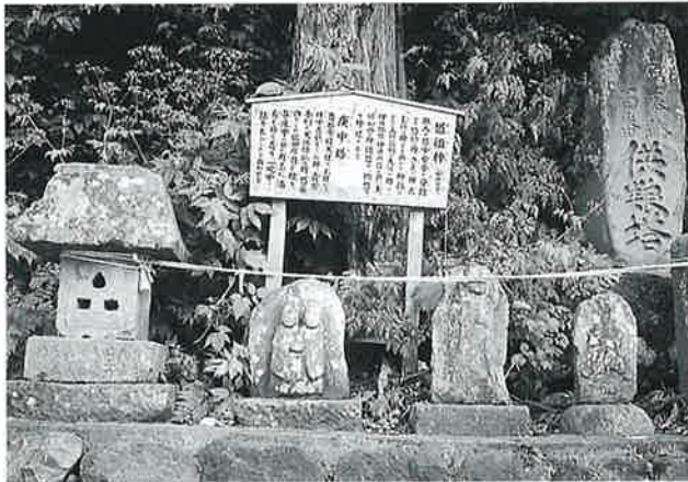
51 石仏群 沓野下組一