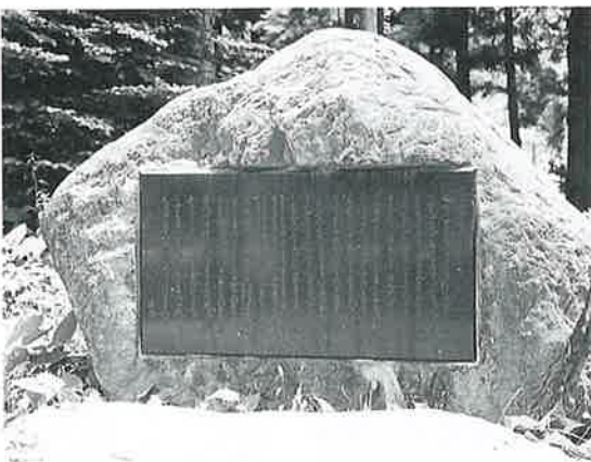
15 佐久間象山祭文 沓野天川神社境内 昭和44年8月(49×91×61)