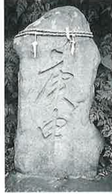
46 庚申塔 沓野下 組一(110×55×20)