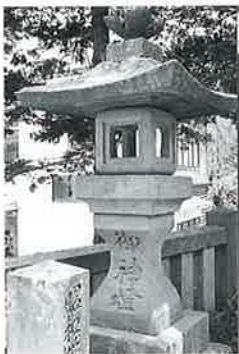
14 石燈籠 沓野天川神社境内