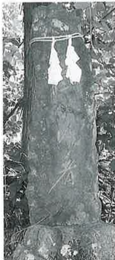
10 靈神碑(正心行者) 沓野上林 大正11年9月(146×42×24)