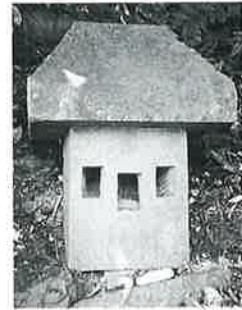
42 庚申塔 沓野沢組 (60×27×25)