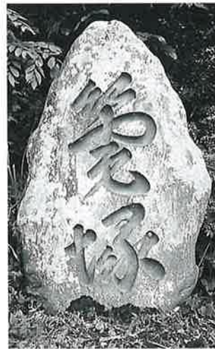
50 筆塚(中村孝右衛門) 沓野下組一 安政6年(176×98×42)