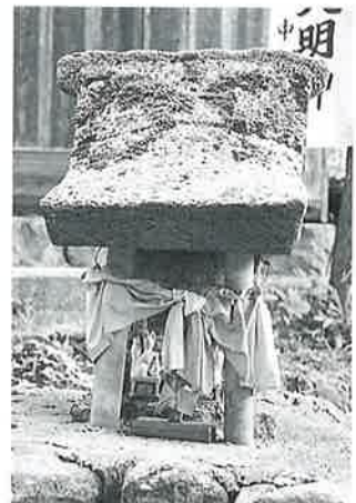
6 稲荷大明神 沓野桑山旧道 (66×27×25)