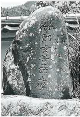
21 頌徳碑(竹節玄量) 沓野観音寺境内 明治28年3月(120×85×52)