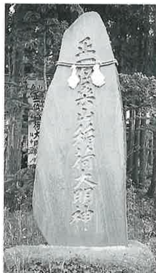
7 稲荷大明神 沓野桑山旧道 昭和60年5月(166×58×21)