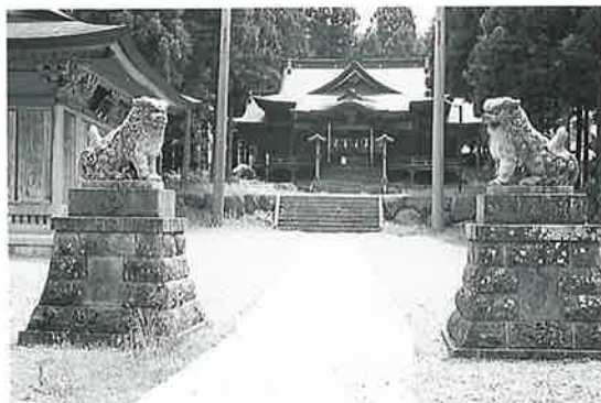
13 狛犬 沓野天川神社 昭和10年9月