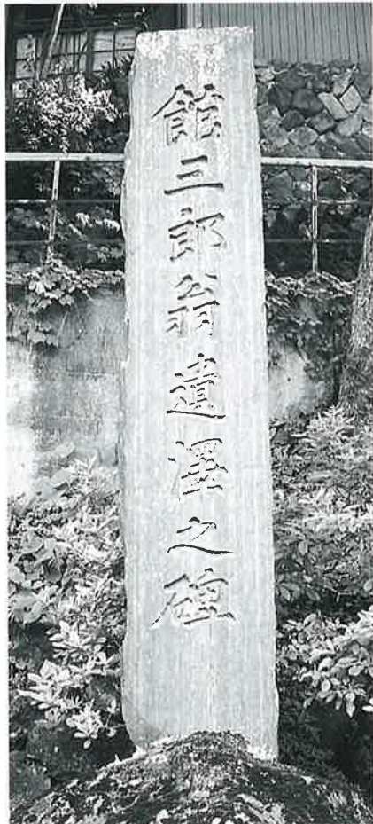
44 頌德碑(館三郎) 沓野下組一 大正2年6月(300×55×22)