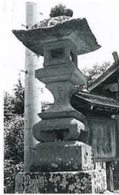
19 石燈籠 沓野観音寺境内(340×40×40)