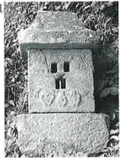
40 庚申塔 沓野沢組 (70×37×45)