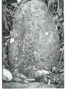
36 大日如来 沓野沢組 元治2年5月(55×33×16)