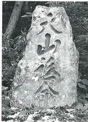
5 大山祇命 桑山旧道 天保12年(105×55×20)