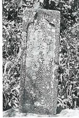
38 供養塔(湯殿山) 沓野沢組 宝曆14年6月(80×28×24)