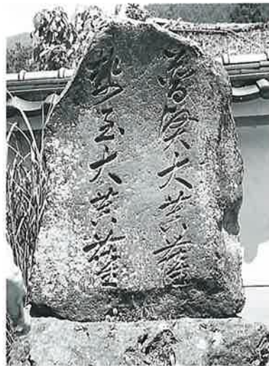
23 供養塔(普賢・勢至) 沓野観音寺境内 文久2年6月(158×105×40)