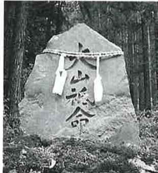
2 大山祇命 沓野十二沢(88× 67×15)