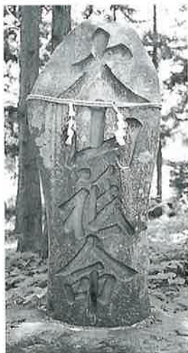
16 大山祇命 沓野天川神社境内 天保13年5月(132×60×18)