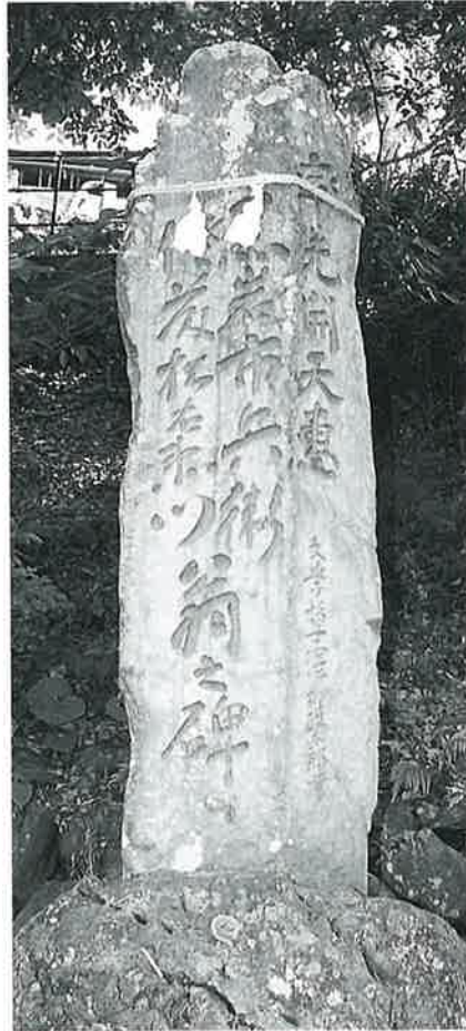
43 頌德碑(牟先開天恵碑) 沓野下組一 大正6年5月(215×80×41)