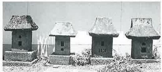
27 庚申塔(四基) 沓野観音寺境内