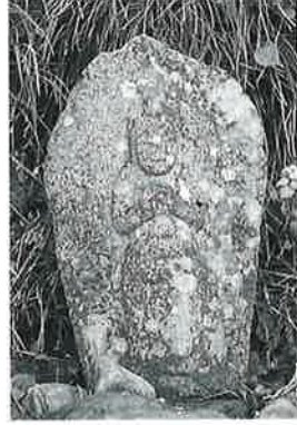
37 馬頭觀音 沓野沢組