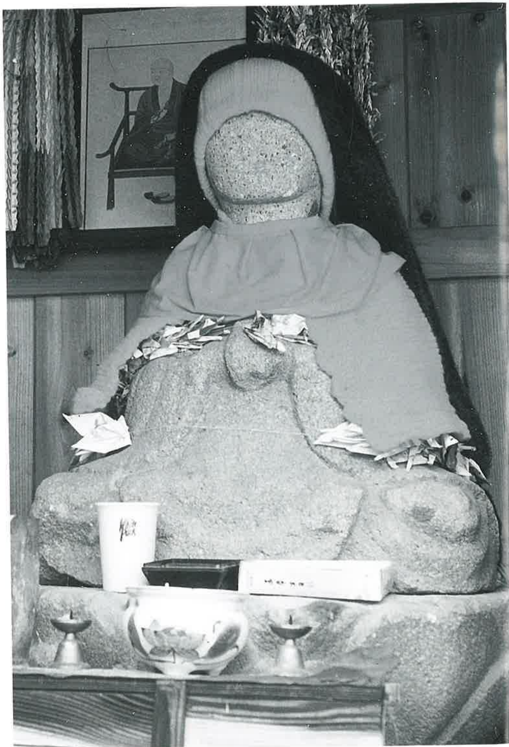
弘法大師(沓野の部No.35)