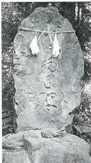
11 靈神碑(代々先達) 沓野上林 大正2年(228×127×15)