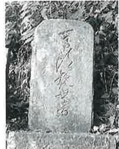
41 馬頭觀音 沓野沢組 明治19年10月(47×40×24)