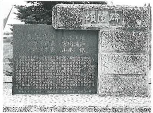
1 頌徳碑(砂防工事) 沓野島崎 昭和36年6月 (120×75×12)