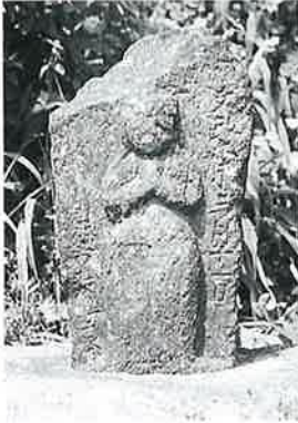
39 觀世音 沓野沢組 文政6年3月(43×22×17)