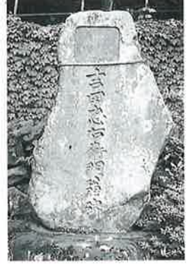
45 頌徳碑(吉田忠右衛門) 沓野下組一 大正2年8月(195×105×48)