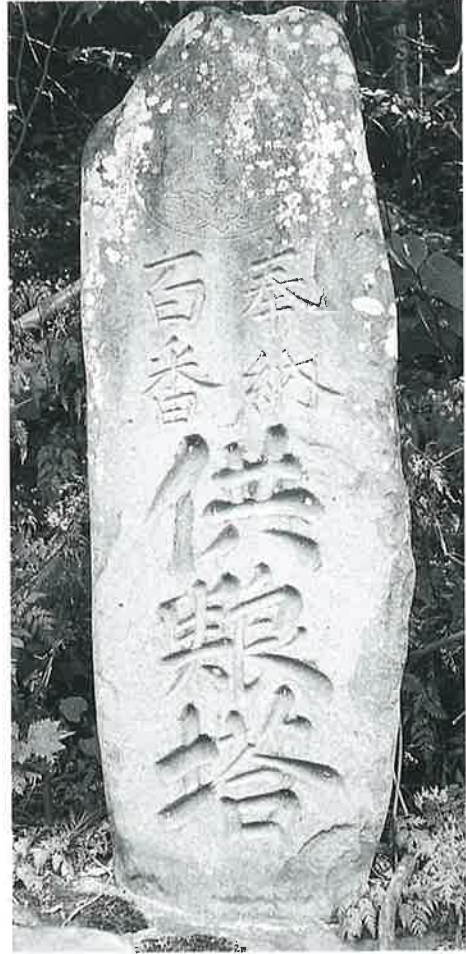
49 供養塔(百番) 沓野下組一 文政12年8月(130×45)