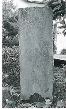
54 歌碑(五無斎) 沓野下二 昭和50年 (110×35×18)