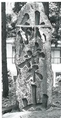
17 秋葉山碑 沓野天川神社境内 文政5年2月(126×40×30)