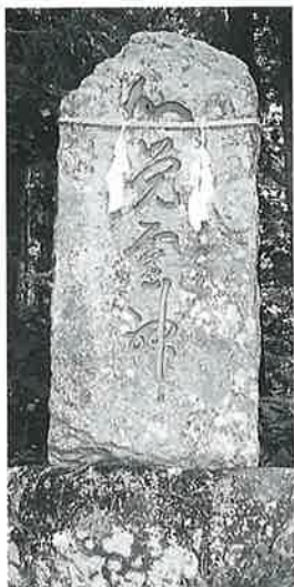
12 靈神碑(心覚靈神) 沓野上林 大正2年10月(175×23×29)