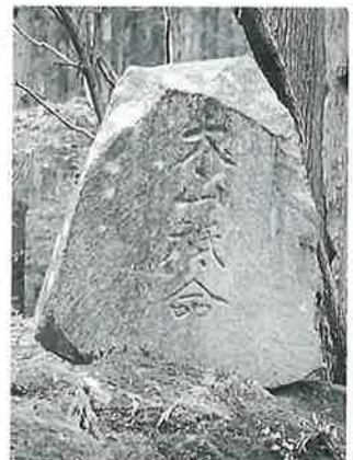
4 大山祇命 沓野十二沢 昭和14年4月(95×92×13)