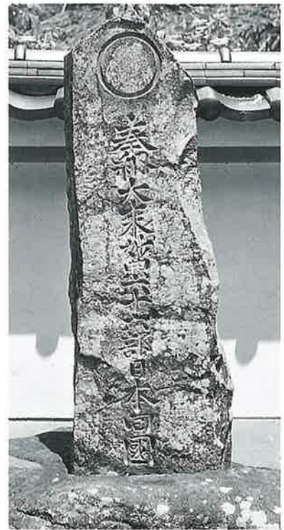
22 供養塔(六十六部廻国) 沓野観音寺境内 文政7年7月(150×50×16)