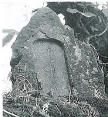
1 名号碑 南無阿弥陀仏 志賀高原