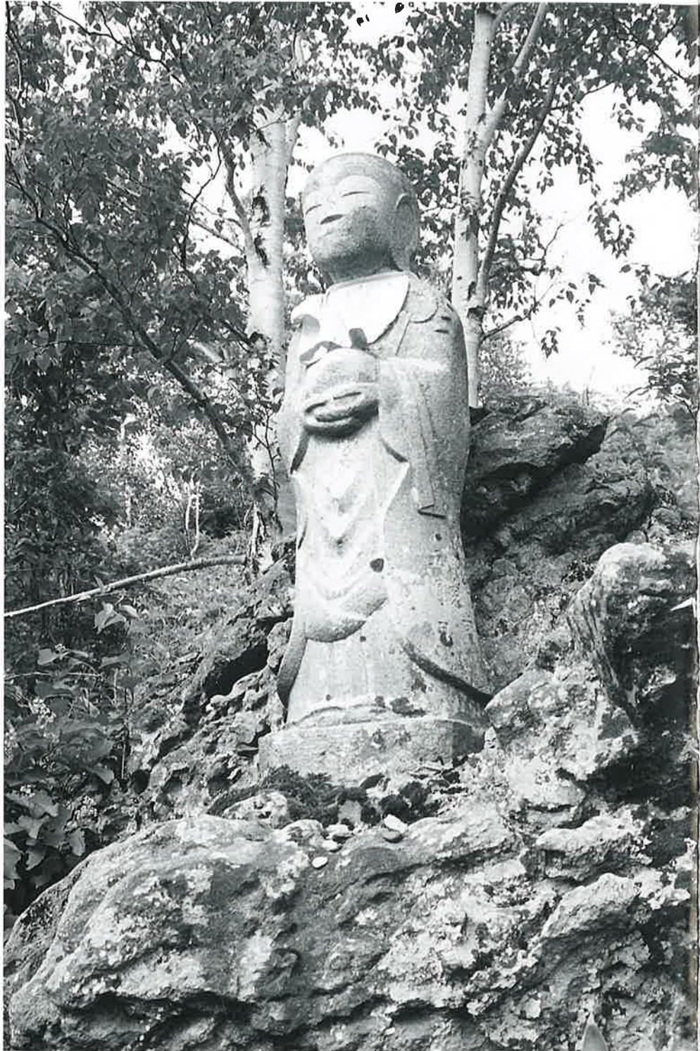
喜兵衛地藏 (志賀高原の部No.16)