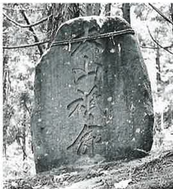
2 大山祇命 志賀高原 明治34年6月(120×90×40)