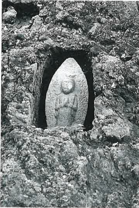
10 馬どめ観音 志賀高原河原小屋 安政6年 (45×20×15)