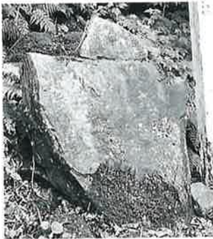
22-2 千手十一面観音 志賀高原 文政2年(90×66×20)