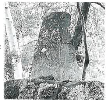
31 千手十一面観音 志賀高原 文政2 年(106×57×38)