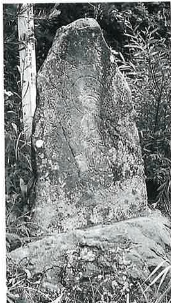
21 聖観音 志賀高原 文政2年(95×55×22)