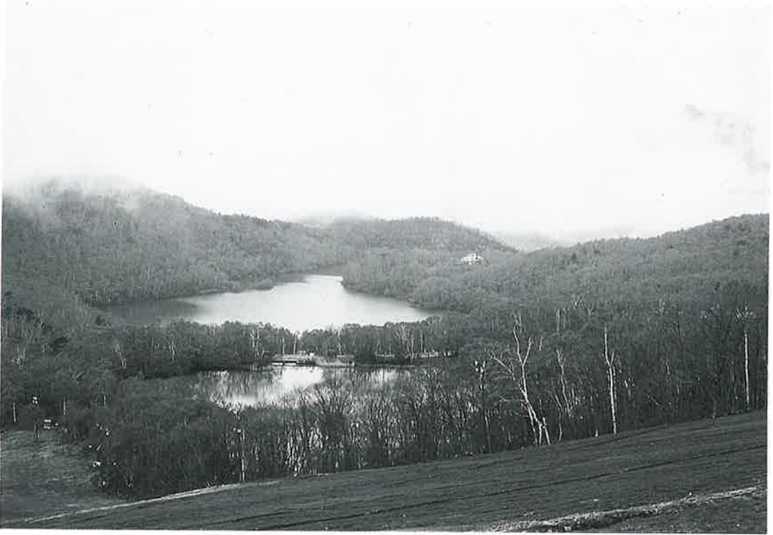
志賀高原 — 高原入り口の琵琶湖・丸池 —

上信越高原国立公園は、世界的な存在となっており、そのシンボルともいえる広大な志賀高原は、標高二、三二九呎の裏岩菅山をはじめ、多くの高山を含む数十峰にわたる一連の高原地帯である。 また、この高原の中には、大小三〇余の清澄な水を湛えた池や沼が散在して、樹林とともに自然の景観を豊かにしている。