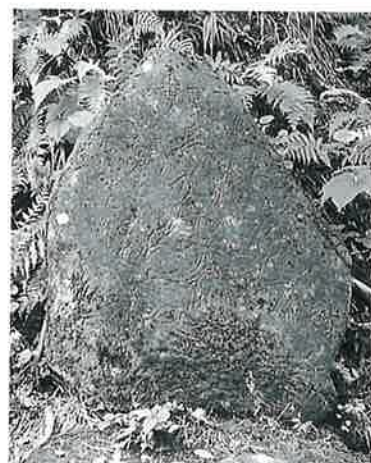
11 准胝観音 志賀高原 文政2年 (90×65×18)