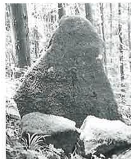
7 二臂如意輪観音 志賀高原 文政2年(80×63×13)