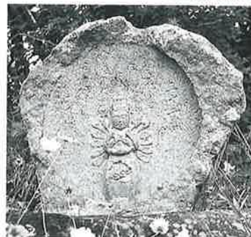
32 千手千眼観音 志賀高原 文政2年 (80×87×33)