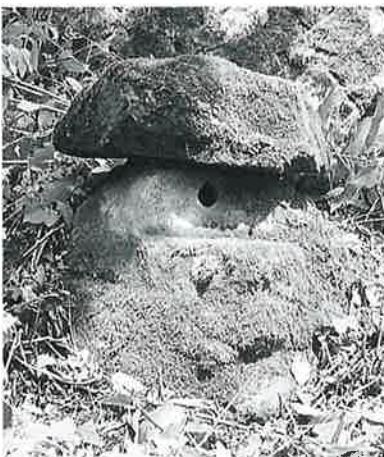
7 飛沙門天塔 志賀高原(210×100×80)