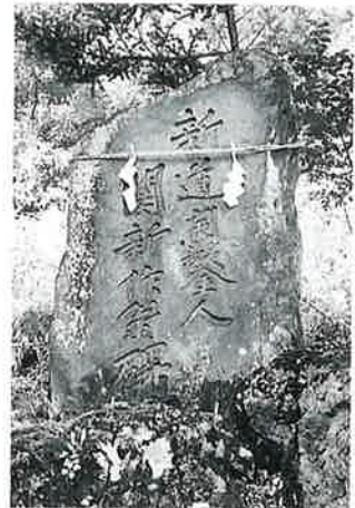
8 頌徳碑(関新作) 志賀高原 沓打 明治34年8月(185× 115×43)