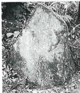
24 十一面観音 志賀高原 文政2年(105×67×32)