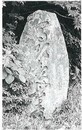
17 馬頭観音 志賀高原陽坂 天保13年9月(200×60×40)