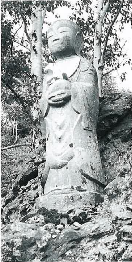
16 喜兵衛地藏 志賀高原平床 安永8年5月 (141×46×33)