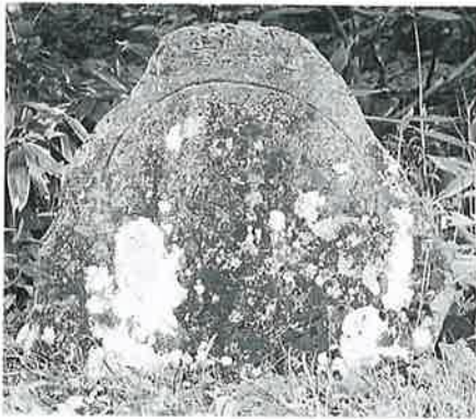
30 千手千眼観音 志賀高原 文政2年(78 ×78×25)