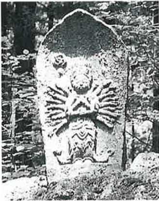
2 十一面観音 志賀高原 文政2年(76×40×17)