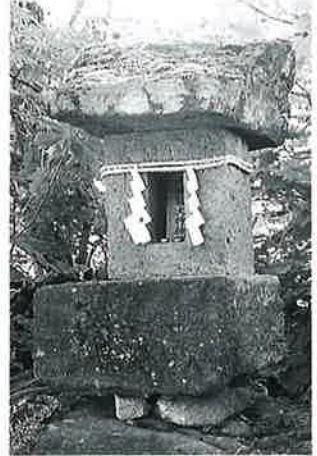
14 九頭竜権現祠 志賀高原丸池(55×34×27)