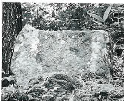
9 不空絹索観音 志賀高原 文政2年 (64×75×14)