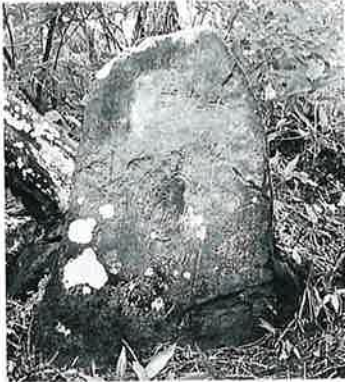
19 千手観音 志賀高原 文政2年(90×53×20)