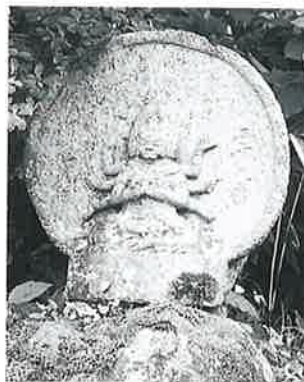
29 馬頭観音 志賀高原 文政 2年(67×65×27)