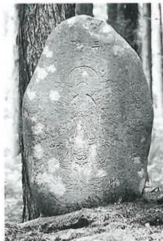
3-2 千手千眼観音 志賀高原 文政2年(78×54×16)