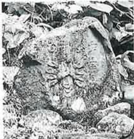
23 千手十一面観音 志賀高原 文政2年(60×56×23)