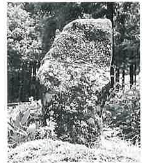
4 千手観音 志賀高原 文政2年(92×46×10)