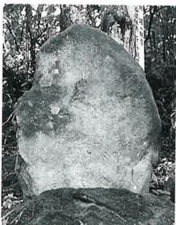
16 千手観音 志賀高原 文政2年(98×63×20)