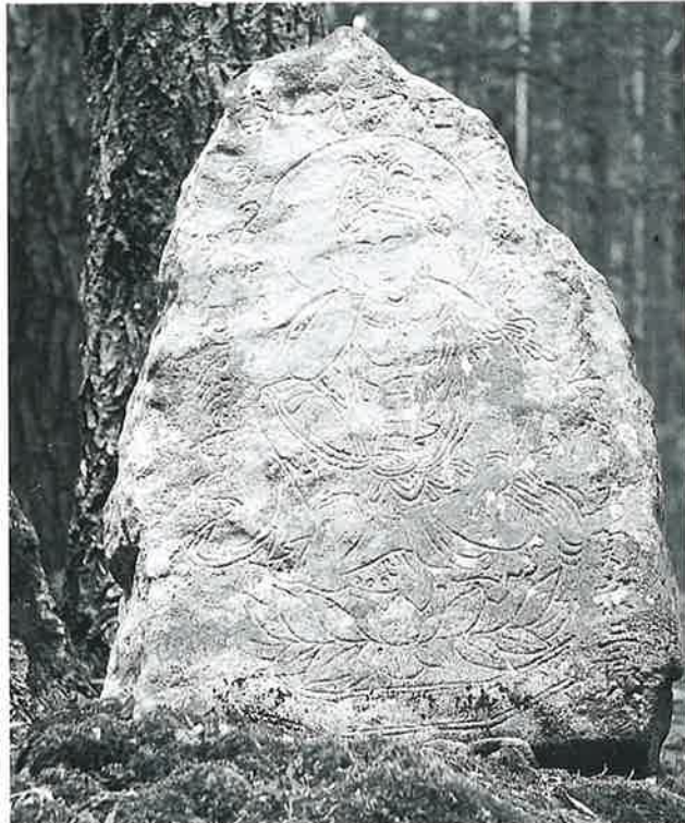
1 如意輪観音 志賀高原(74×46×18)