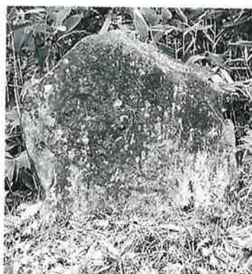
12 千手観音 志賀高原 文政2年 (88×98×33)