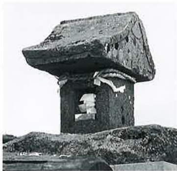
20 横手山神社祠 横手山頂 (44×18×19)