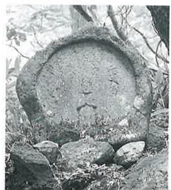
28 聖観音 志賀高原 文政2年 (70×68×25)