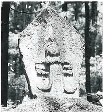
3 観世音 志賀高原(76×40×17)