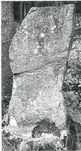
3-1 千手千眼観音 志賀高原(70×42×16)