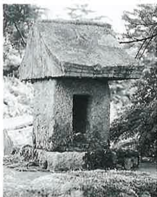
26 稚児池祠 焼額山頂 昭和28年(42×25)