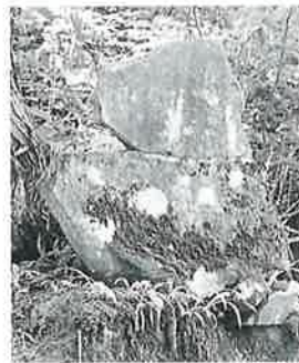
6 千手千眼観音 志賀高原 文政2年(98×83×10)