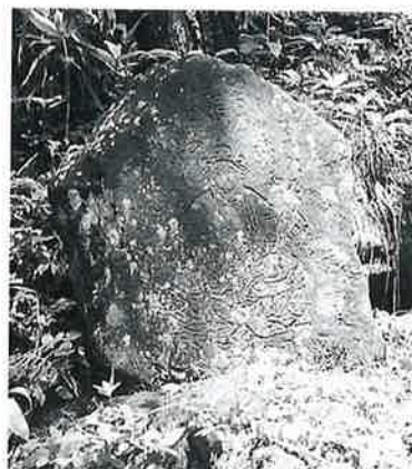
13 二臂如意輪観音 志賀高原 文政2年(78×66×22)