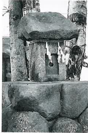
石 祠 志賀高原河原小屋 (75×52×33)