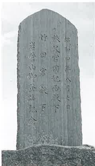
24 記念碑(秩父宮登山) 岩菅山頂 昭和4年8月(200×64×10)