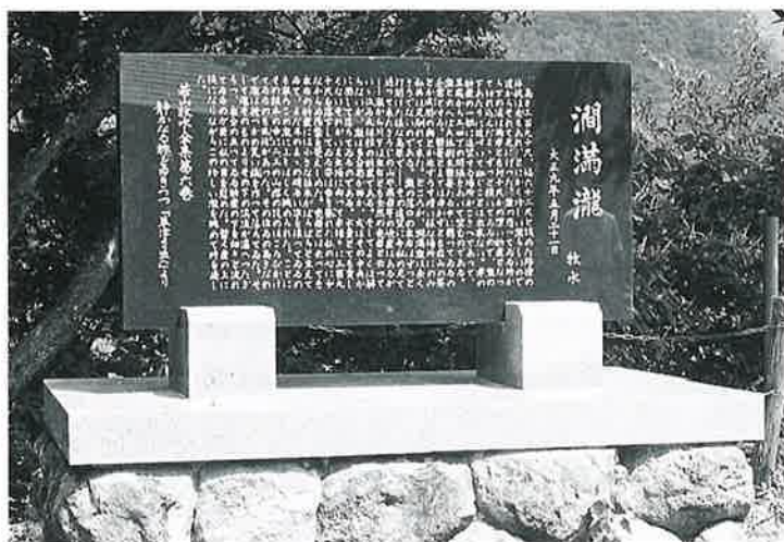
4 文学碑(若山牧水) 志賀高原 昭和60年(100×200×15)