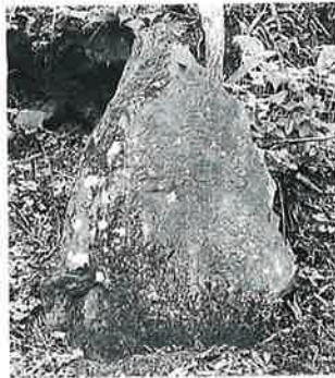
22-1 千手観音 志賀高原 文政2年(100×63×20)