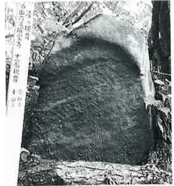
17 十一面観音 志賀高原 文政2年(120×62×20)