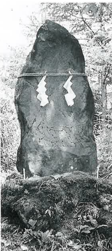
6 岩菅権現碑(不動明王) 志賀高原 菅打(140×68×30)