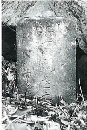
15 牛馬観音 志賀高原丸池 (36×22×8)