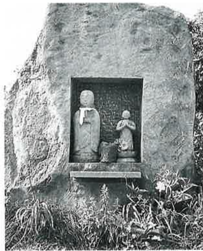
19 親子地藏尊 志賀高原波峠 幕末(70×60×60)