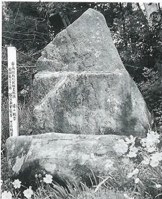
33 十一面観音 志賀高原 文政2年(130×94×22)