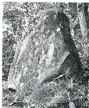
15 十一面観音 志賀高原 文政2年(80×63×20)