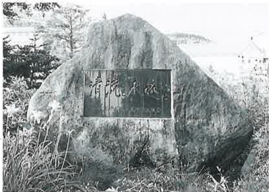
22 記念碑(汚水処理) 志賀高原一の瀬(210×270)