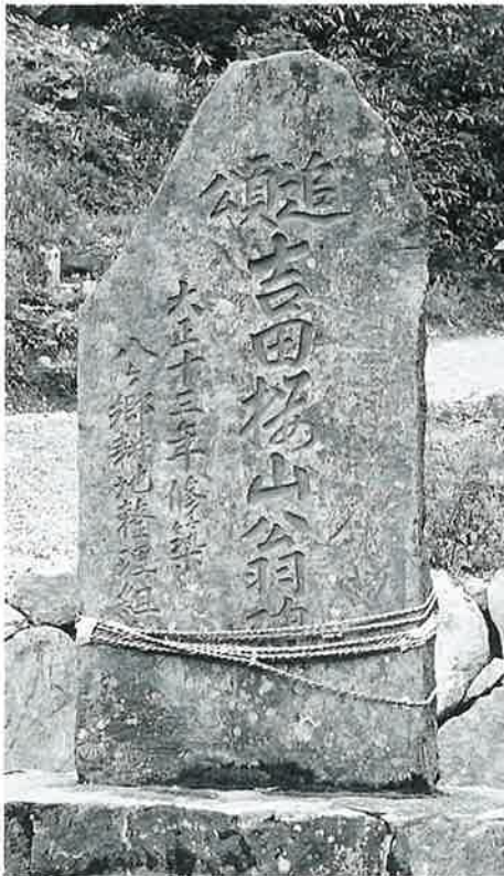
21 頌徳碑(吉田桜山) 志賀高原大沼池 大正13年(188×22×19)