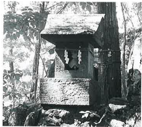
11 弁天宮 志賀高原ヒワ池 明治初年(67×33×30)