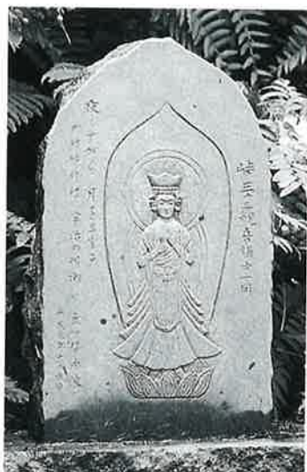
10 千手観音 志賀高原 文政2年 (78×46×20)