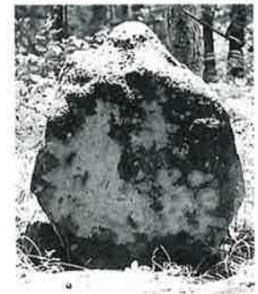
5 十一面千手千眼観音 志賀高原 文政2年(90×60×19)