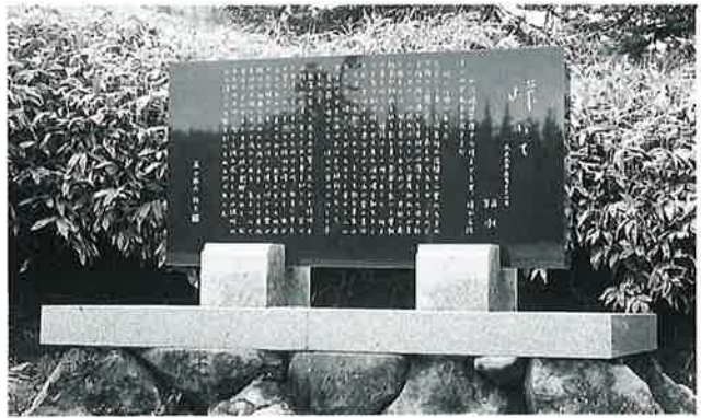
18 文学碑(若山牧水) 志賀高原波峠 昭和60年(100×200×16)