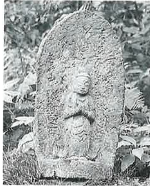
26 聖観音 志賀高原 文政 2年(70×37×18)