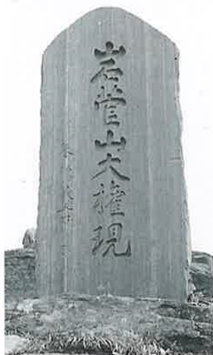
23 岩菅山大権現 岩菅山頂 昭和4年9月(180×90×6)