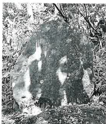
14 如意輪観音 志賀高原 文政2年(105×80×24)