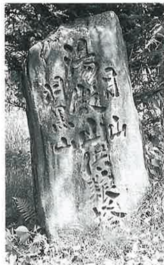
5 供養塔(出羽三山) 志賀高原 菅打 文化6年6月(142×80×48)