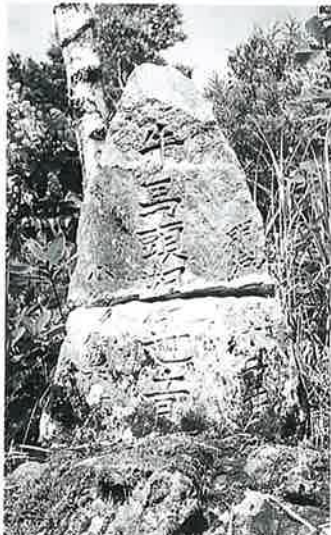
13 牛馬頭観音 志賀高原丸池 明治43年(321×180×8)