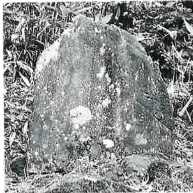
18 如意輪観音 志賀高原 文政2年(87×60×21)