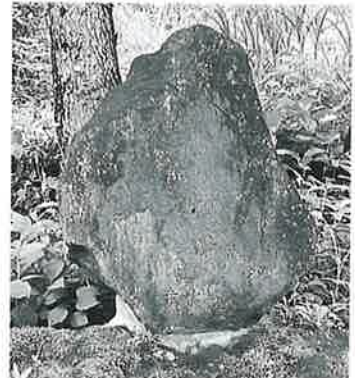
25 千手十一面観音 志賀高原 文政2年(100×80×33)