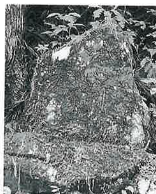
8 十一面観音 志賀高原 文政2年(70×58×20)