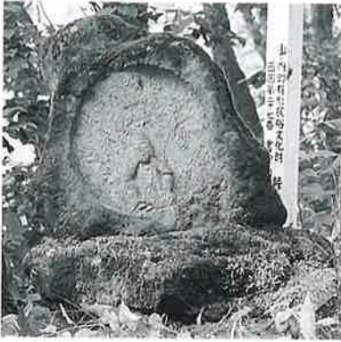
27 如意輪観音 志賀高原 文政2年 (66×66×33)