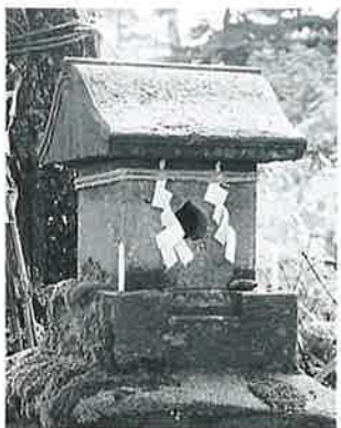
27 焼額山神社祠 焼額山頂 文政9年7月(45×25)