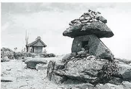
25 毘沙門天祠 岩菅山頂(210×100×80)