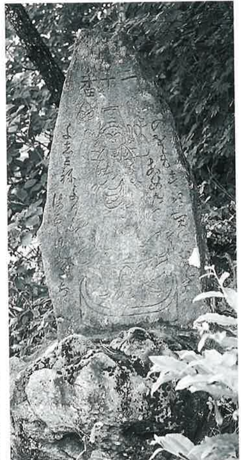
20 千手観音 志賀高原 文政2年(95×52×18)