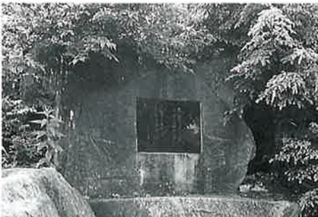
28 歌碑(三好達治) 東館山頂 昭和58年(180×200×80)