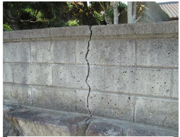
劣化等によりひびが入り危険なブロック塀

ブロック塀等の所有者の皆様におかれましては、ブロック塀が安全であるか点検をお願いします。