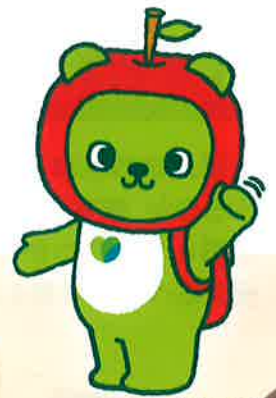
長野県PRキャラクター「アルクマ」