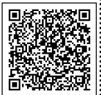
山ノ内町ファミリー・サポート・センター