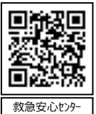
救急安心センター