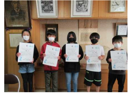
科学作品展賞状授与

参観日に「おおぞらShop」を開きました。大勢のお客さんへの対応をがんばりました。